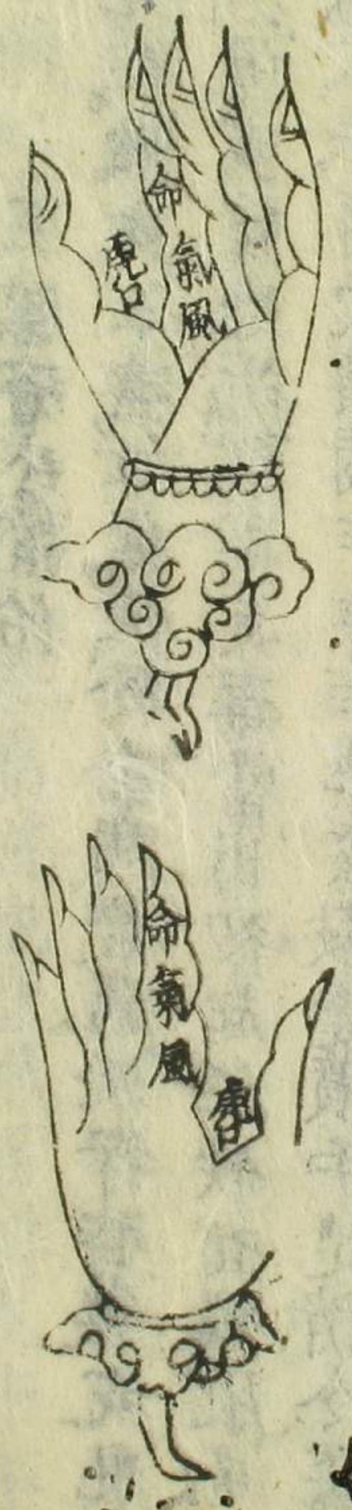
附虎口三關脈症圖

水鏡訣云陰陽運合男女成形已分九竅四臟乃生五臟六腑部位各分逆順難明若憑寸口之浮沉必及橫亡於孩子須明虎口辨別三關消詳用藥必無差誤未至三歲看虎口三關若脈見風關尚易治交氣關則難治交命關為死症又當辨其色如獸驚三關必青水驚三關必赤人驚三關必黑若紫色主瀉痢黃色是雷驚