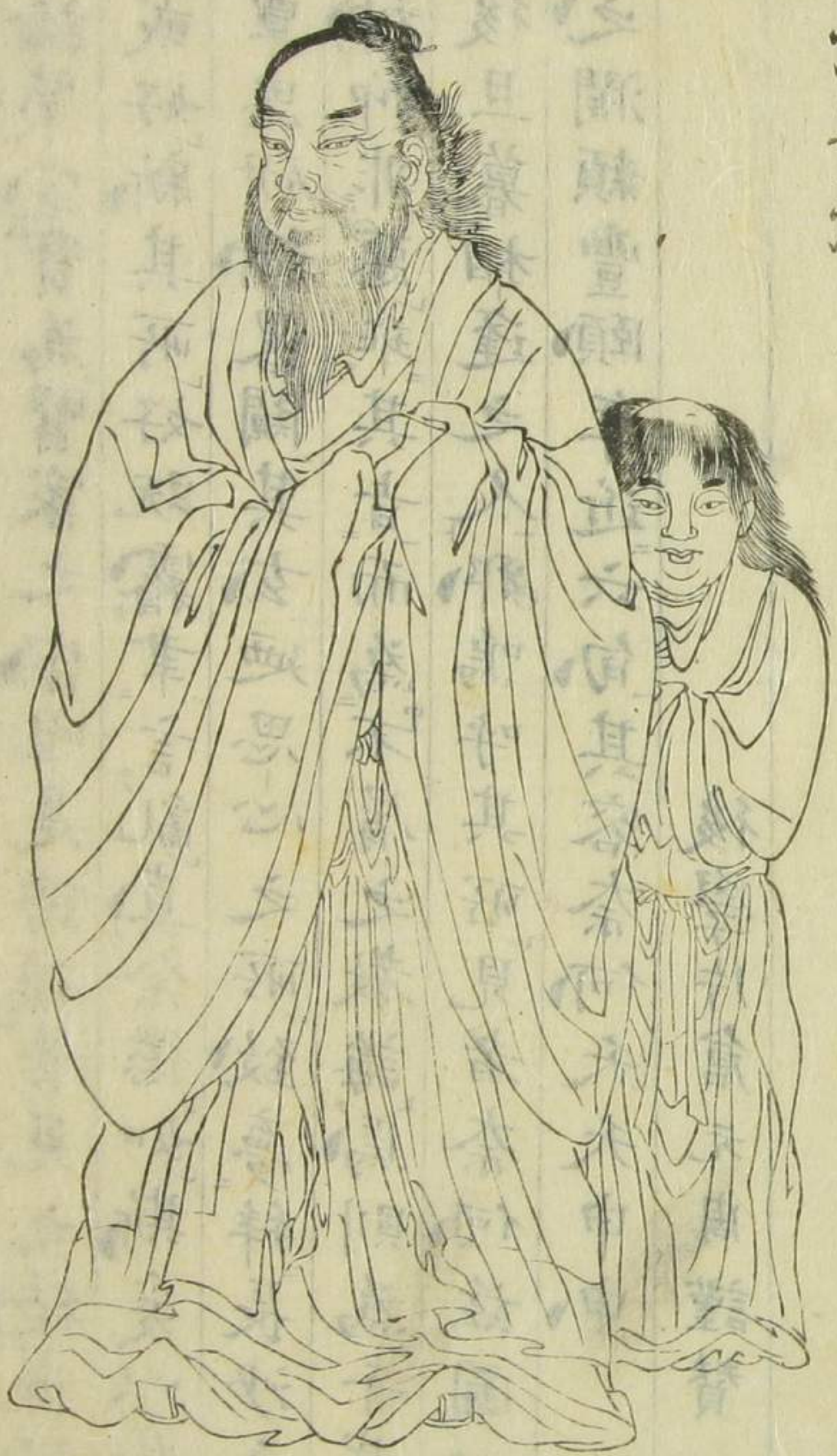
友人寒曦馬孟熙畫