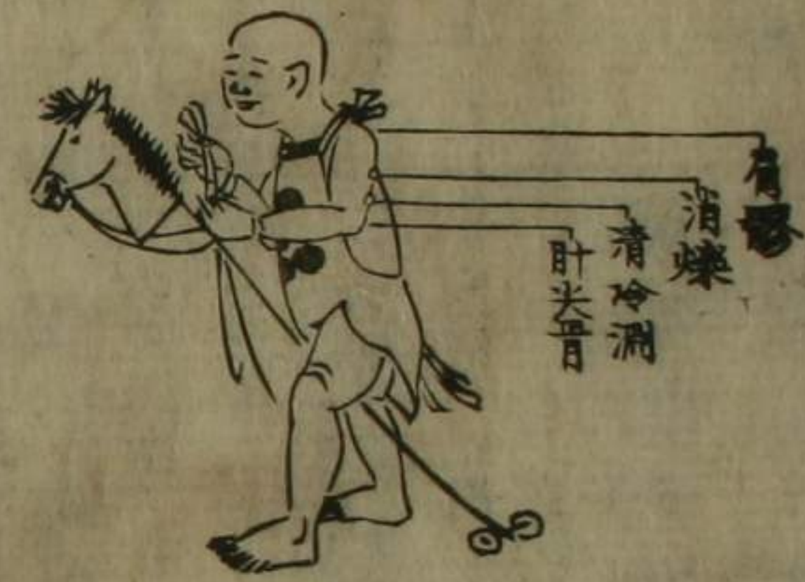
執 刀 式