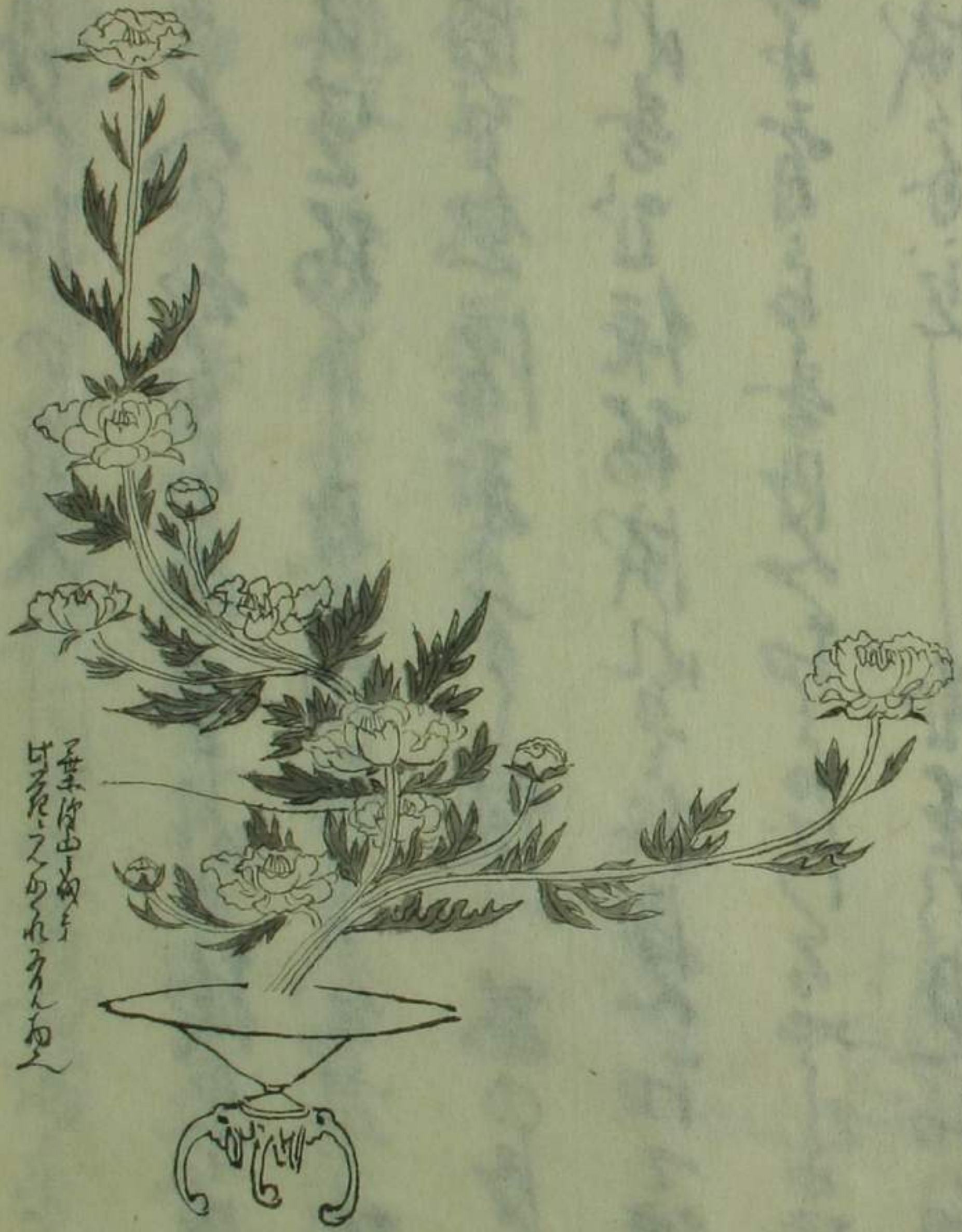
五葉中其也 其花之也乃也

見陸也八何速成之天痛為乃時有物又得六 菊初開也葉薄也背中也葉陸也云云葉 也之也也也外是也短又花乃少葉中其 花才不亦乃也其何乃也——又云云 花亦不其也則也云云是也其也 如之也