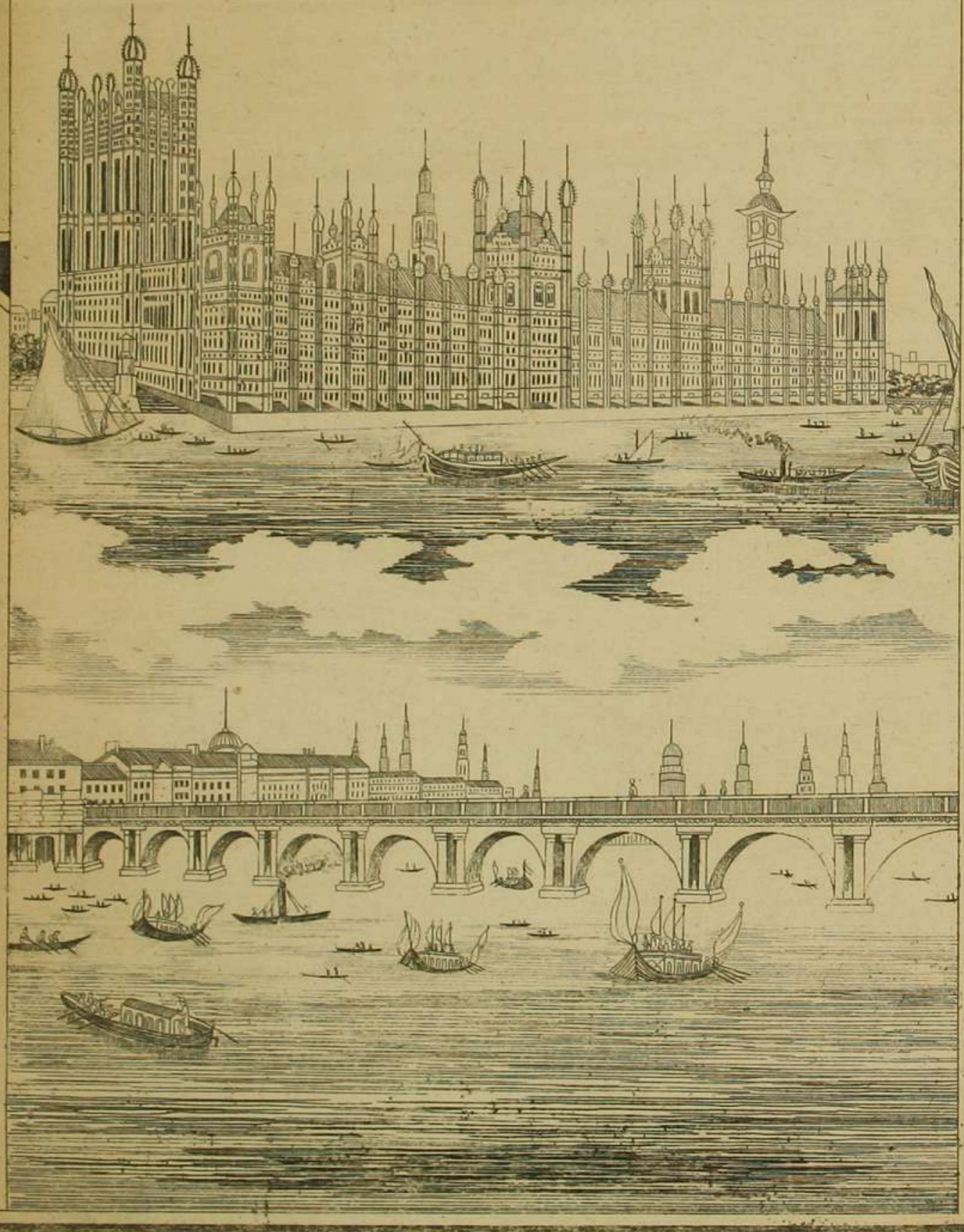
龍動橋及議事院之圖