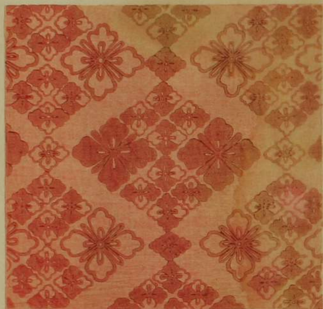
單 綾 紅