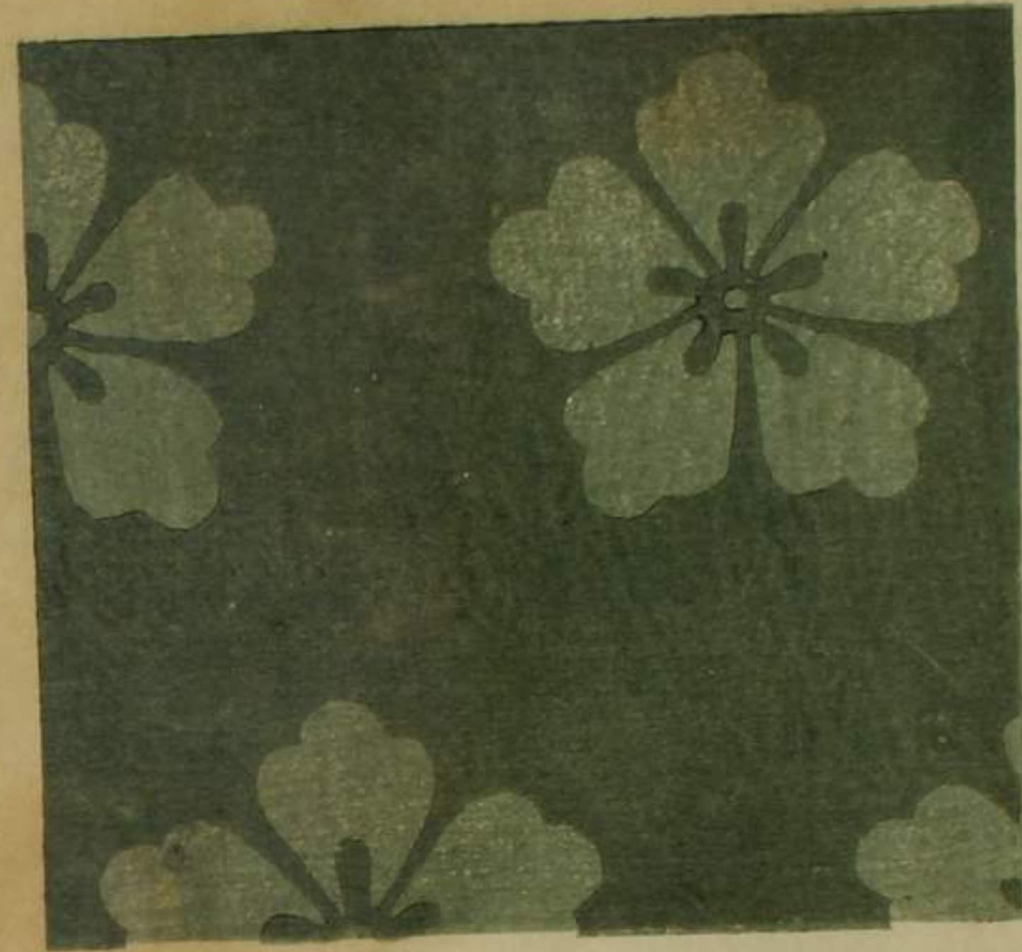
表 着 浮前 織木 物 裏 紅 平 繪