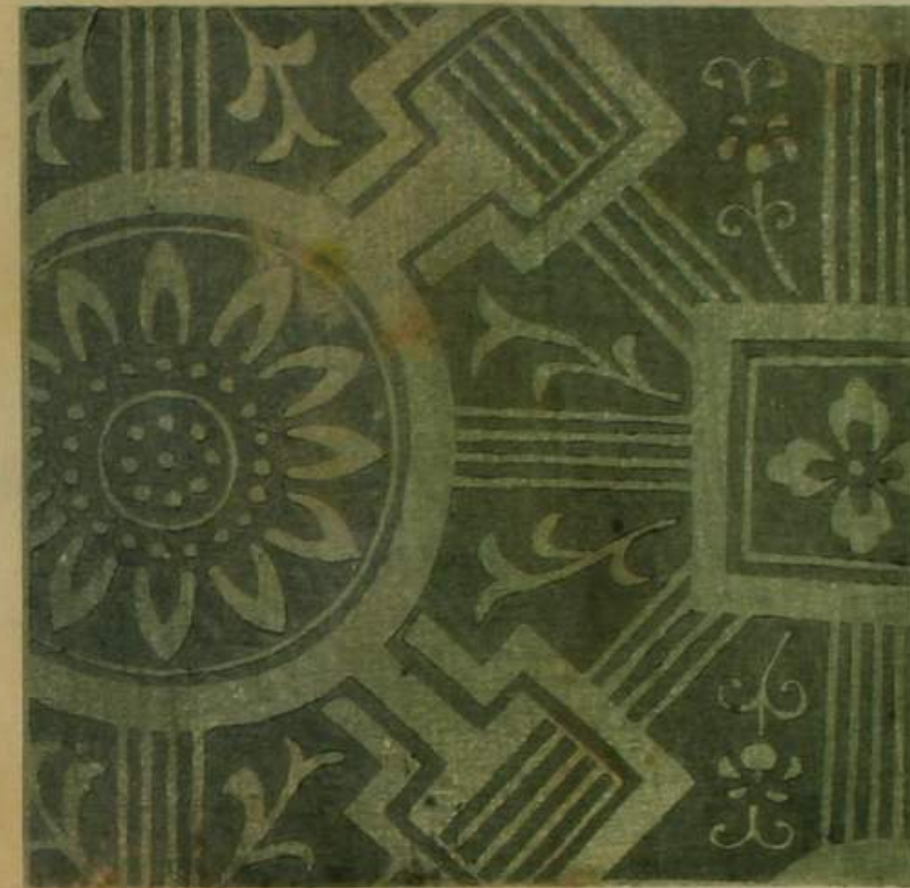
御小襦 浮前黄 織物 裏紅 中倍 了平 り給