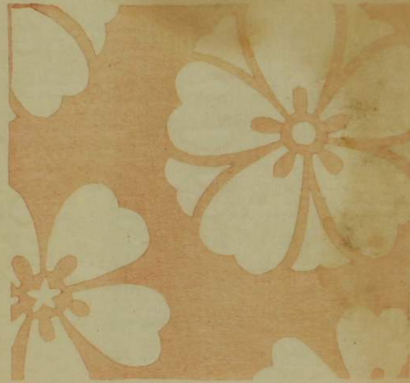
五ッ衣 固緯 燦白 物任紅 平裏 繪紅