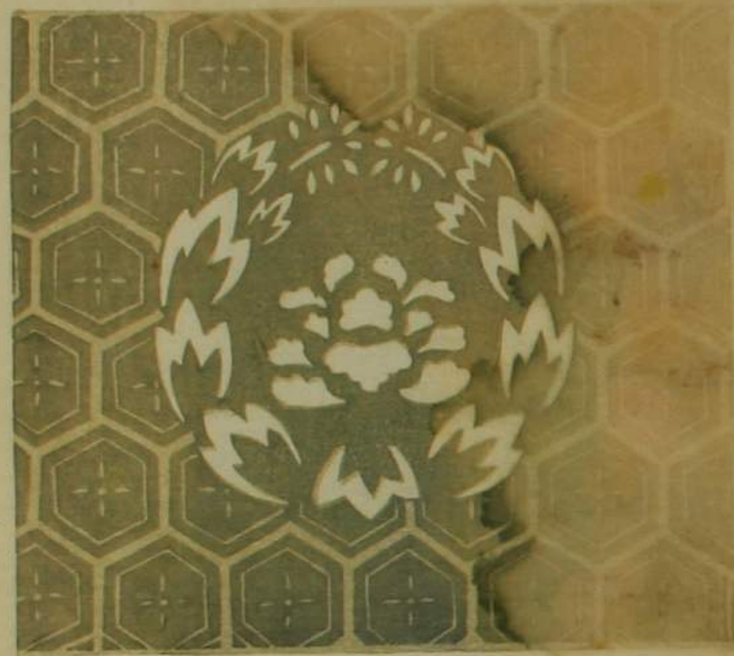
女御御装束 御唐衣二倍織物浮