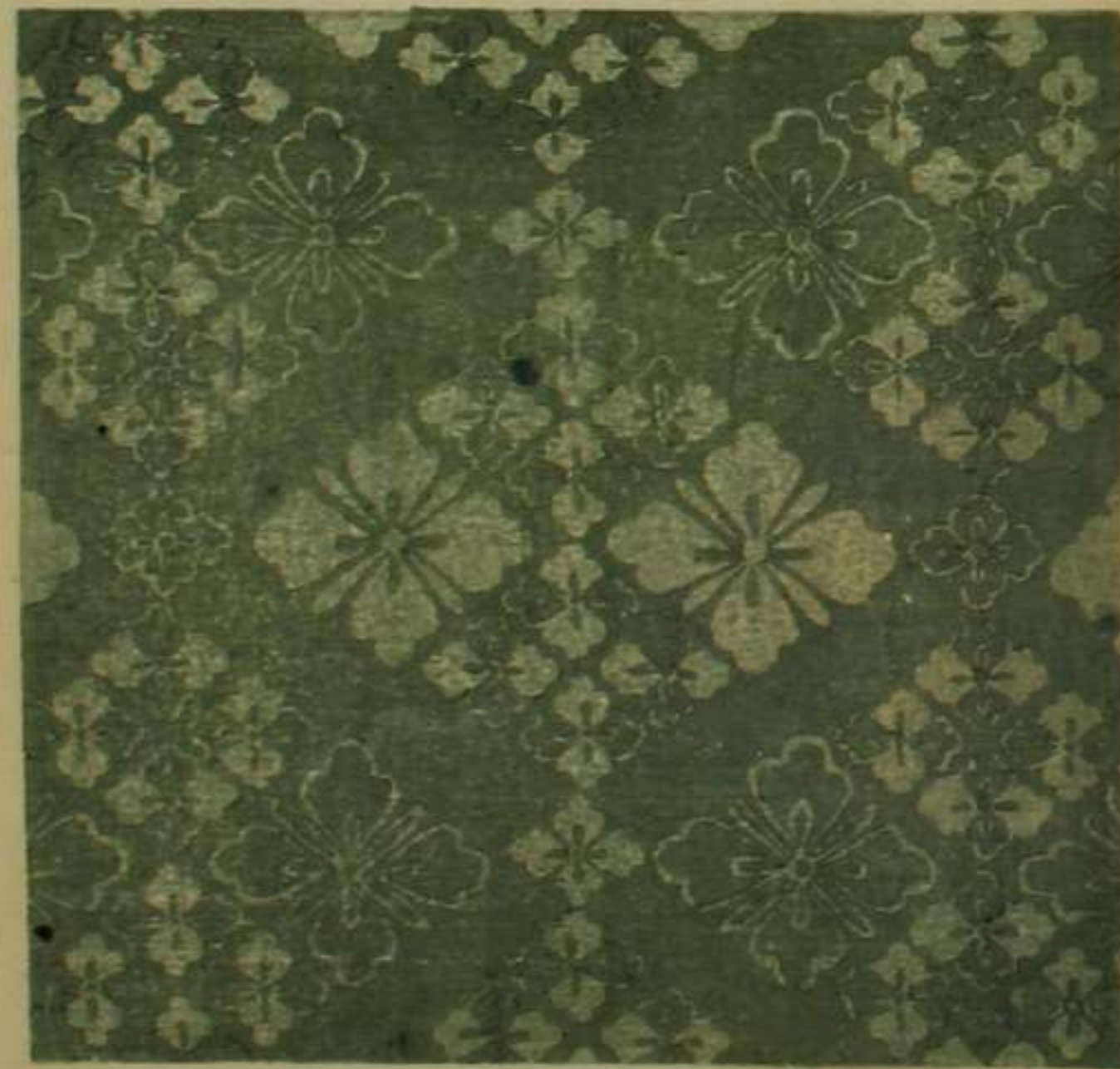
單 前綾 黃 少衣前 同