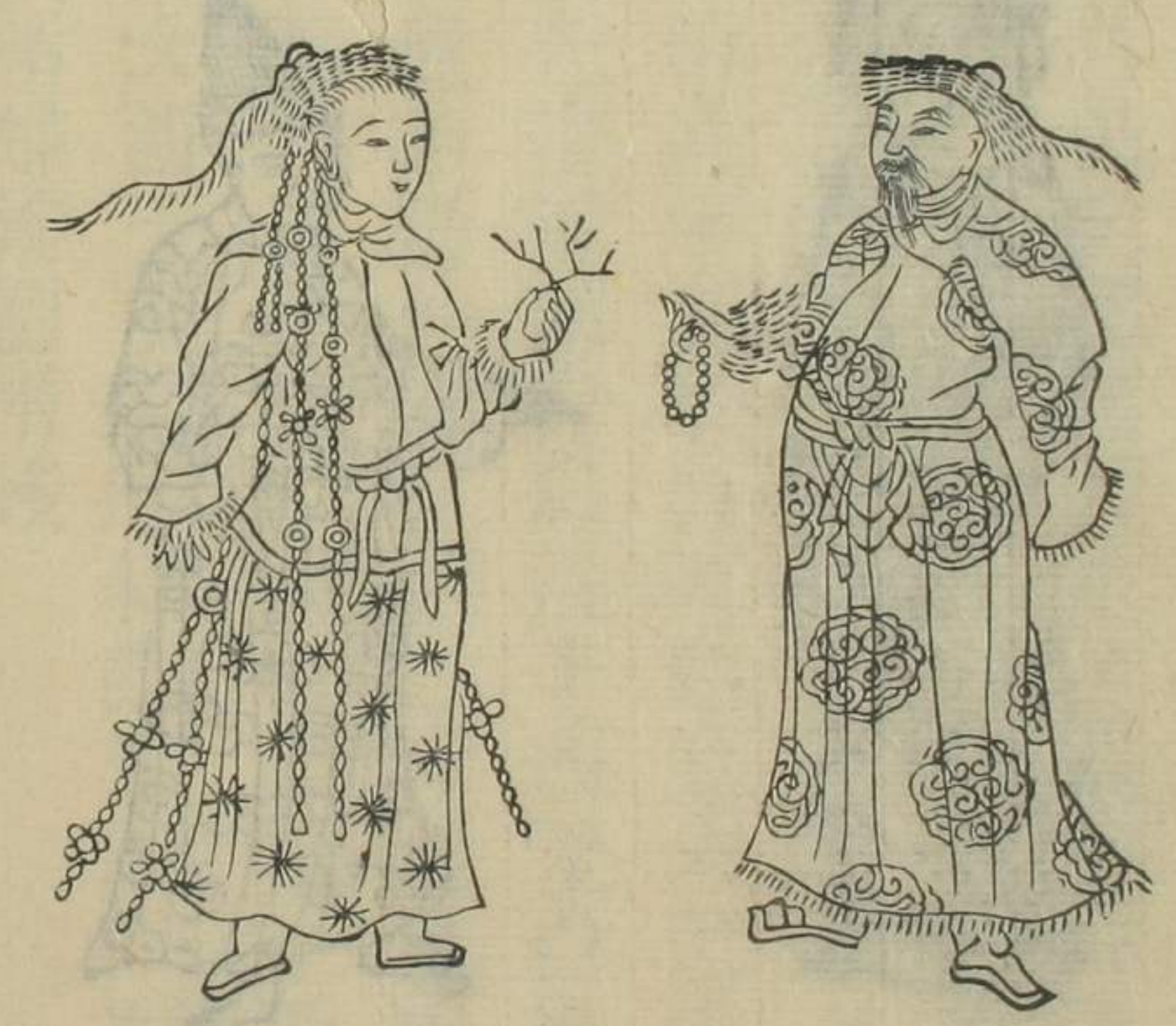
木魯烏素番民婦圖