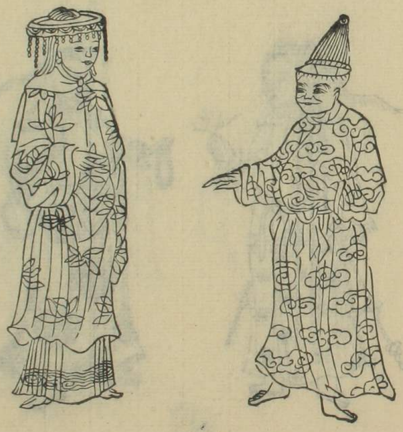
阿里噶爾渡番民番婦圖