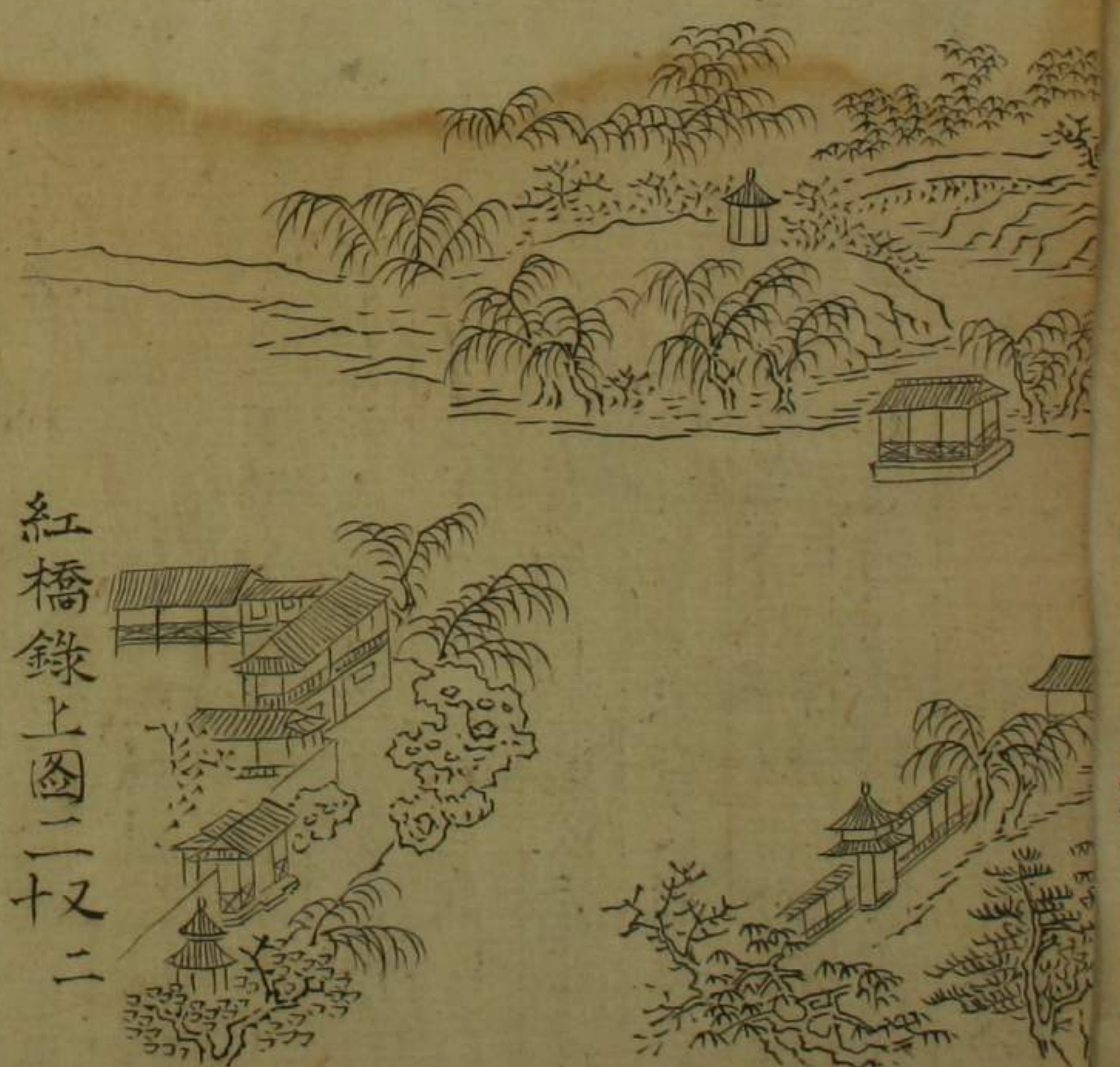
紅橋錄上圖二又二