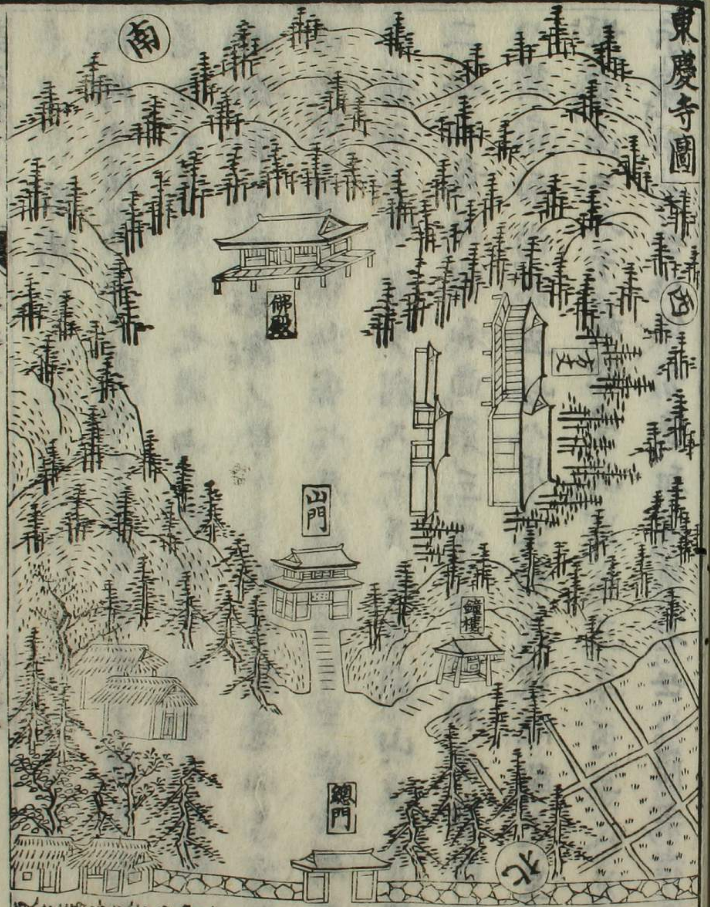
東慶寺右塔頭道場圖