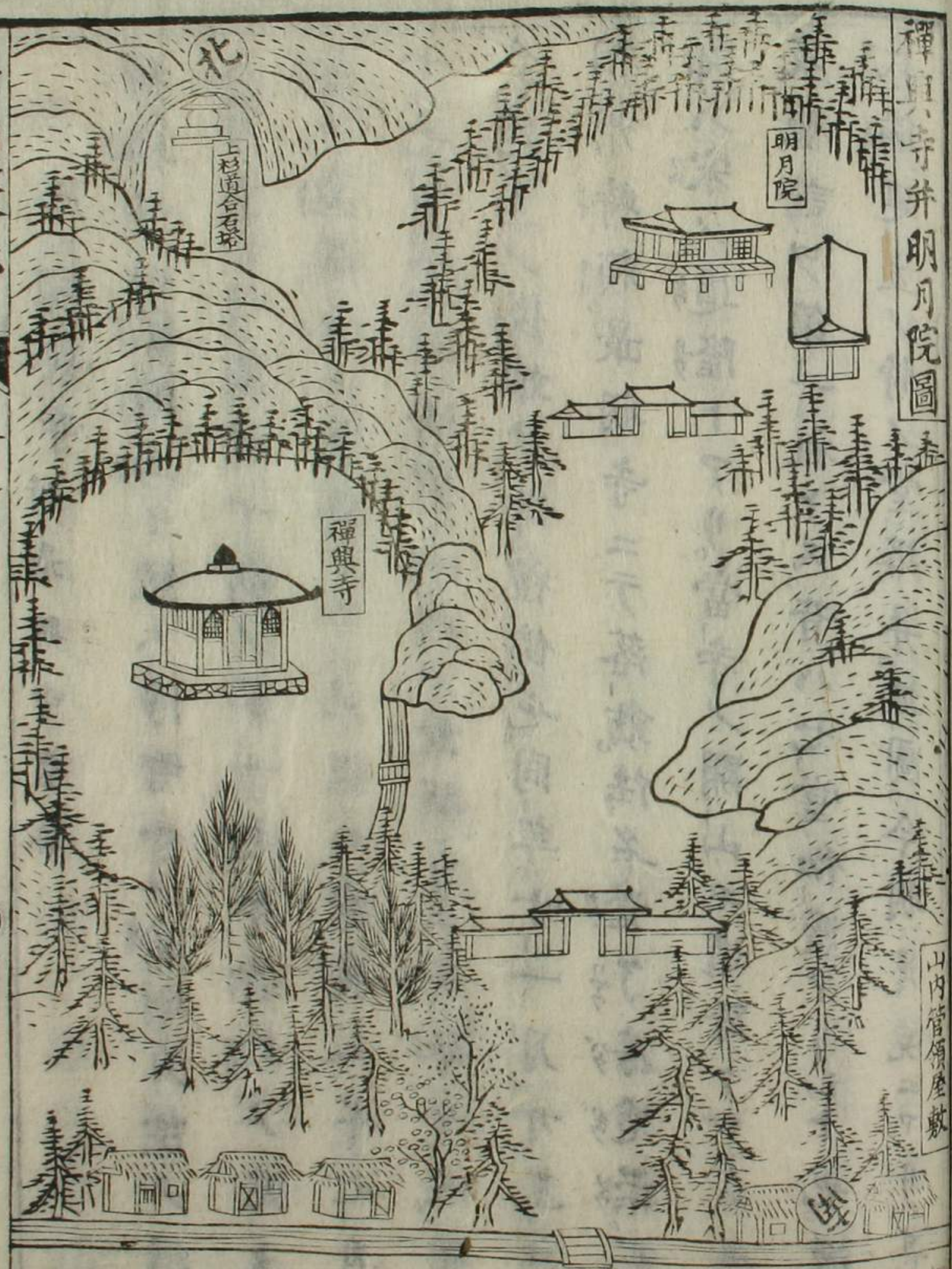
禪興寺并明月院圖

○管領屋敷 大將大將 淨智寺 尾藤左衛門尉殿 越後守貞顯 佛日菴 小田原ヨリノ文書 鼻頭谷