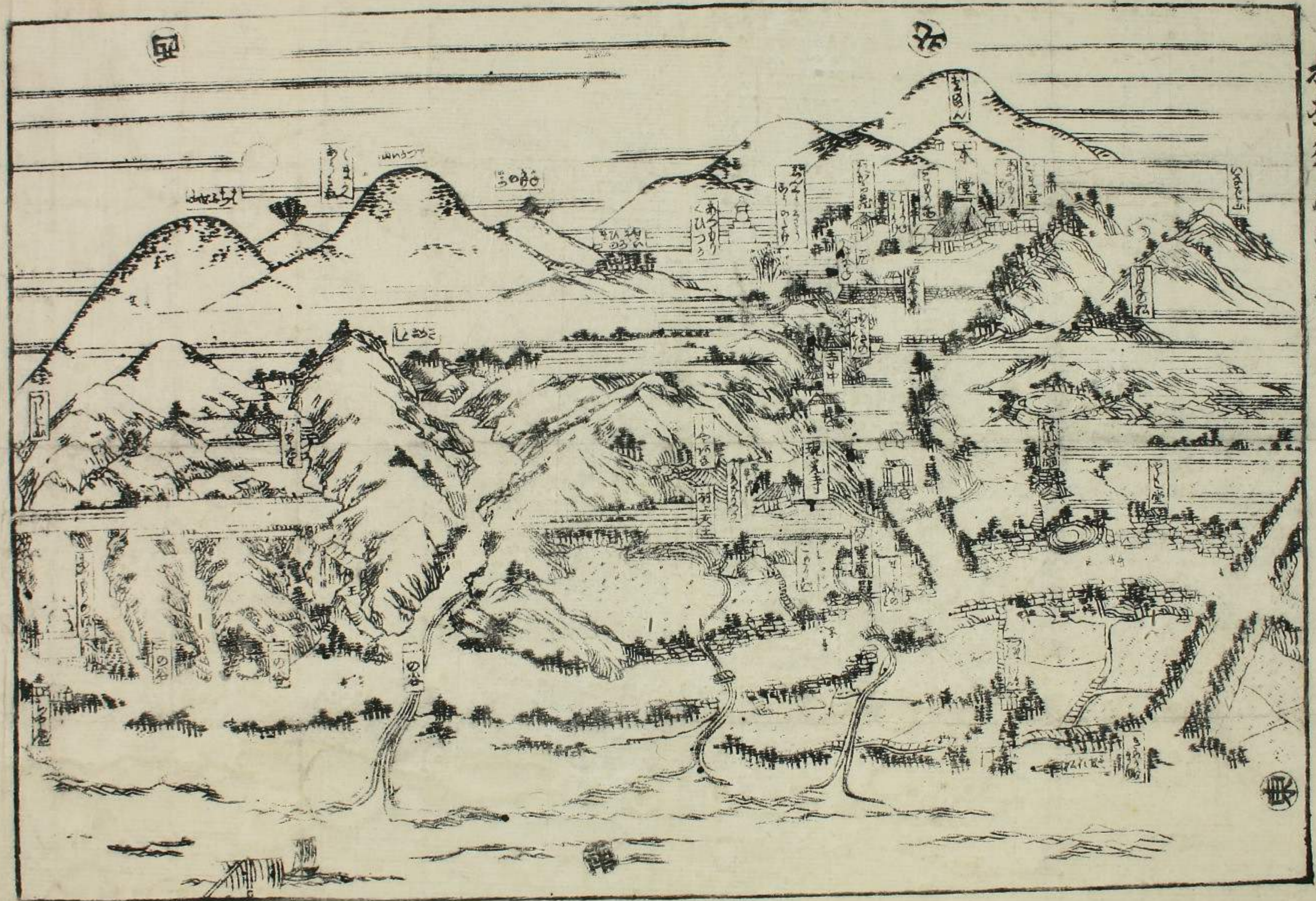
根別須磨浦細見圖

A 1 2 3 4 5 6 M 8 9 10 11 12 13 14 15 B 17 18 19