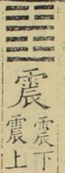
震 震下 震上

凡烹飪之事以剛柔得節為功文王世子曰食上必在視寒煖之節寒煖即剛柔也食醫曰凡食齊視春時羹齊視夏時醬齊視秋時飲齊視冬時烹人曰掌共鼎鑊以給水火之齊齊即節也水火冬夏皆剛柔之號也凡易中節字皆謂數度之宜非若俗閒以裁減為節也