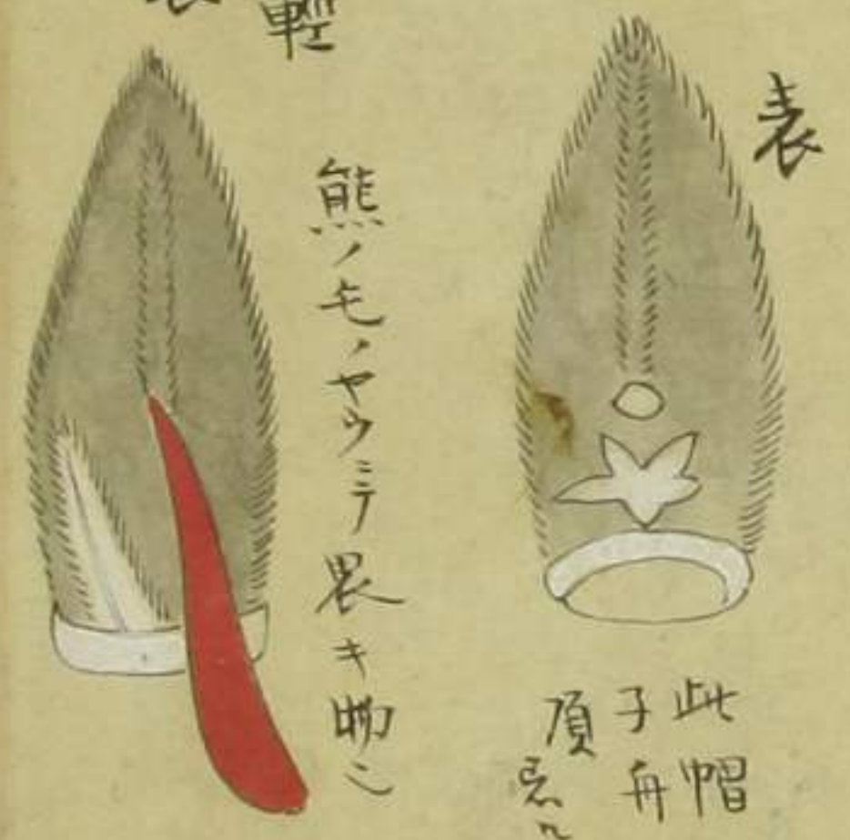
表 此帽 子舟 頂 熊ノ毛、ヤウナ長キ助 足輕 裏