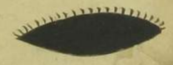
黒毛 小孩 十少冠