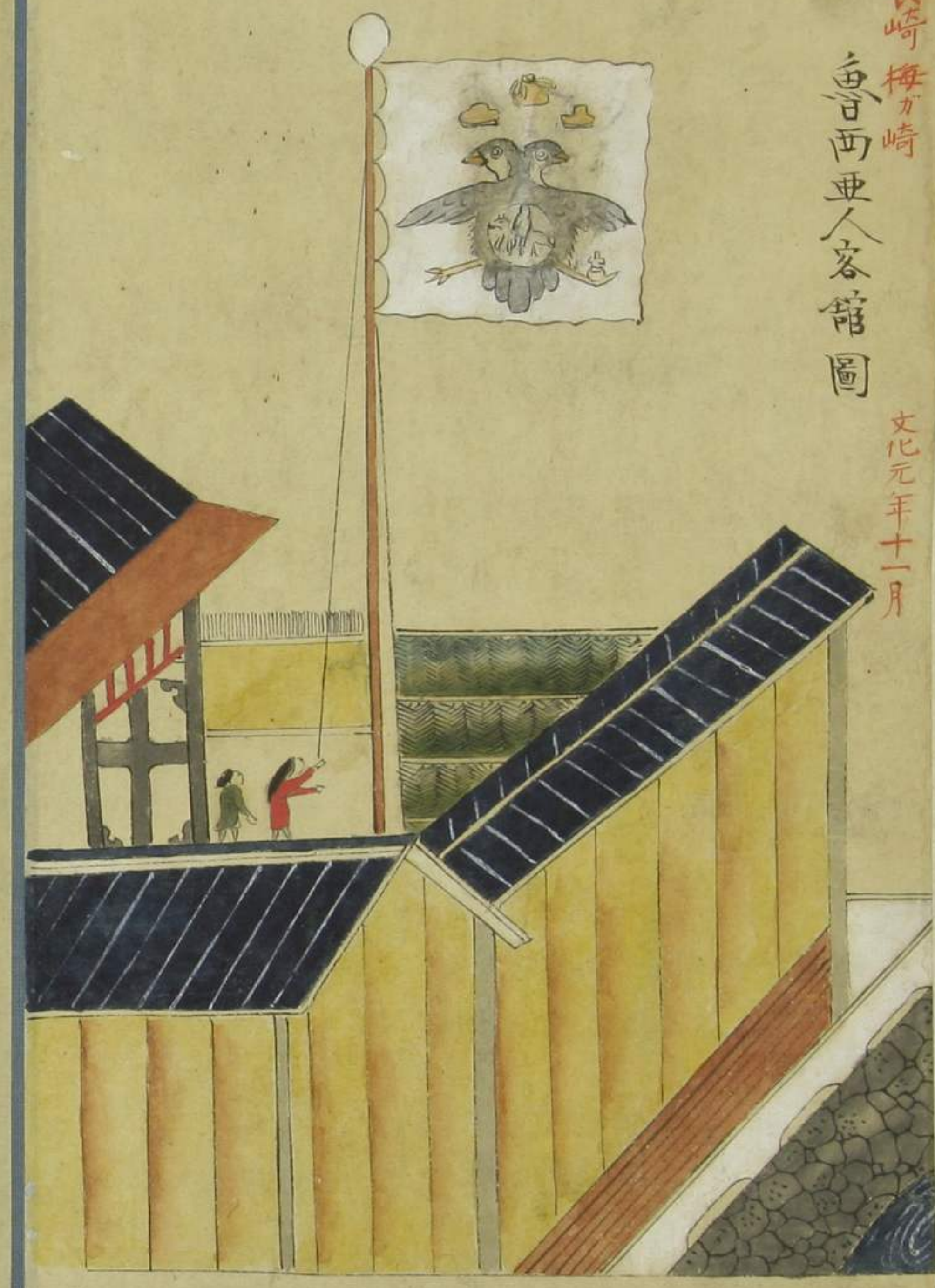
魯西亞國船印小旗圖