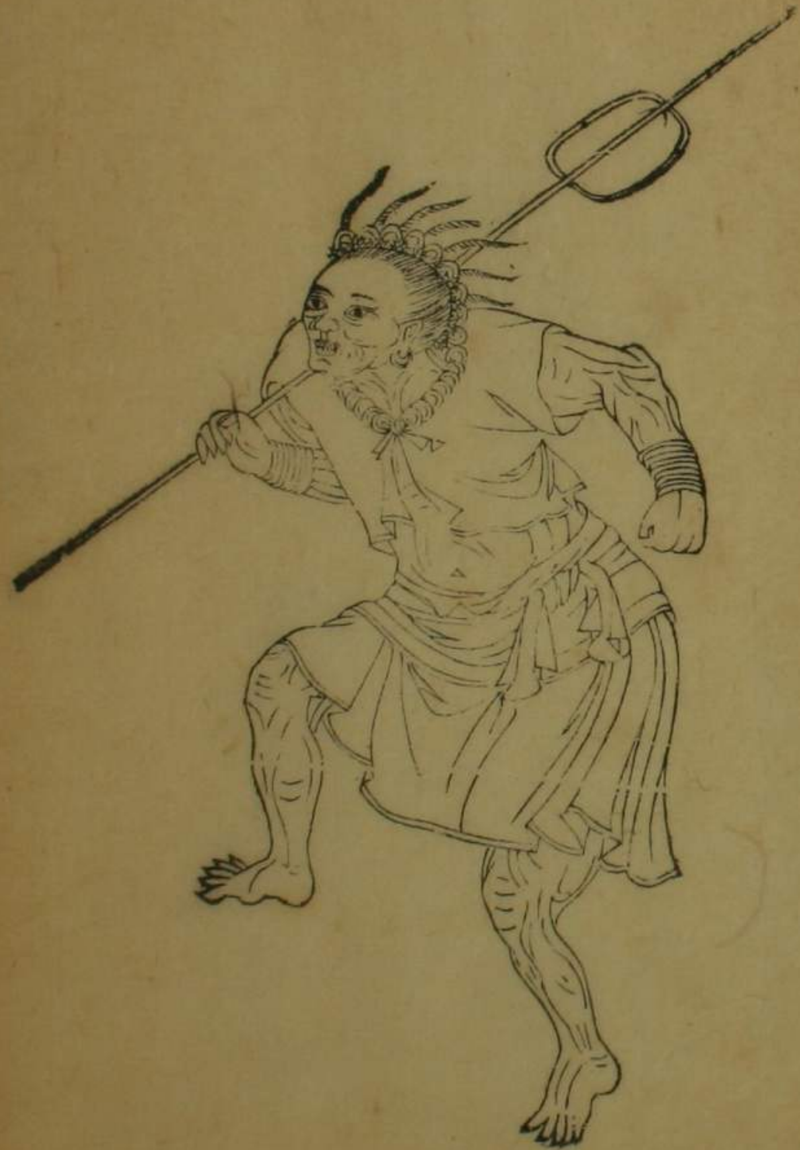
彰化縣西螺等社熟番