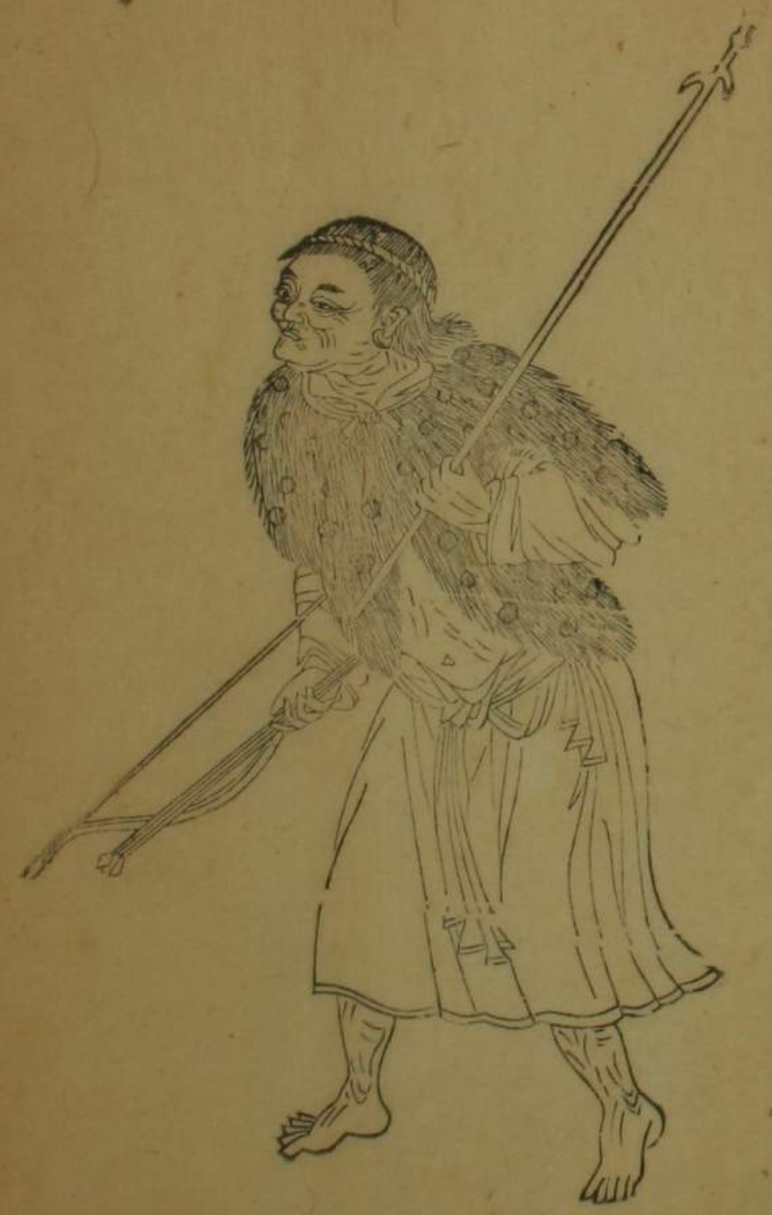
鳳山縣山猪毛等社歸化生番