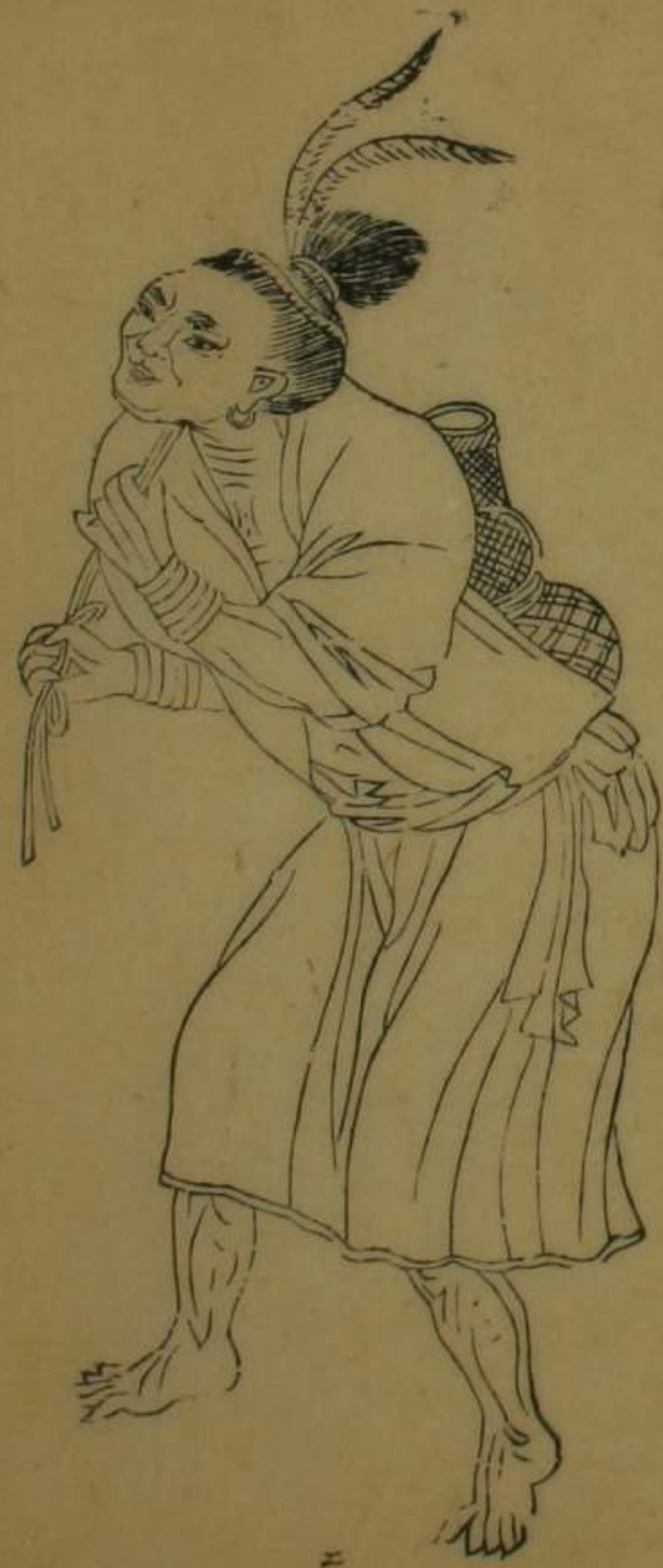
臺灣縣大傑嶺等社熟番