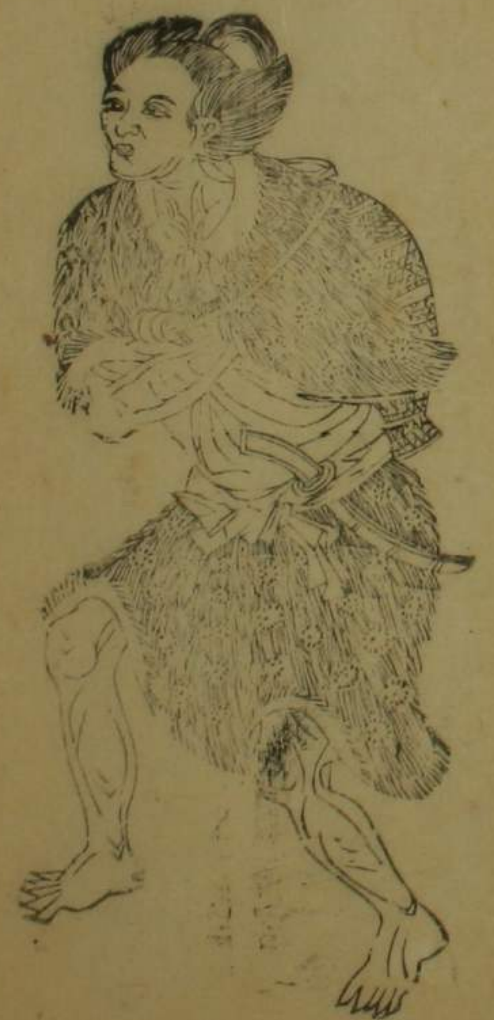
彰化縣水沙連等社歸化生番