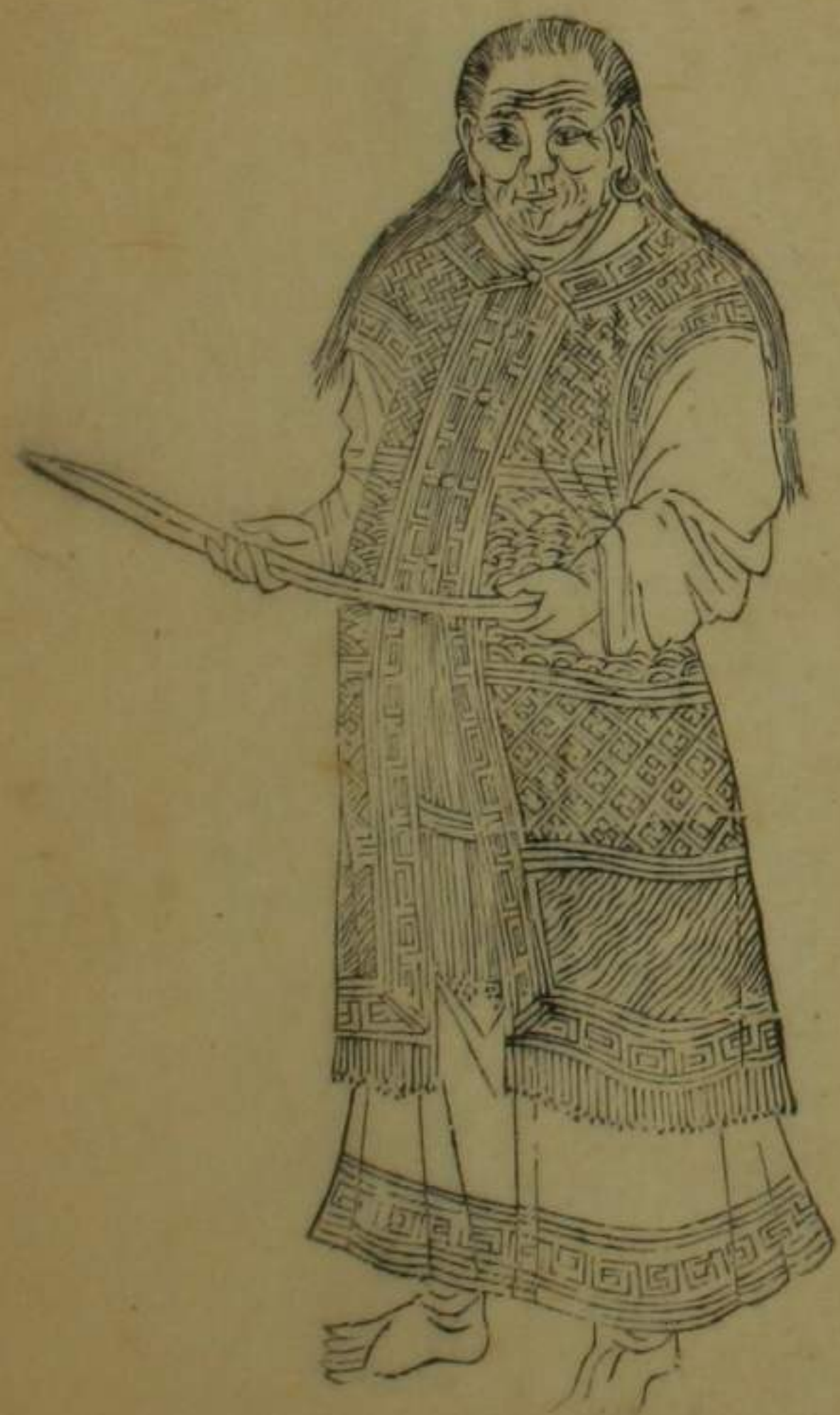
淡水廳竹塹等社熟番