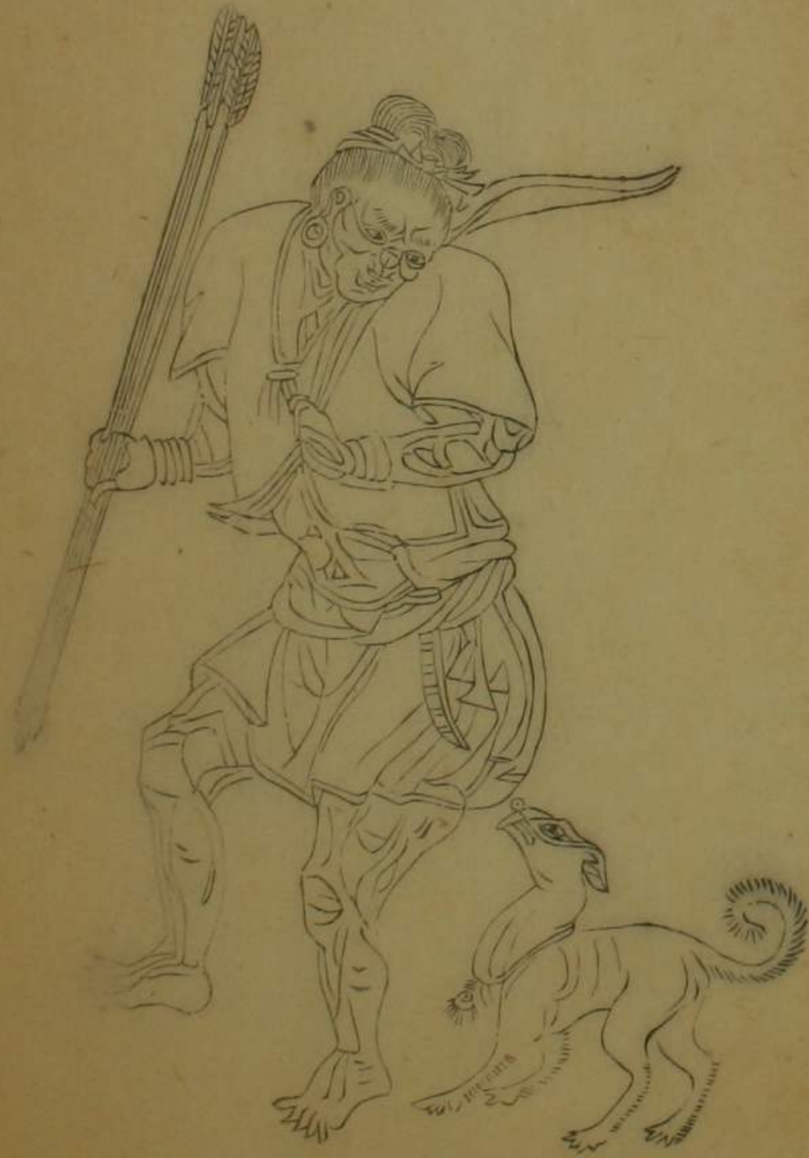
彰化縣大肚等社熟番