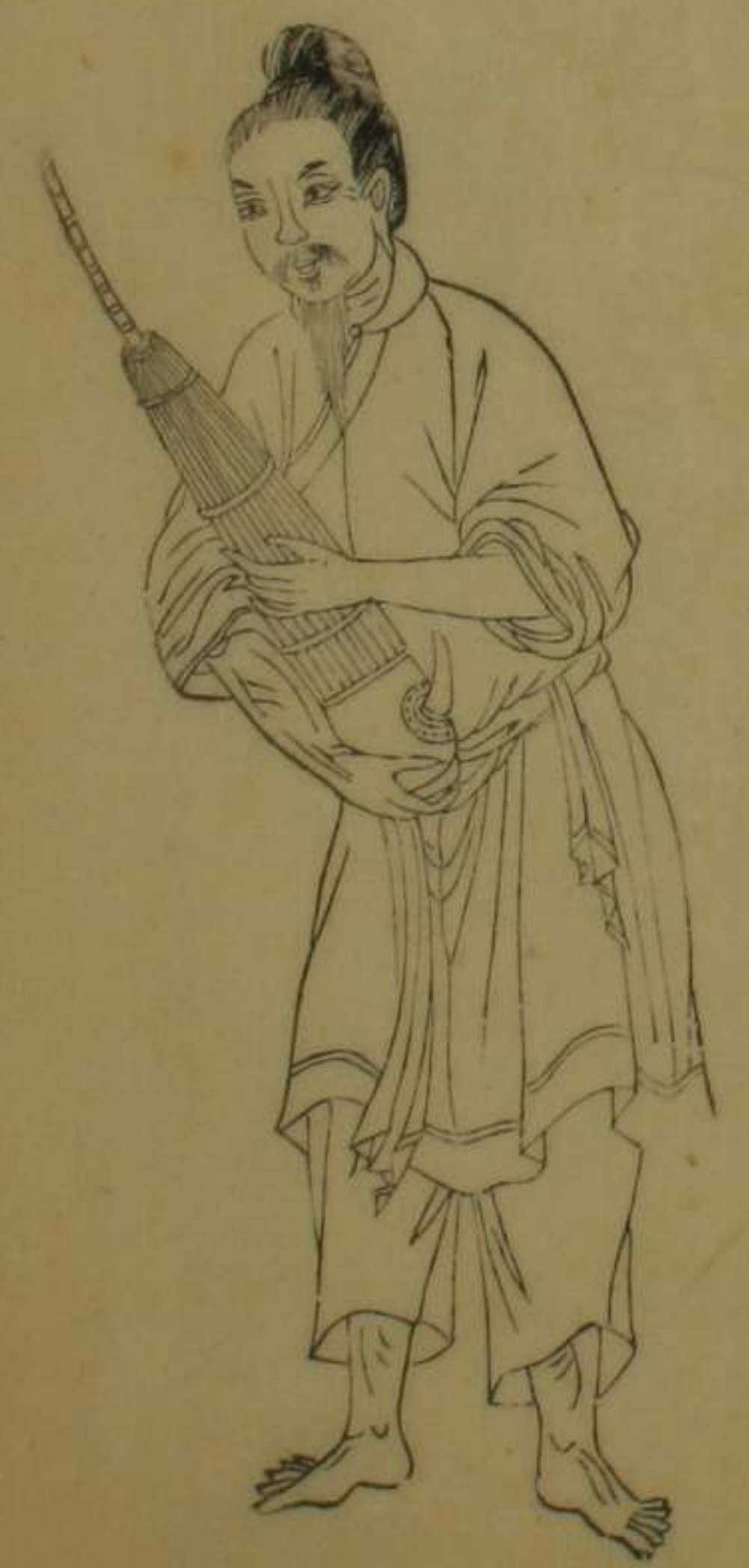
寧遠等處箭桿猺人