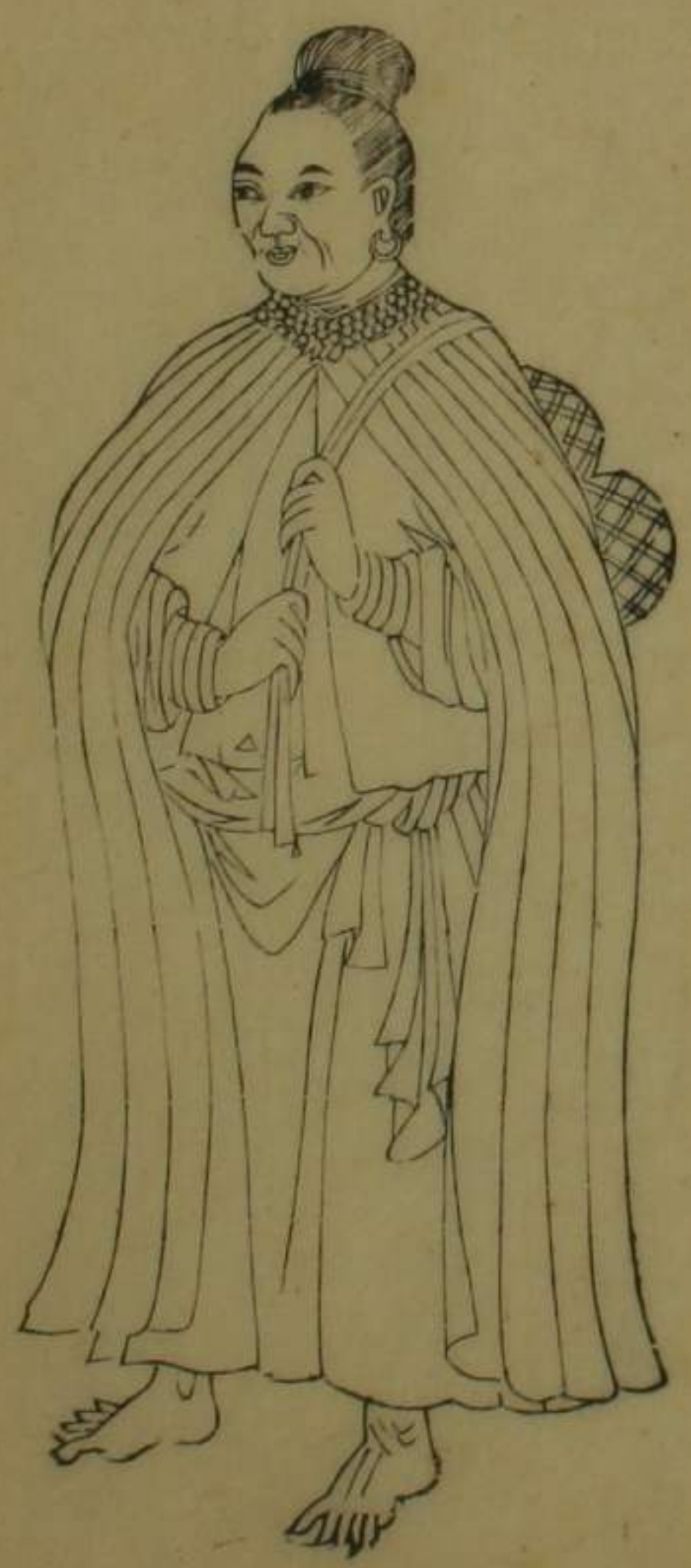
鳳山縣放練等社熟非

米為酒恒攜黃梨以佐食男女相悅即野合 府志稱各社終身依婦以處贅壻即為子孫 歲輸丁賦七十餘兩其新港卓猴二社舊屬 諸羅今改隸臺灣縣治