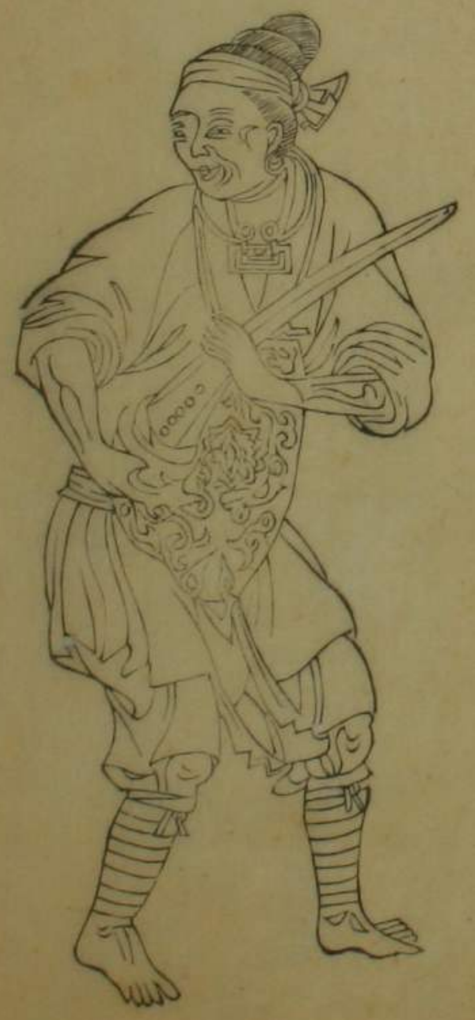
安化寧鄉等處徭人