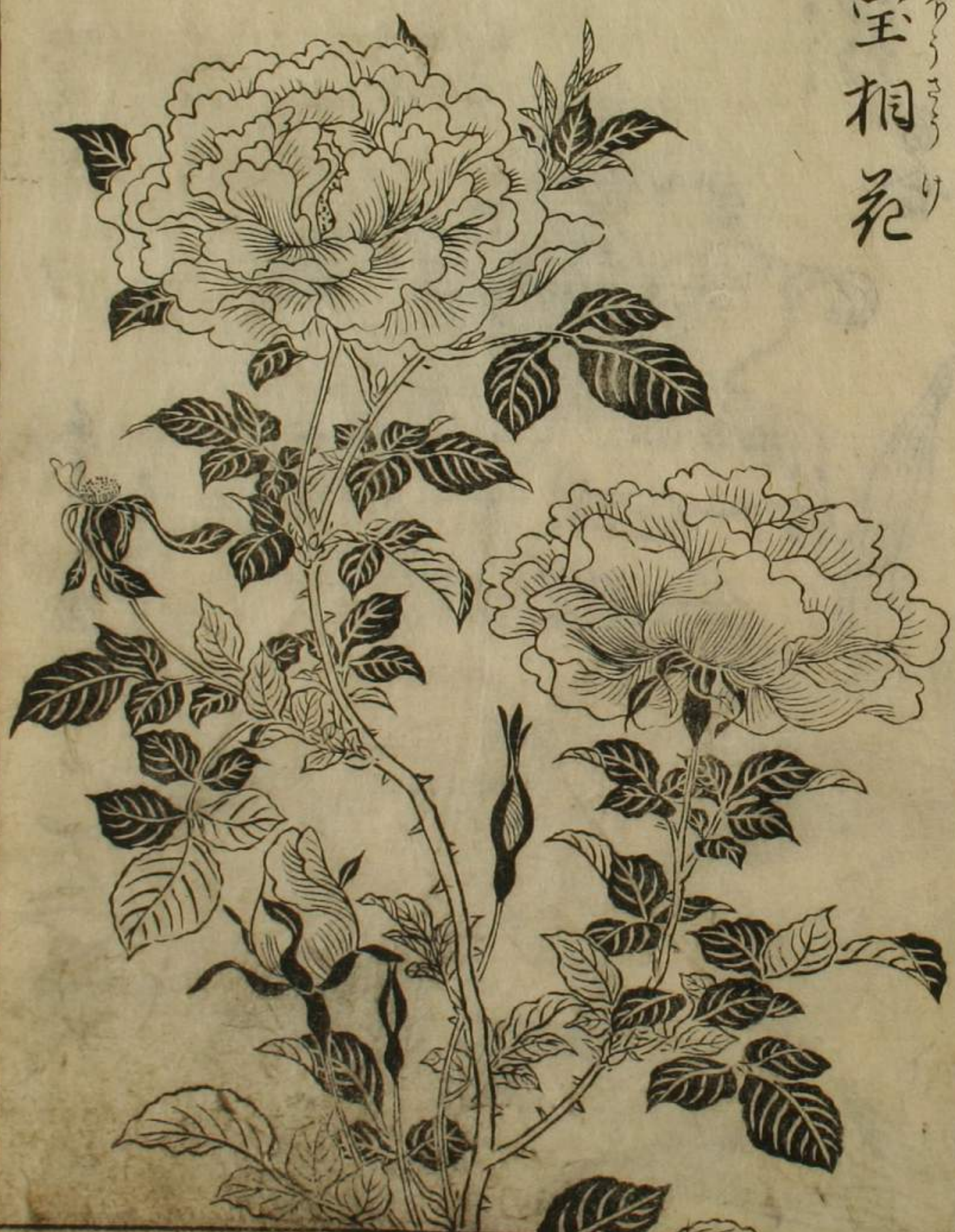
宝相花 ほうさうげ