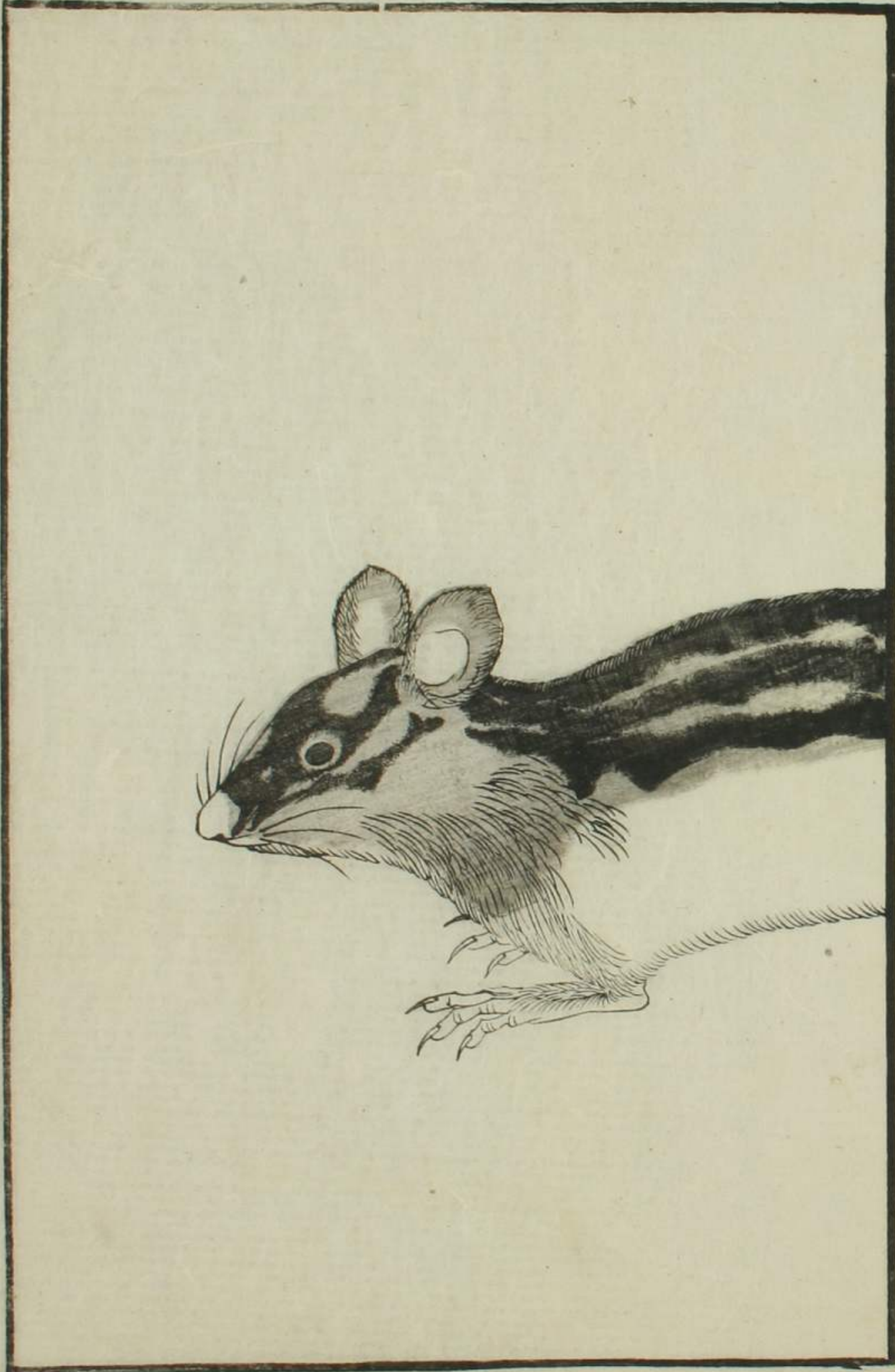
石 しま 席 せき