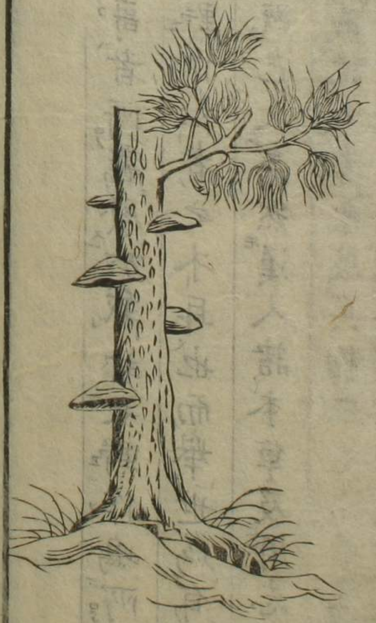
亞加里哥斯附 生魯爾更樹圖

斯者是也余聞之因稽之於彼國之草木疏及窩 葉都之書則圖說俱與彼所言吻合不復容疑焉 於是乎采草木疏之圖譯窩葉都之說而以此欲 令為夫用之者之明據已