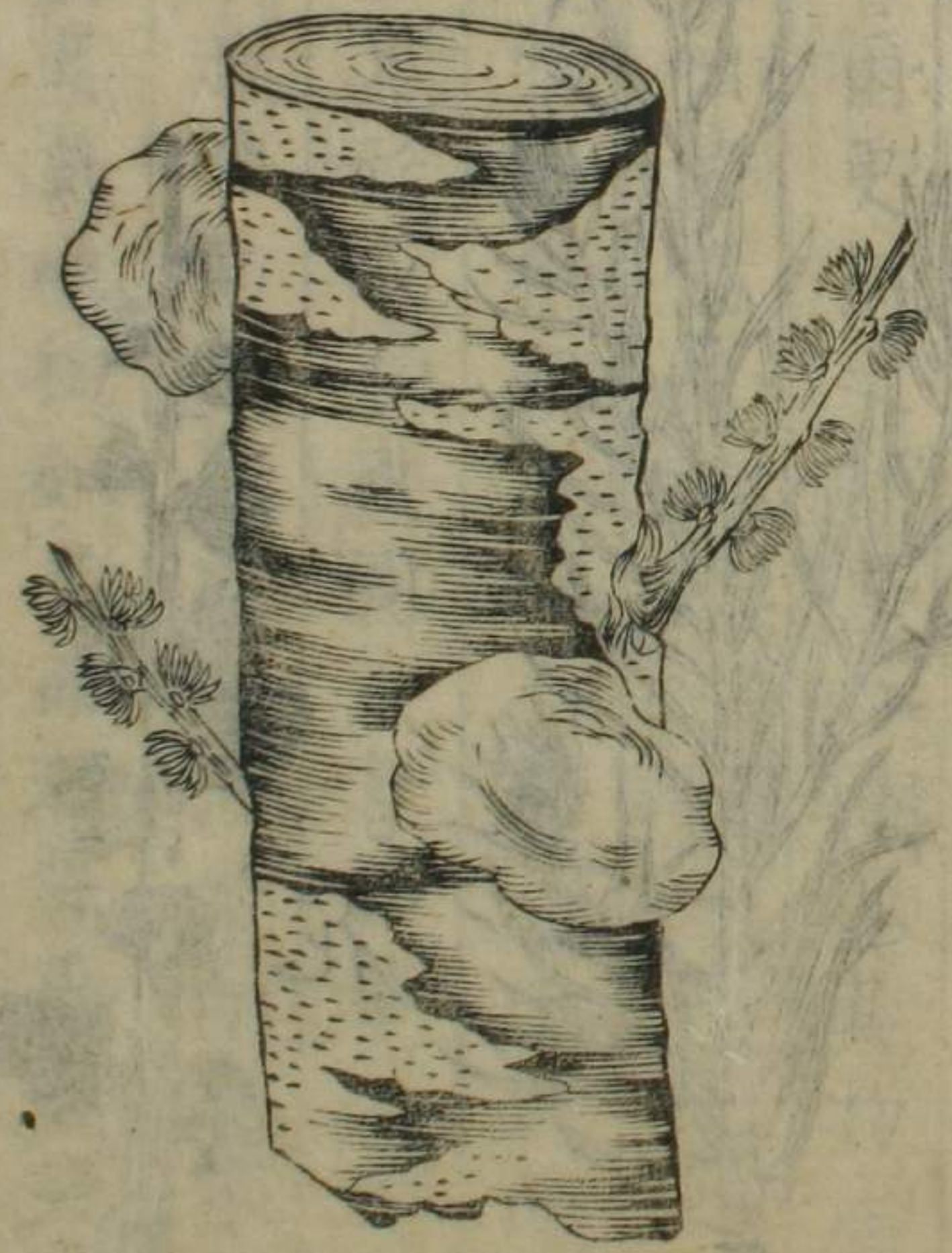
魯爾更樹 切斷之之 圖