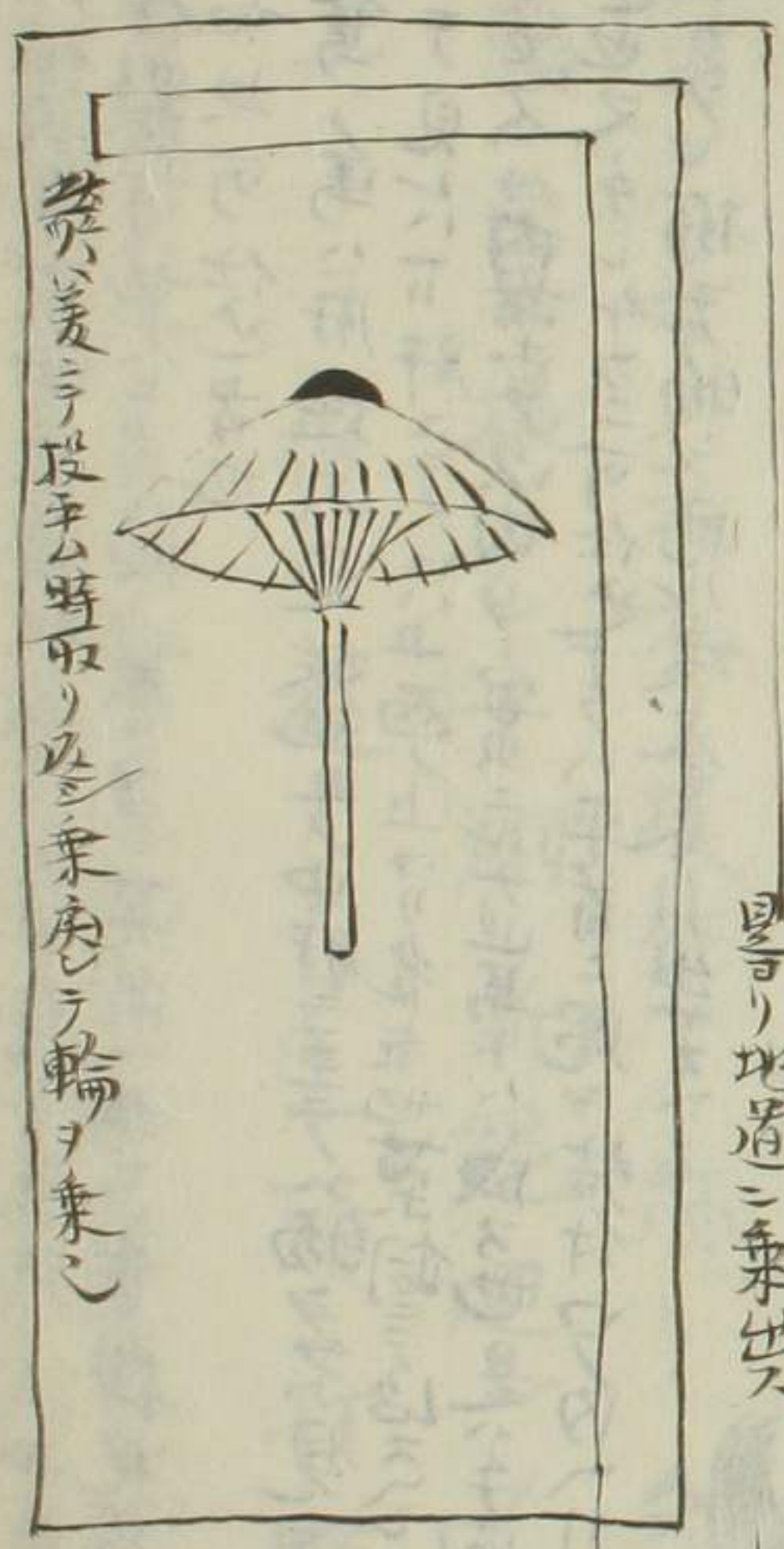
此段ハ差テ投手ノ時取リ及乗座テ輪ヲ乗シ