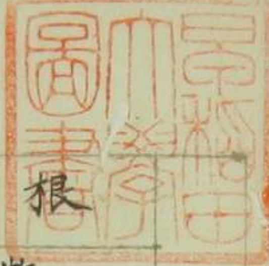
表 覽 一 畜 牧 廳 支 室 根