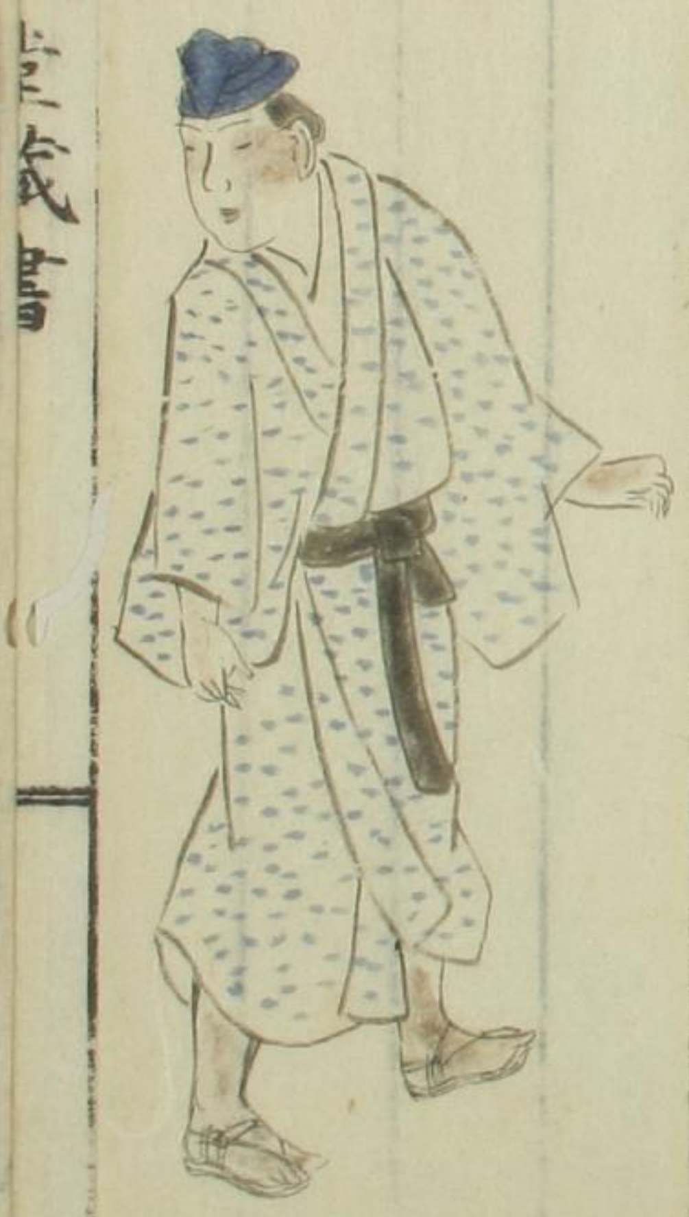
近衛殿輿夫ノ肖 小大

錯雜ナル言ナレド予ガ輩武家大名ノ從卒ハ視馴タルガ京卿紳縉ノ 隨状ハ珍ケレバ目ニ新シキヲ茲ニ描就 カキツ ク