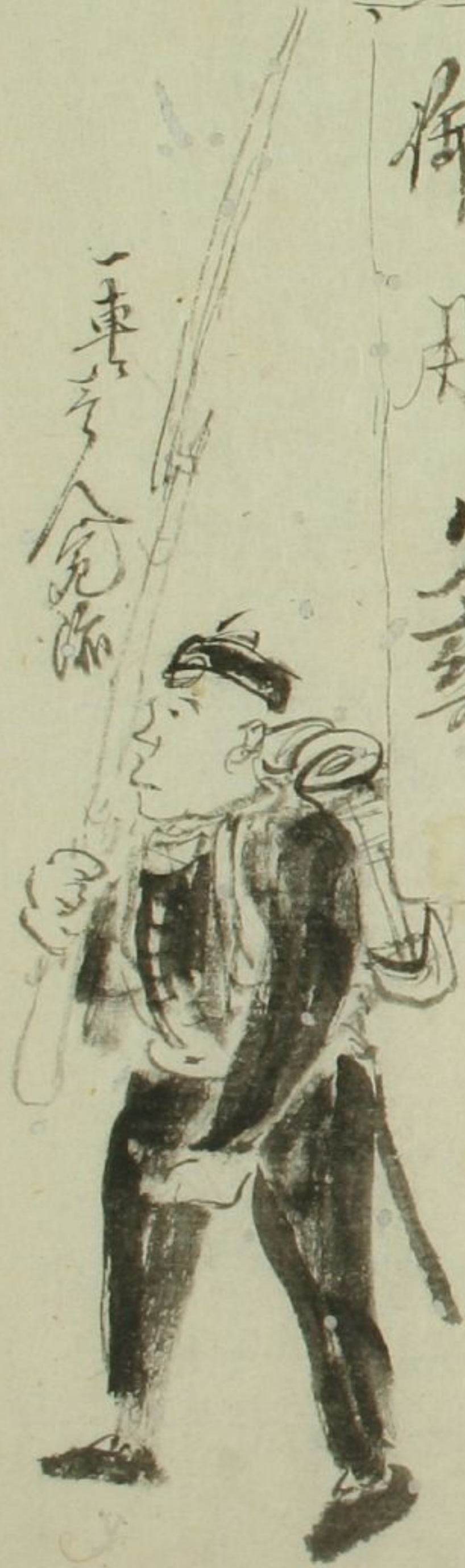
一車 イノヒ ノ イノヒ 會 イノヒ 隊 イノヒ