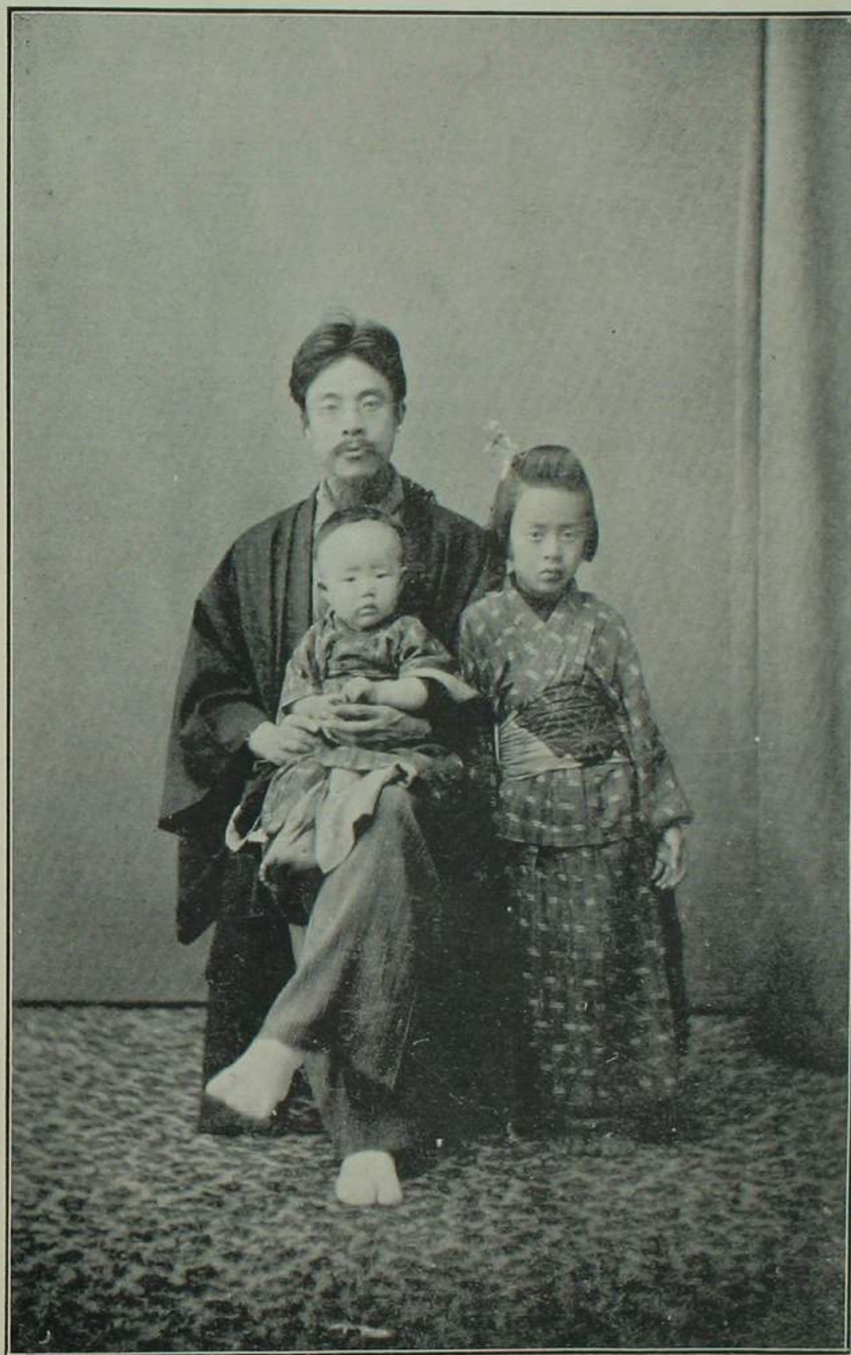
故小野梓先生肖像