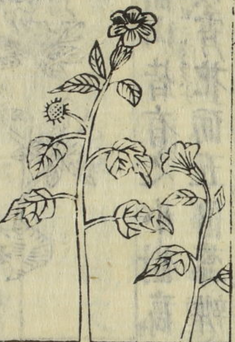
曼陀羅花 風茄兒 山茄子

△按鳳仙花蜂蝶亦不近之說非也特蝶喜吸其花也然為人則可有小毒能解物骨故亦不可不損人齒