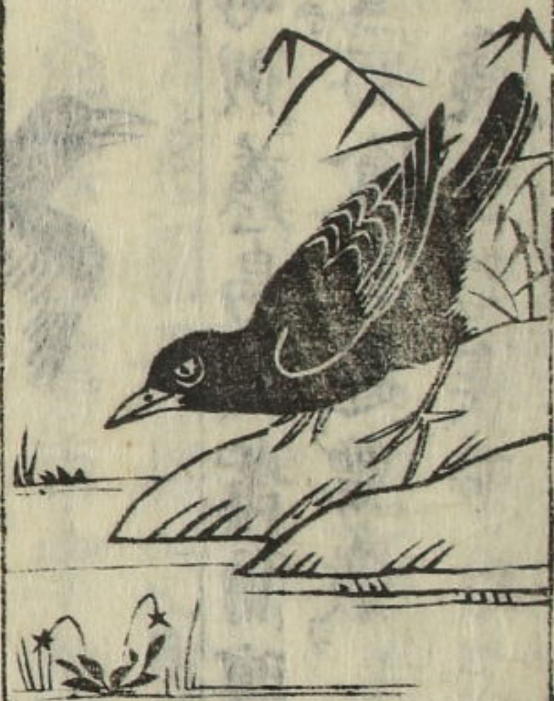
白脰 鬼雀 今云肥丹鳥

本細燕鳥似鴉鳥而大白頭者以為不祥 △按燕者乃國名 非燕雀九州肥前多有之故稱肥前鳥