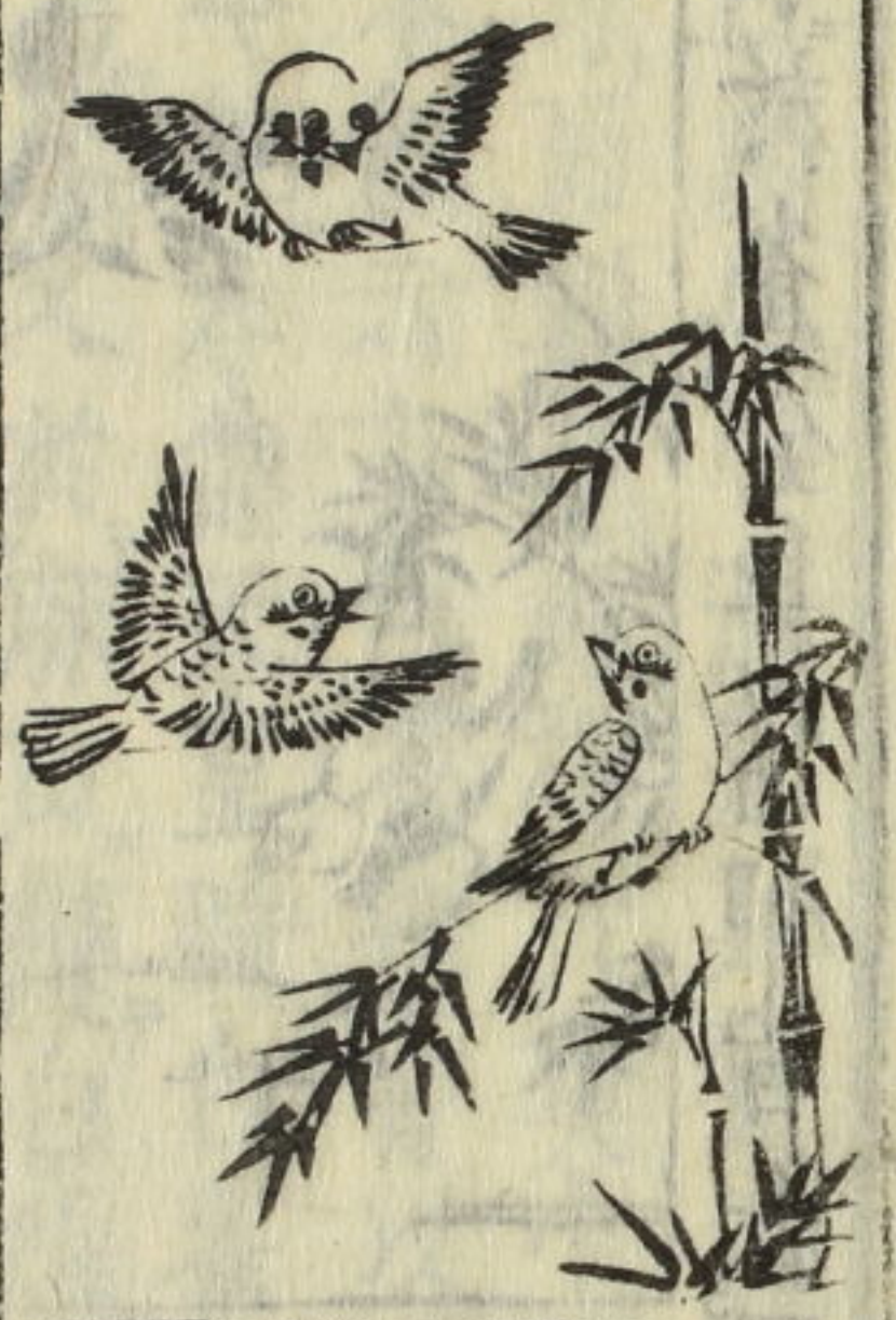
雀 音 瓦雀 嘉寧 赤名須須女

野鴿 堂 與家鴿同類，異種也多，灰色無冠為異，能飛舞，常棲堂在寺樓，故俗呼曰堂鴿。畜鴿之家，亦必畜堂鴿，如鴿去不歸，則使堂鴿若干飛舞，誘歸之也。堂鴿肉味甘，有泥氣，人不食之。