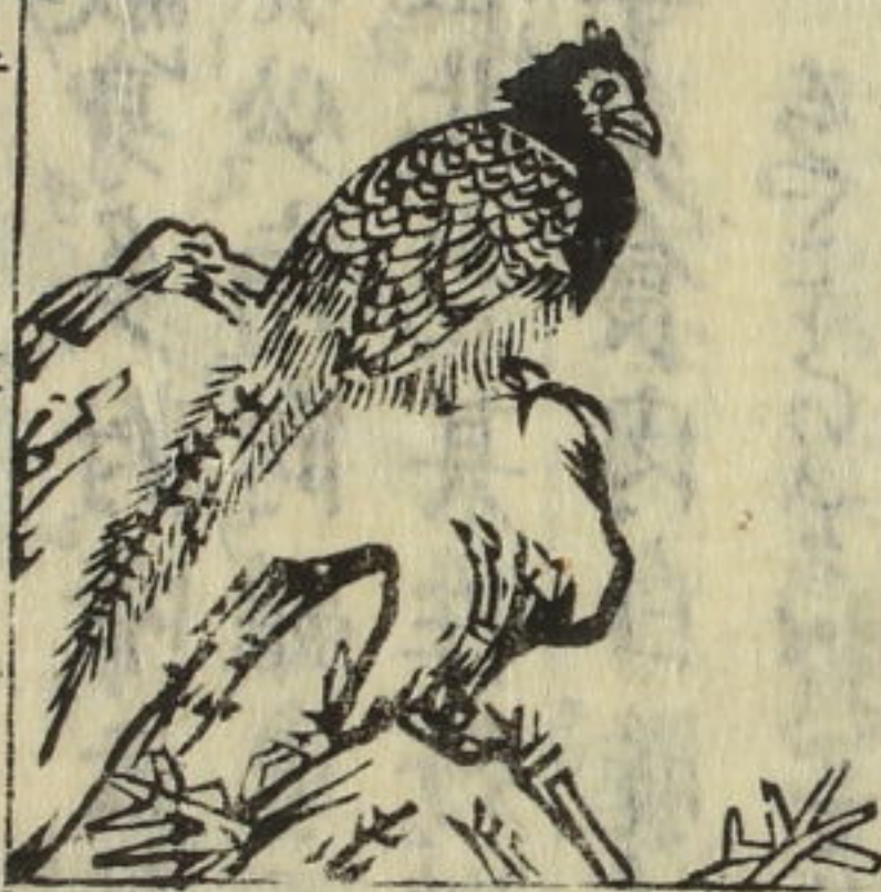
鷓鴣 音 易

本綱吐綬雞人多畜玩大如家雞小者如鷓鴣頭類似雉 羽色多黑雜以黃白圓點如真珠斑項有嚙囊內藏肉綬 常時不見每春夏晴明則向日擺之項上先出兩翠角二 寸許乃徐舒其頷下之綬長濶近尺紅碧相間米色煥爛 踰時悉斂不見或剖而視之一無所觀此鳥生亦反哺行 則避草木故有避株及秀鳥之名