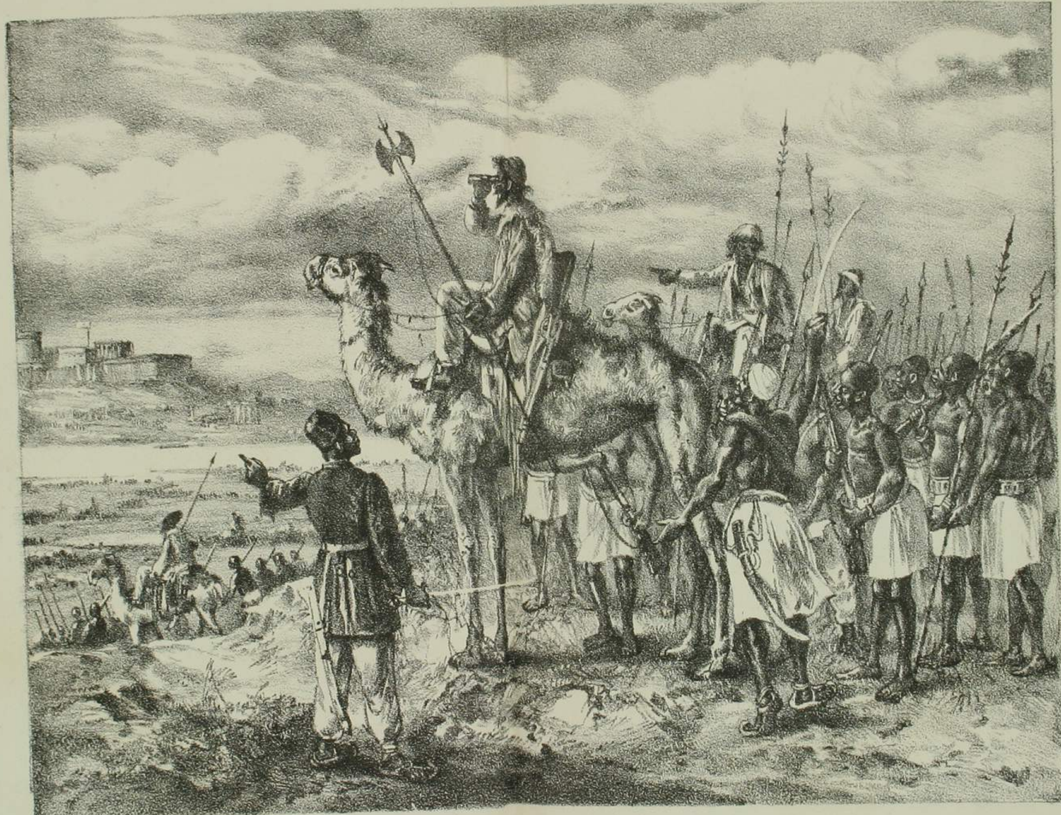
印度洋海峽小野下和東亞