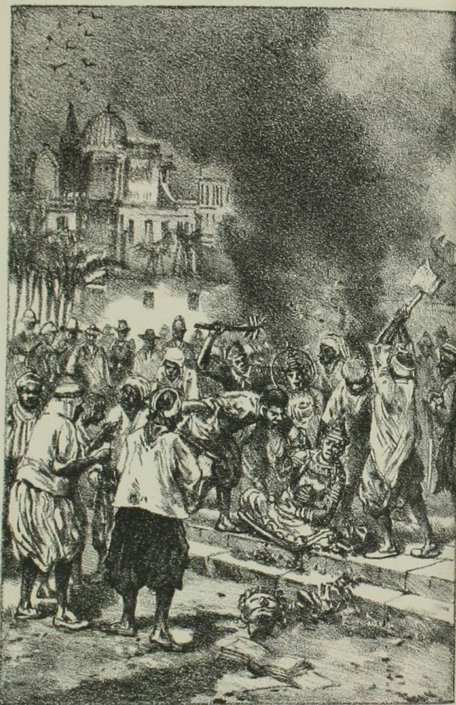
神田區東松下町十六番地小柴英待印行