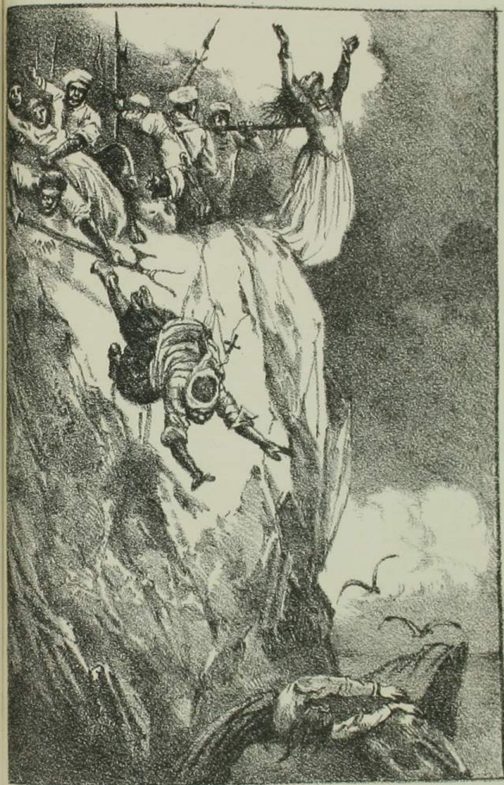
馬島兩教者迷信圖