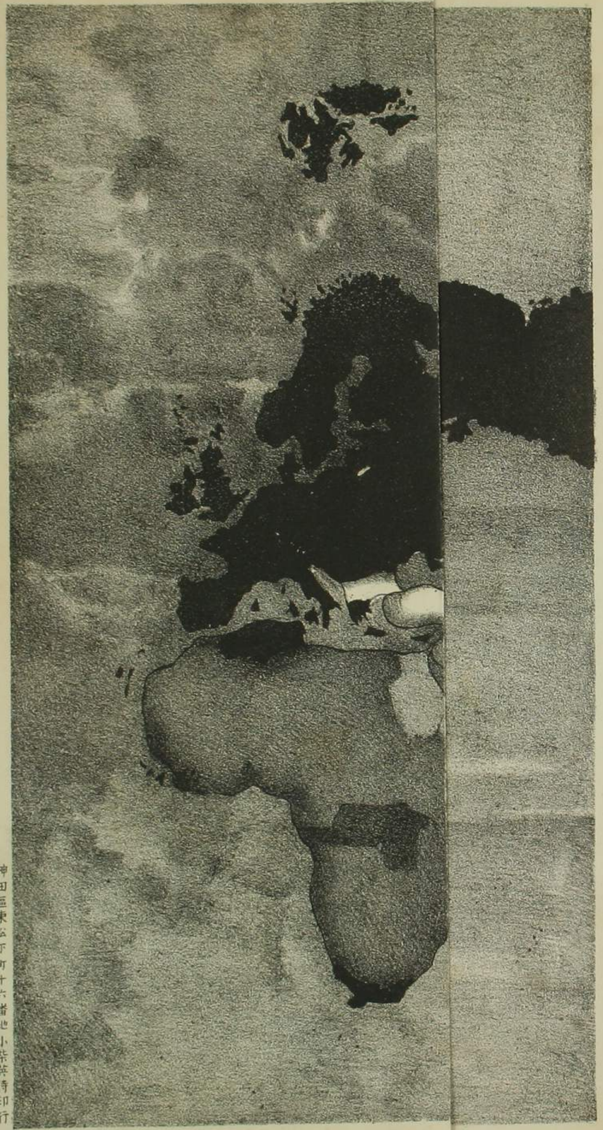
神田區東松下町十六番地小柴英傳印行

生ヲ累スモハナク又我が肘ヲ掣スルモノナシ 眞ニ不羈獨立一言一行唯我が欲スル所ハマハ ハミ其身ヲ國家社會ニ盡サントスルニ於テ或 ハ世俗ニ優ルコト遠カラント 當時徐ニ東西ノ形勢ヲ觀察スルニ歐ハ諸強國 平和對峙ハ利ヲ知り競争侵略ハ非ヲ覺リ列國 互ニ平和權衡ヲ維持スルニ汲汲トシ唯其餘威 ヲ將テ之ヲ東南遠洋ニ洩シ蠶食吞噬ハ恣ヲ恣 ニセント欲シ日清二國ハ未ダ大ニ振ハザルニ 乘ジ藩圖ヲ擴有セント欲スルハ狀アリ即英國 近交遠攻在彼則得 其策於我則果何如 哉 敵士方寸有經綸大 策故揣摩字內之大 勢不必喋喋多言簡 潔乃能如此