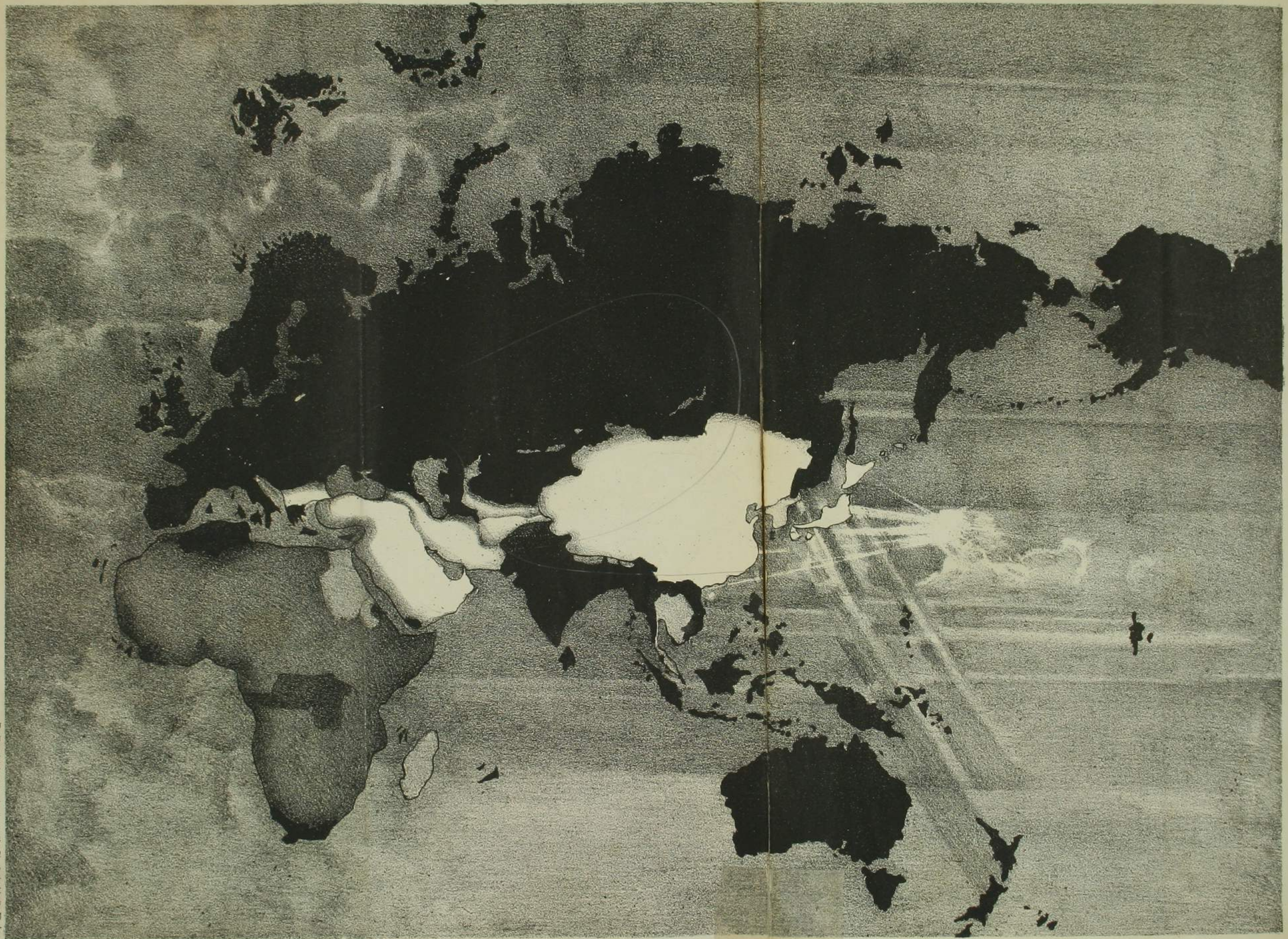
神田區東松下町十六番地小茶英傳印行