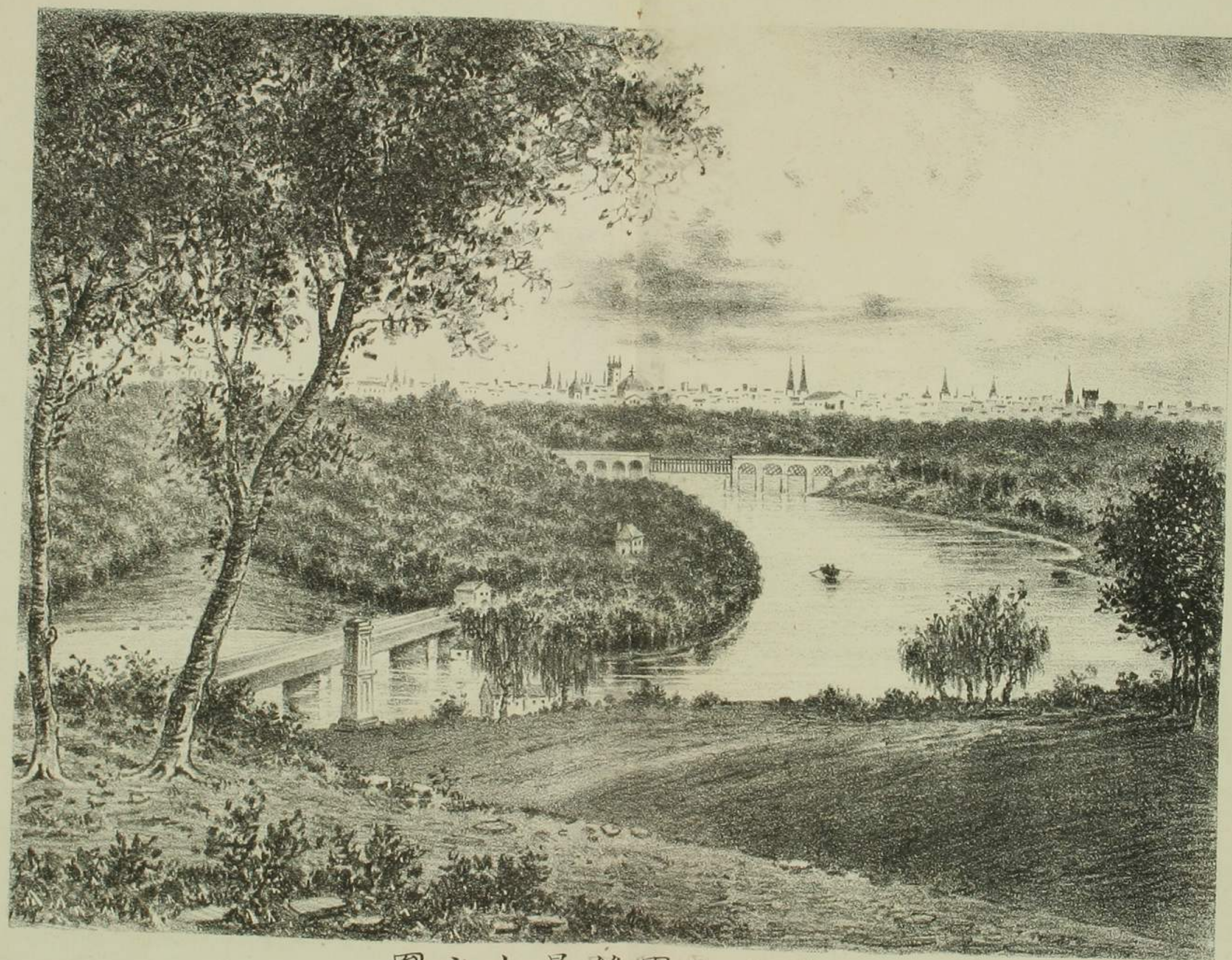
費府公園絕景山之圖