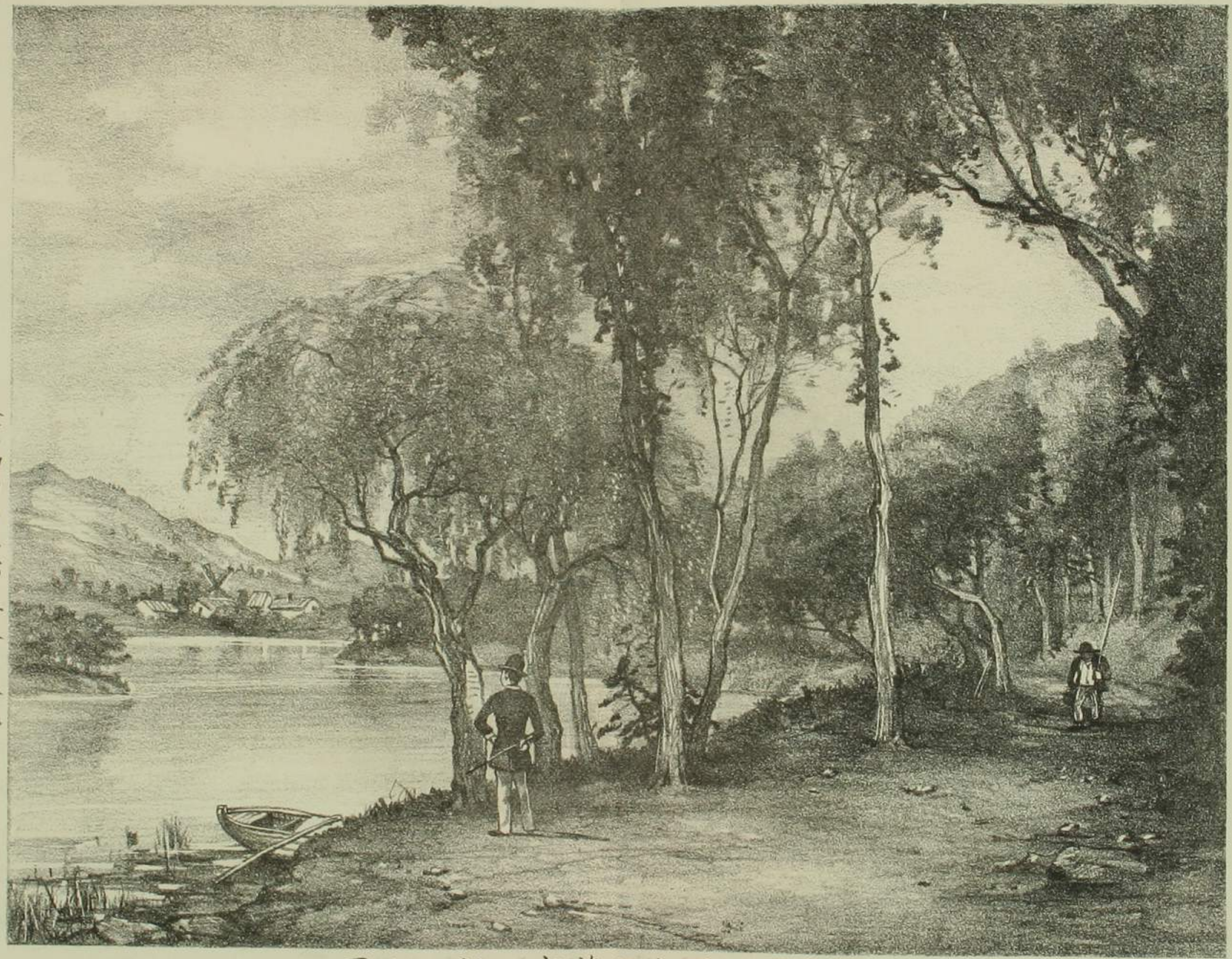
散士再と水之舊家ヲ訪フ之圖