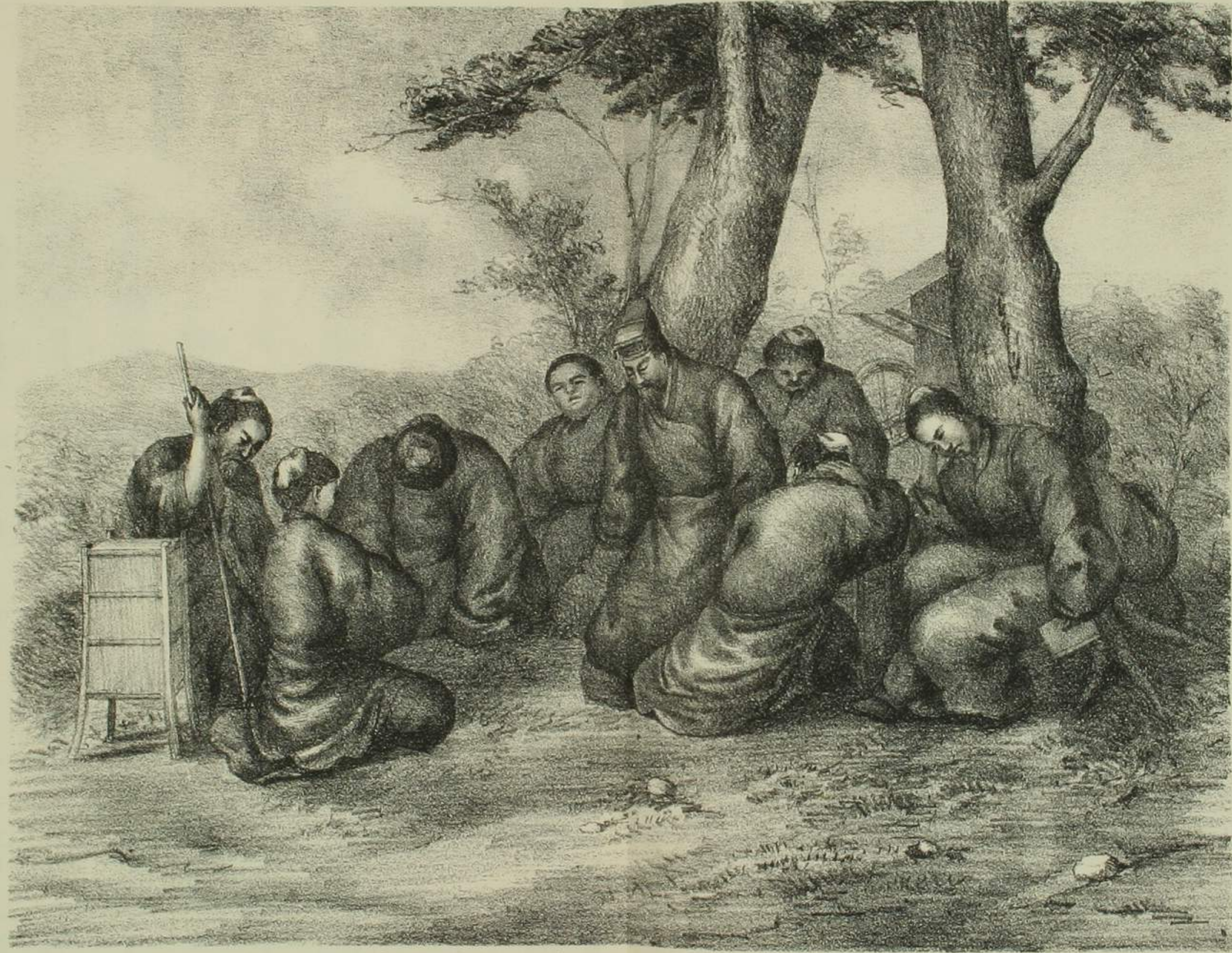
孔子陳蔡，野饑之，面