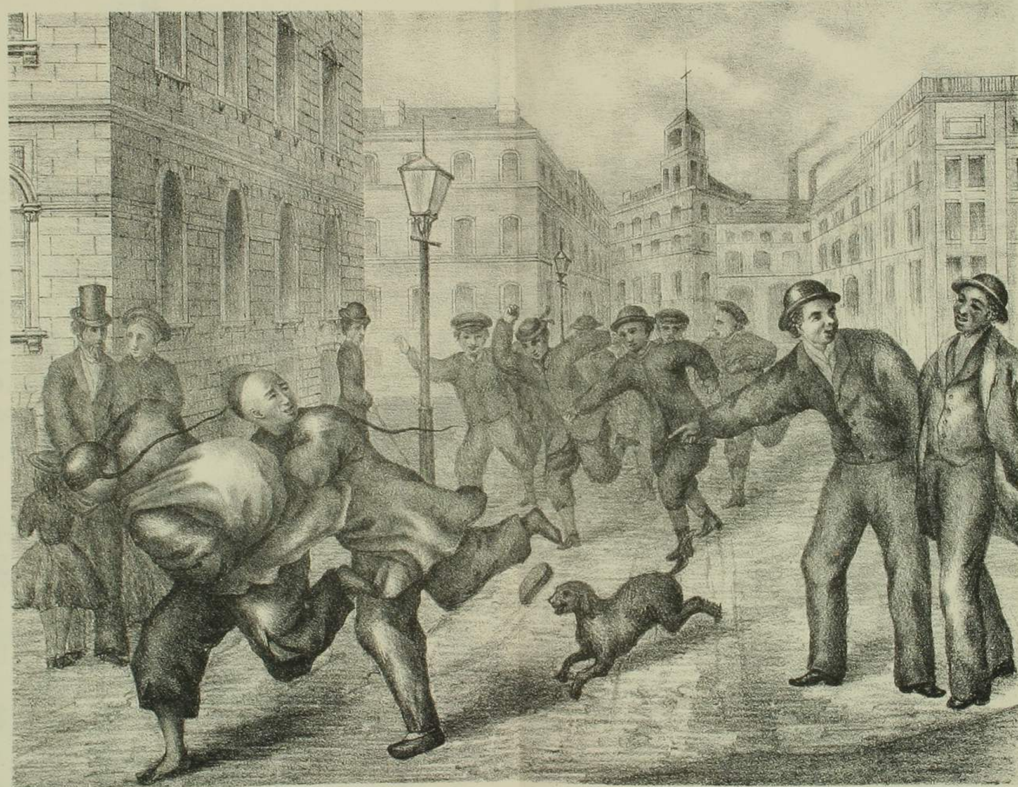
清人米人輕侮之圖