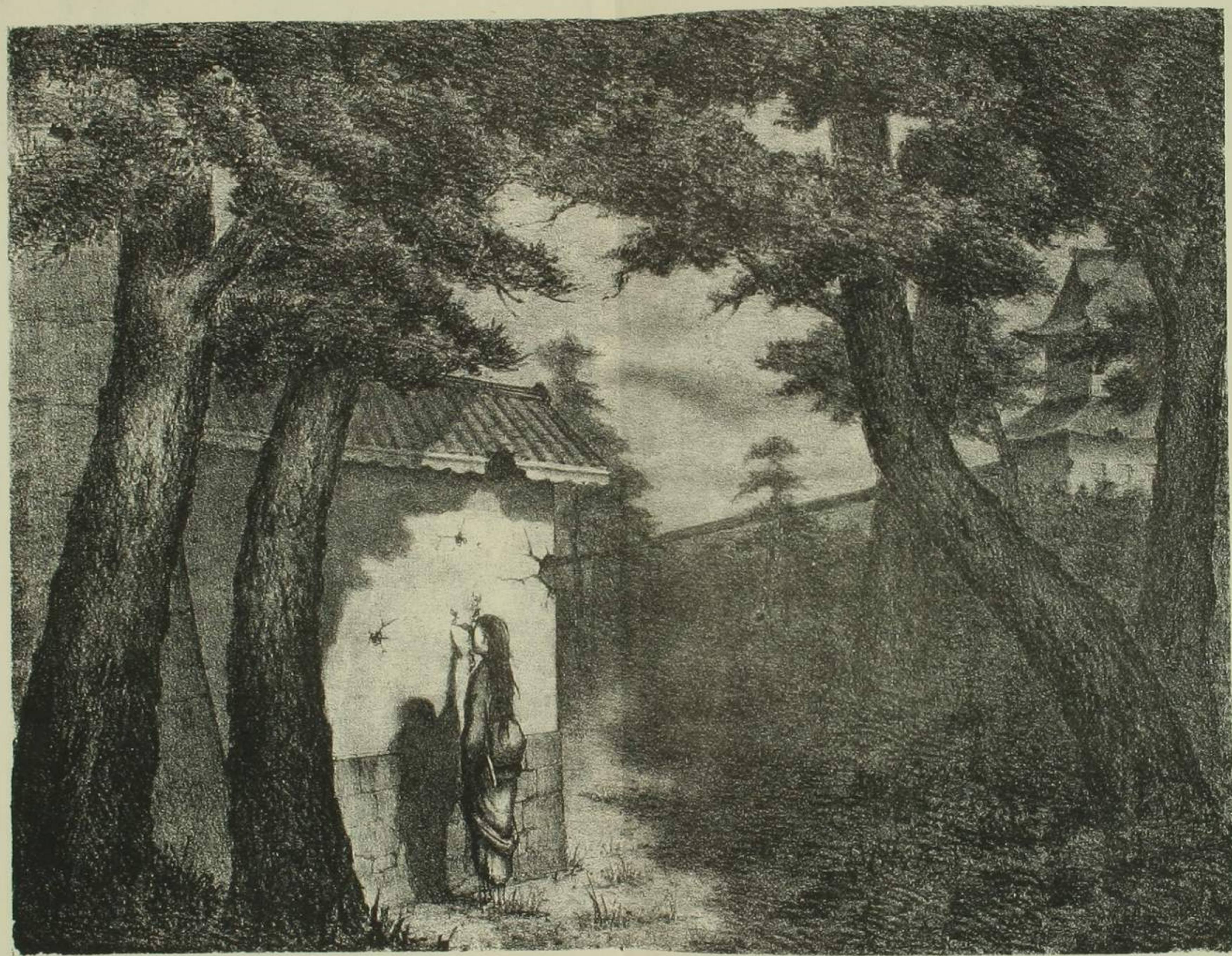
會津城中烈婦和歌遺蹟