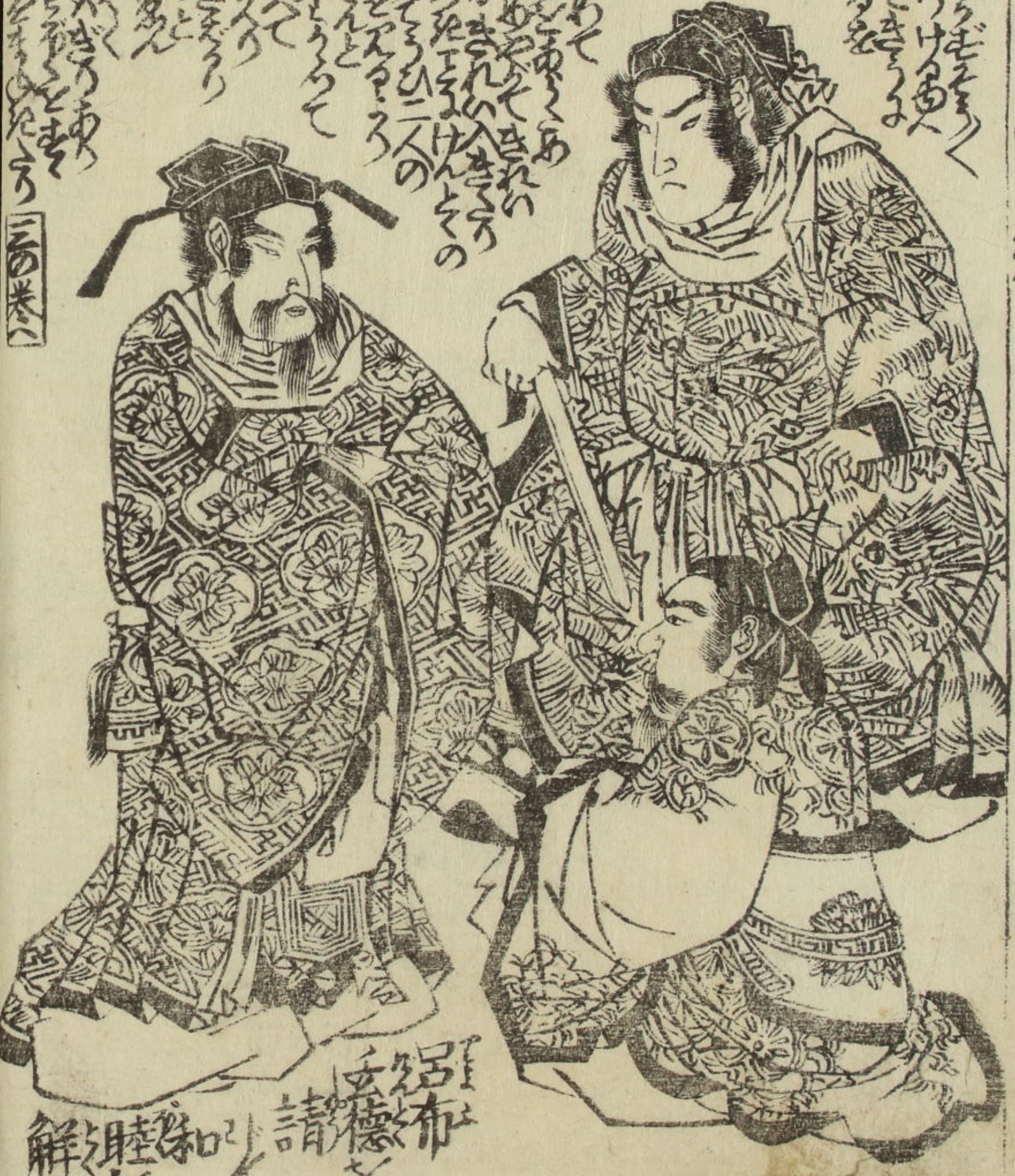
紀伊の... 城の中... 和睦... 拱む