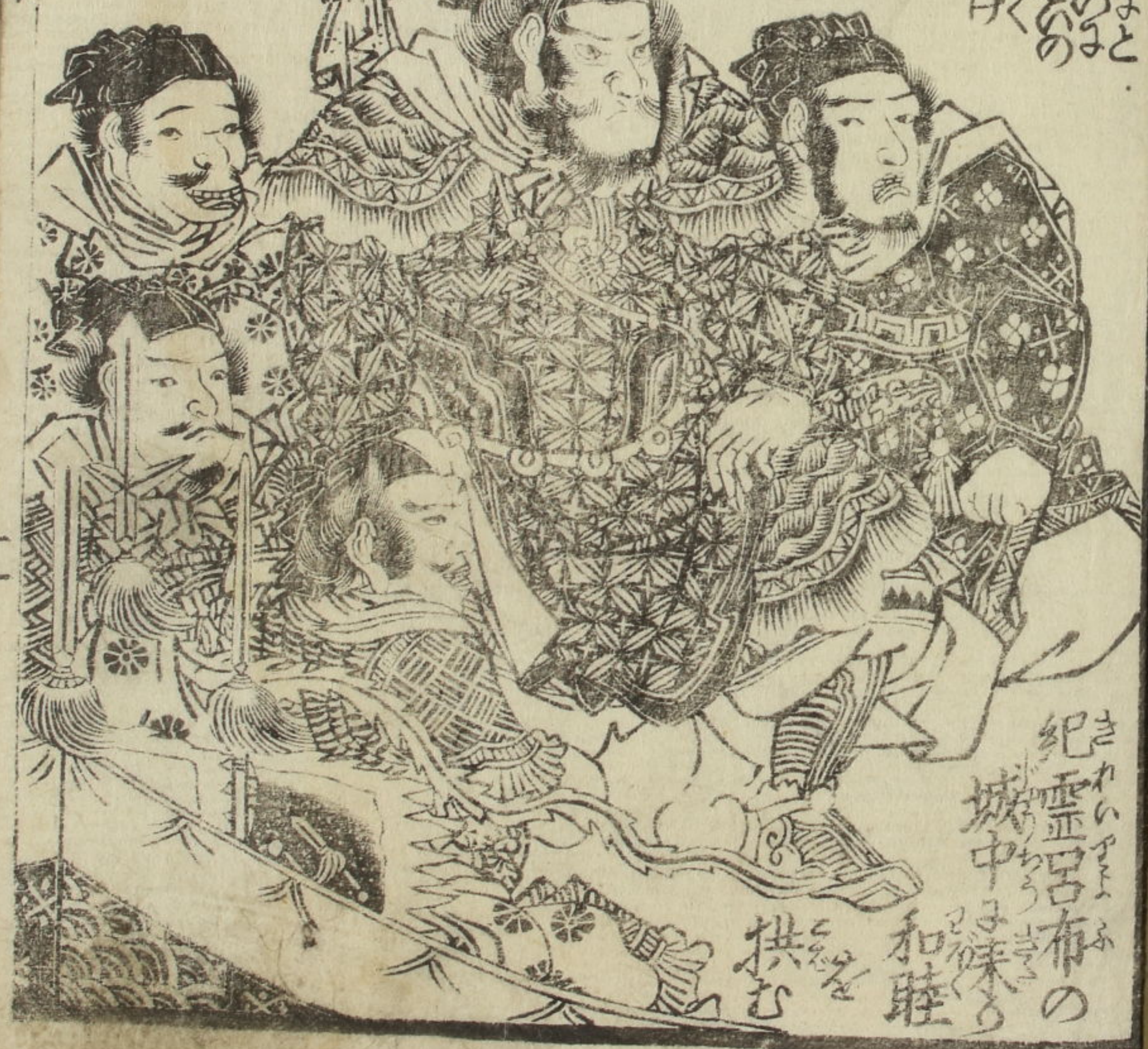
紀伊の... 城の中... 和睦... 拱む