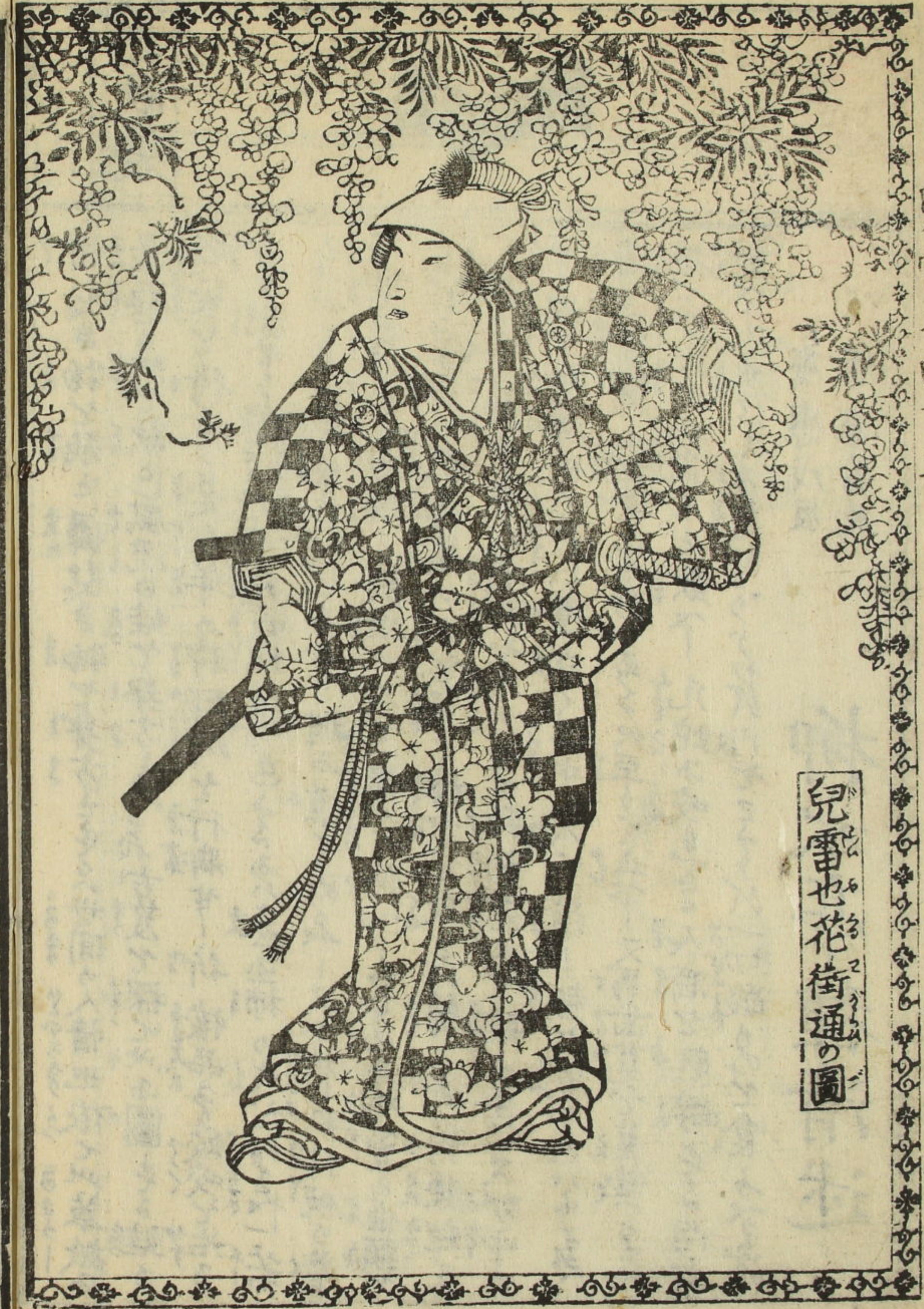
兒雷也花街通の圖