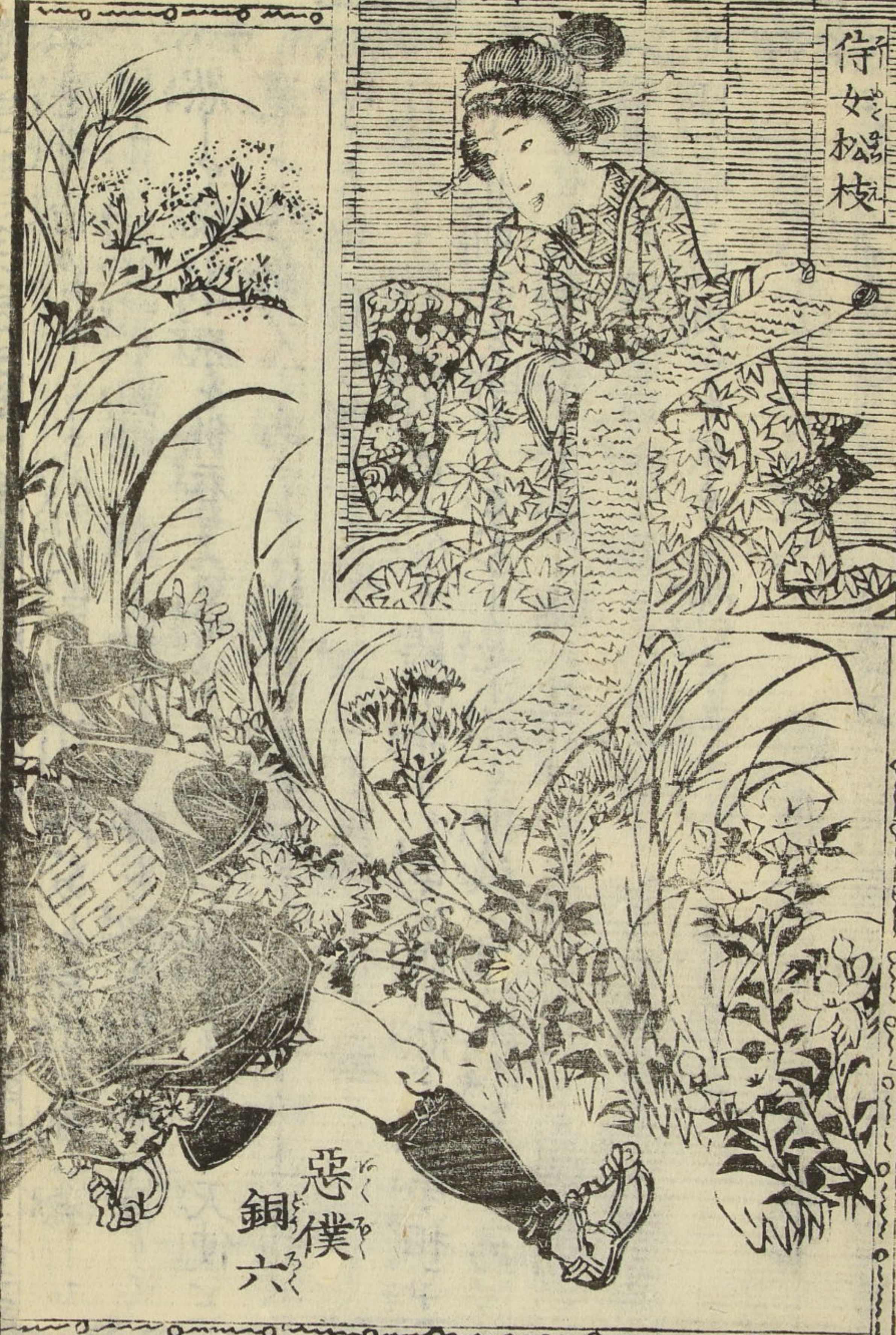
侍 女 松 枝