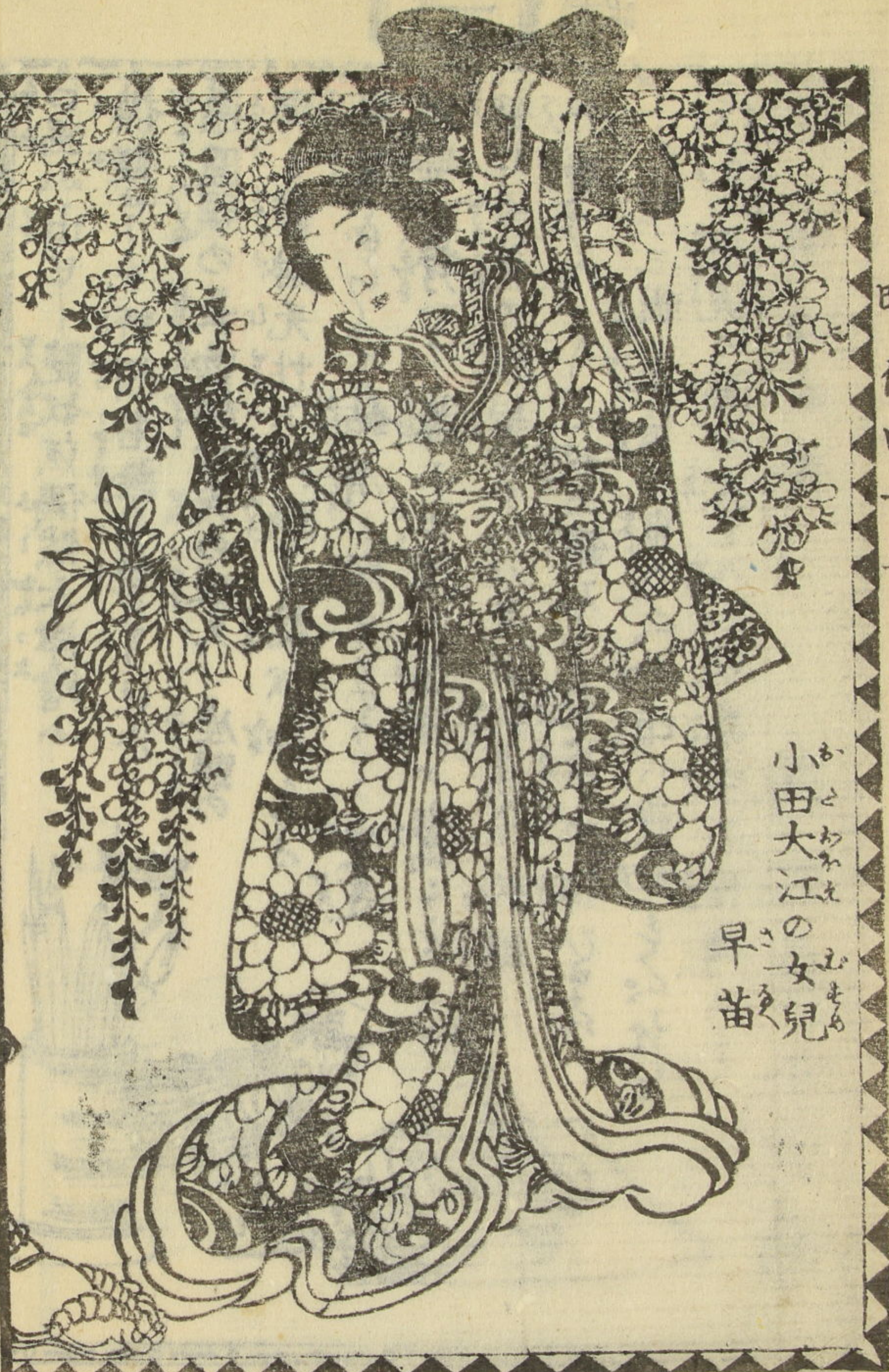
小田大江の女 の 早苗 の 兒 の