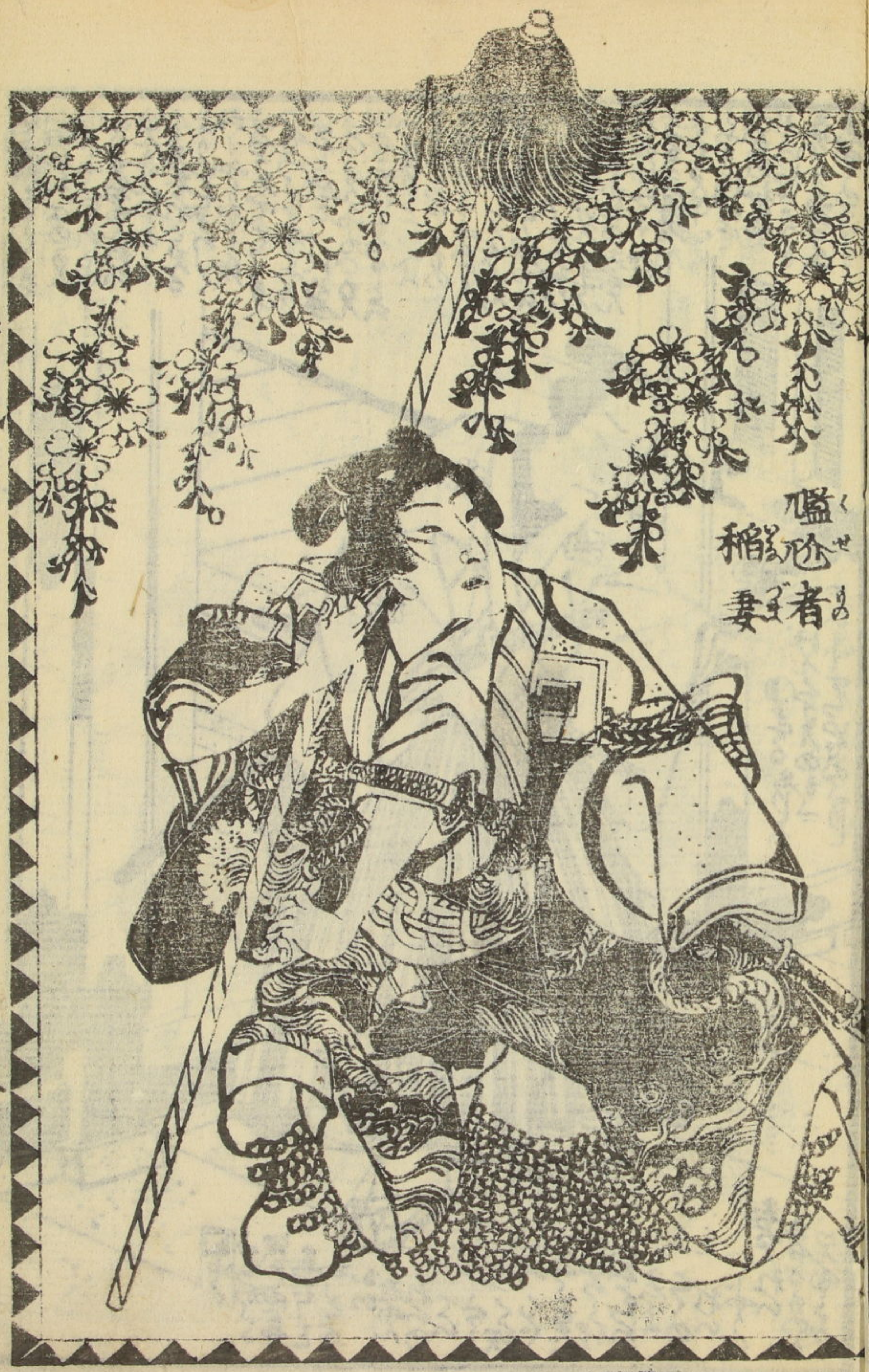
盛 く 稻 こ 者 の 妻 の