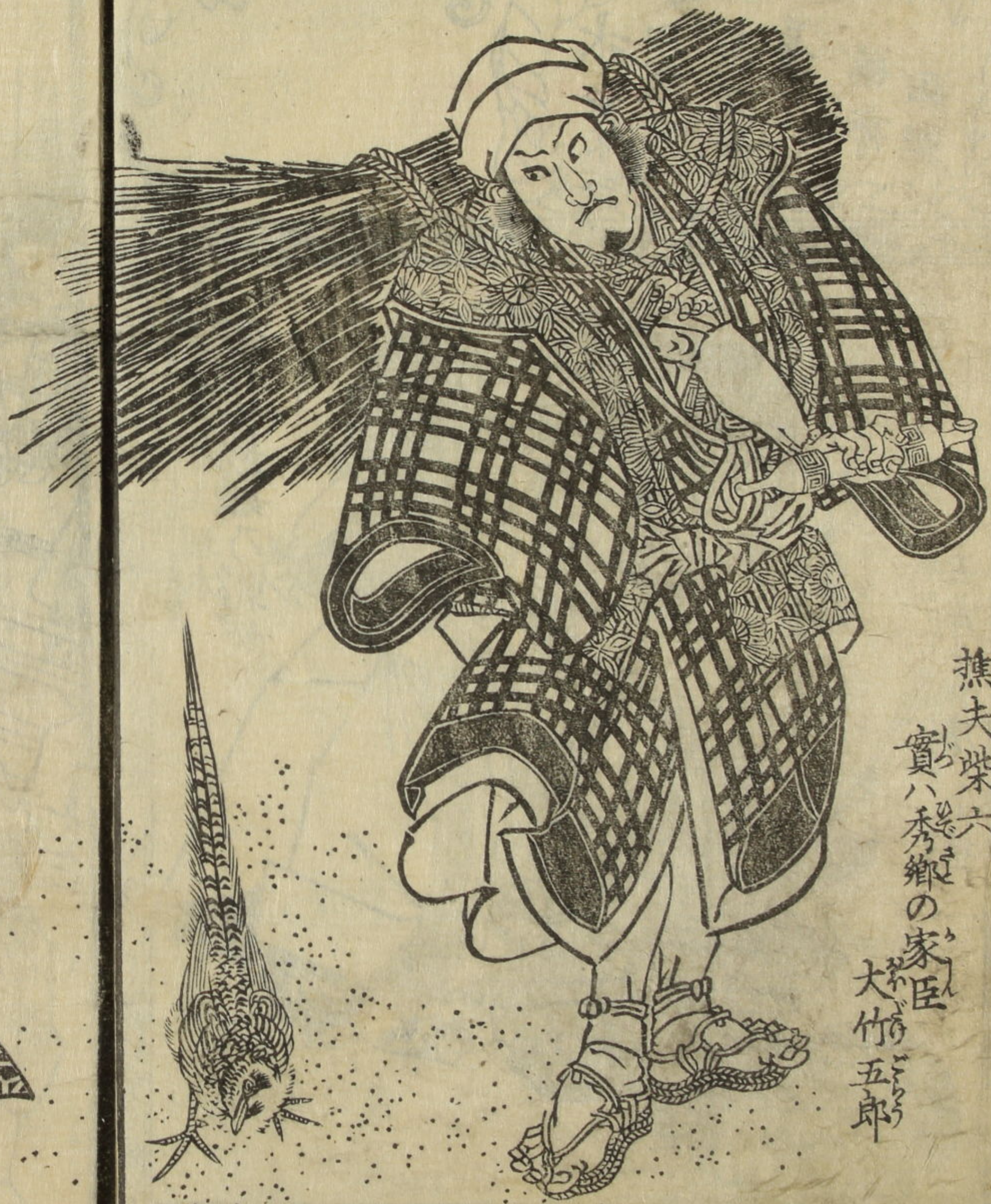
樵夫柴六 實ハ秀郷の家臣 大竹五郎