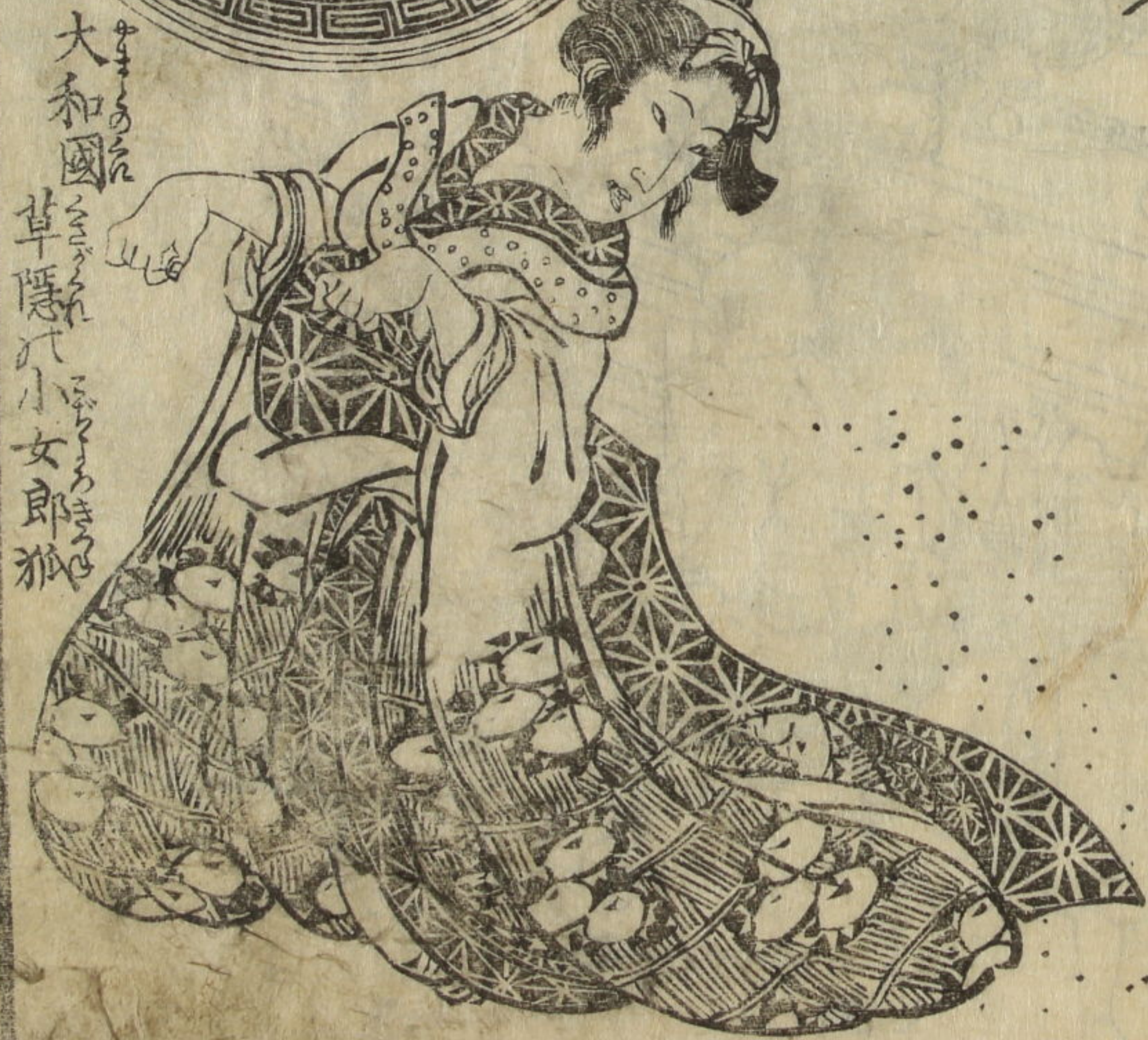
大和國 草隱小女郎