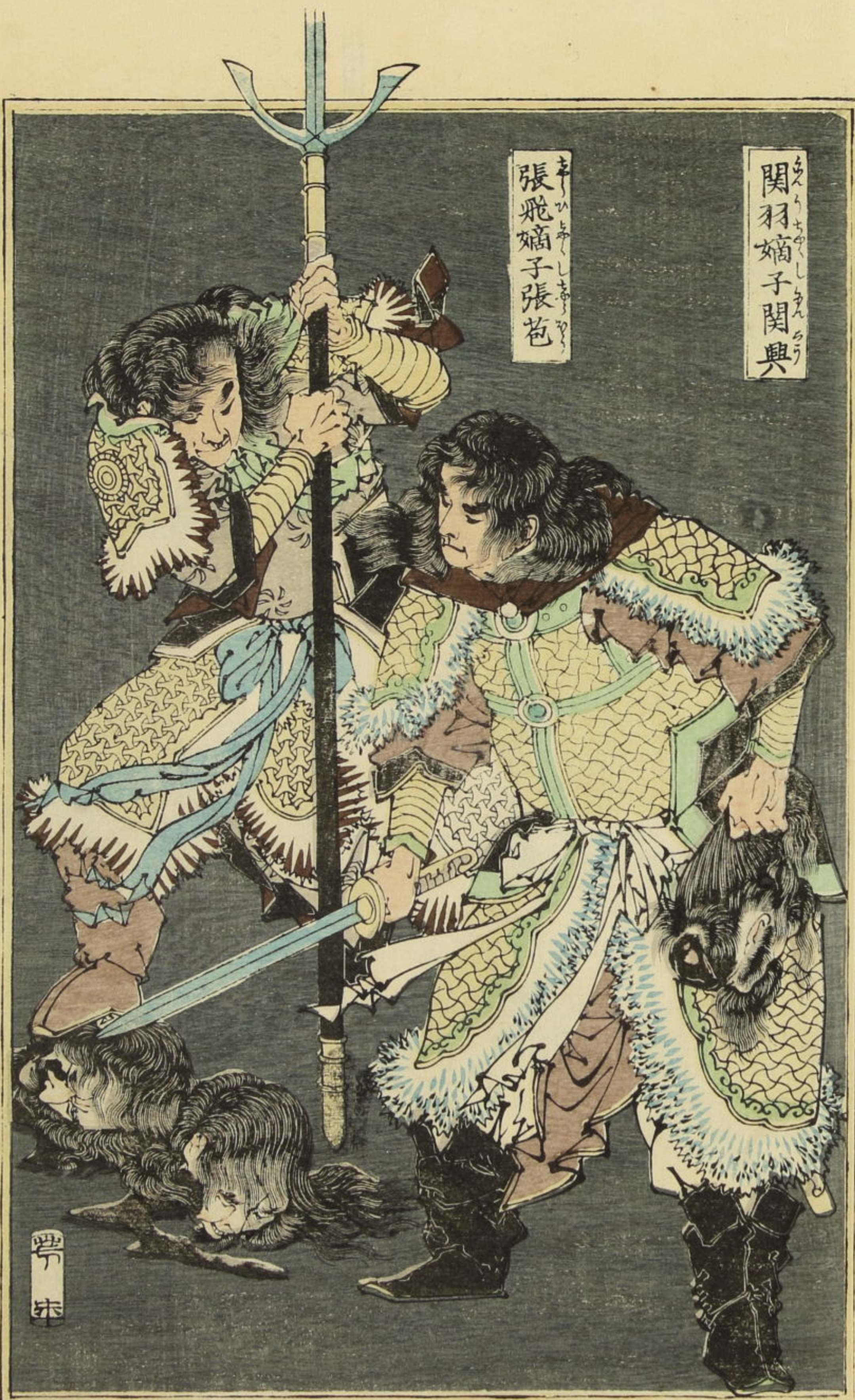
張飛 字 孟 節