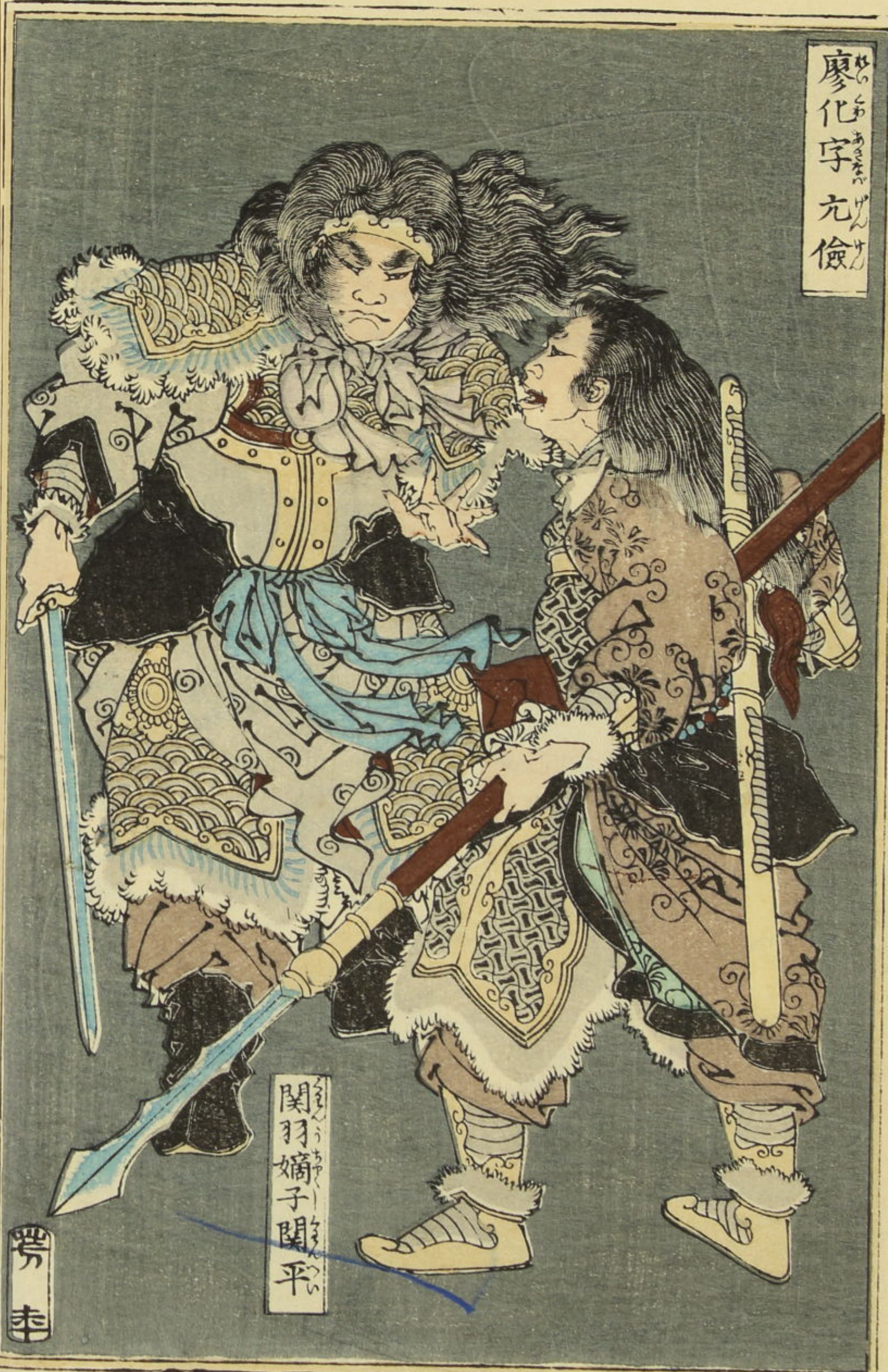
廖化 字 元 儉