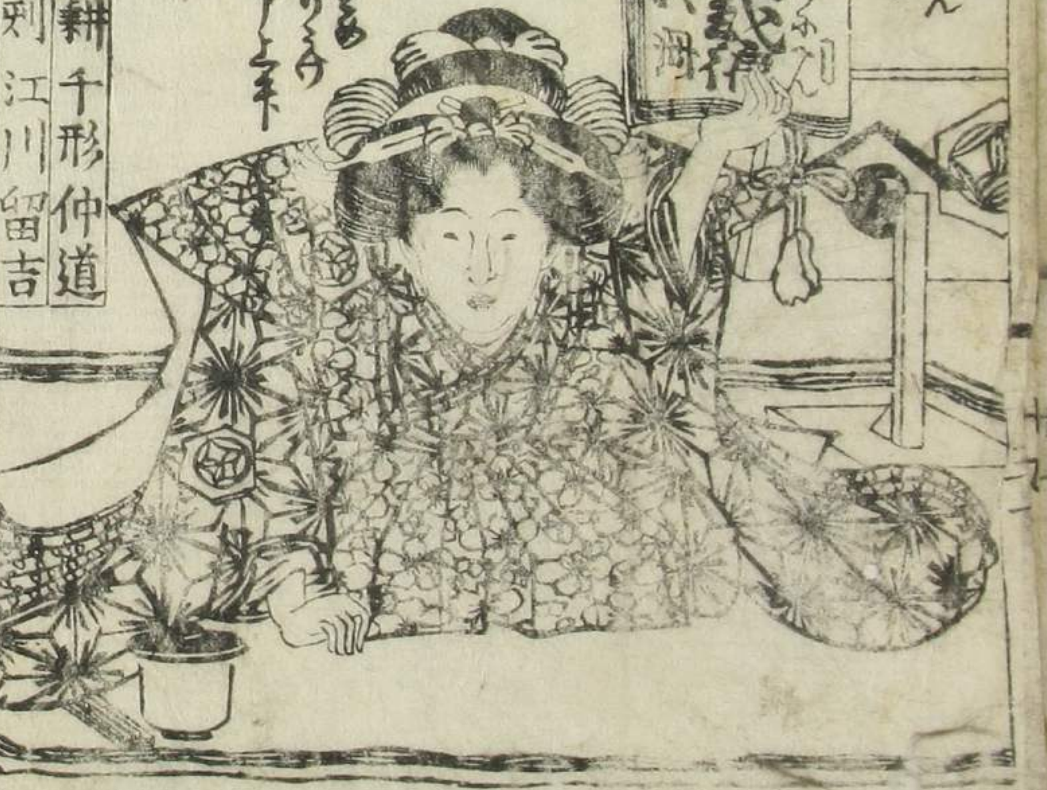
華耕千形仲道 彫刻 江川留吉

口上 是ては冊子にてそのめくも 〇作者の少くも 百鬼夜行の 巻めきす まじりあ のあつり まじりあ 〇口上 是ては冊子にてそのめくも 〇作者の少くも 百鬼夜行の 巻めきす まじりあ のあつり まじりあ