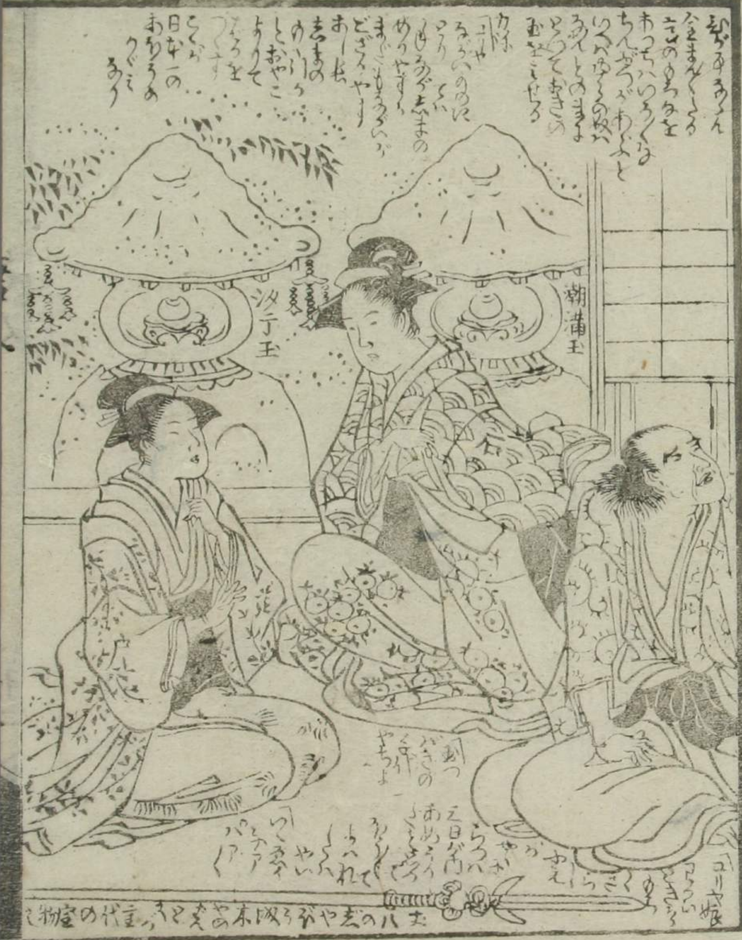
物室の代官、スと交ふ本取ろがや去のハカ