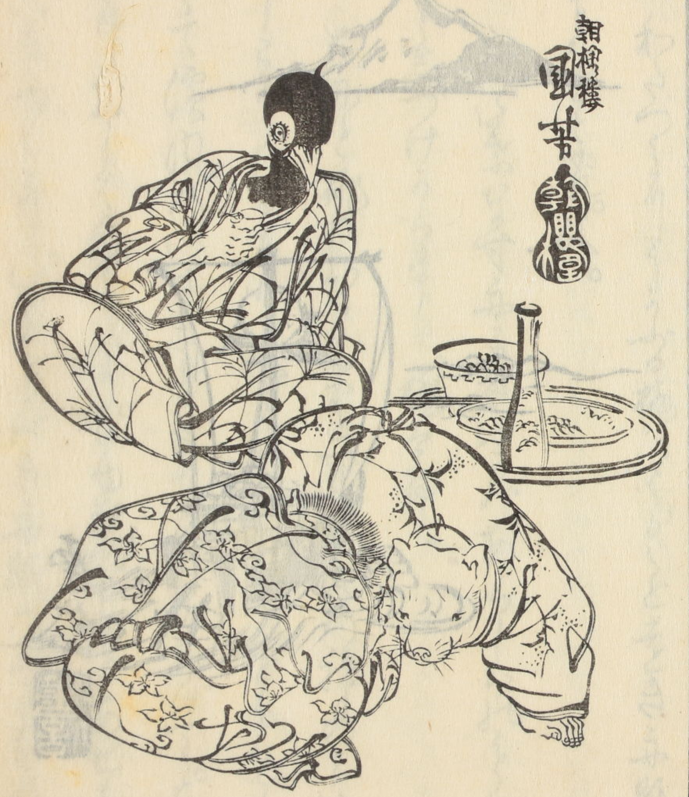
朝樹樓 國華 雙福

心を具しつ。深き河にいでて。其砂をむしり ありやとおして。さけのこがねを乃不むしりふ。 ちり刀自梳乃びる糸をすもる。海河うけさ。 すゝたえの大蛇をいかりまらすや。あま今あ しありいさう。ちのぶあけき鬼をふる ぼ。實をさう。いんさあ。またしうたらば。 是糸うねんいさくねん。あまいあまいむしり あて、をぶらさし。いさあまらいさあまらあけ 乃そやふ糸とありぬ。刀自。