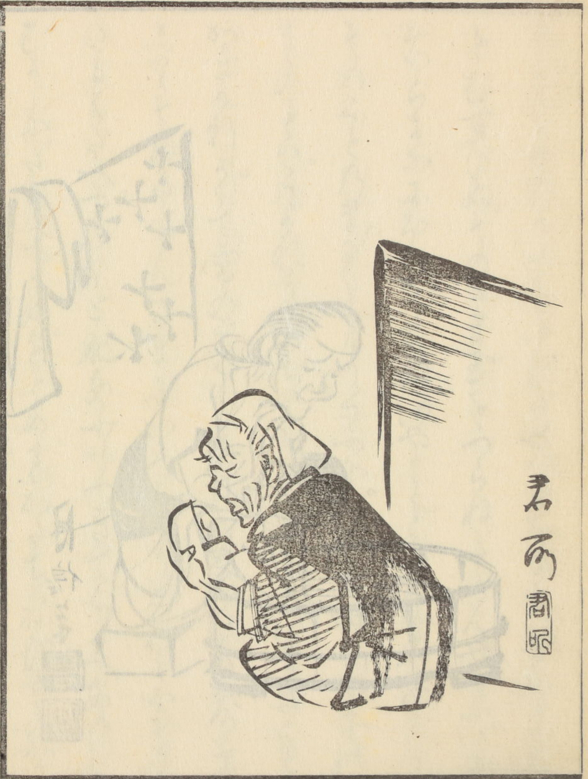
Handwritten text below the illustration, possibly a title or a short story. It includes a small square seal or stamp.

Handwritten text in a cursive script, likely Persian or Urdu, arranged in approximately 11 horizontal lines. The script is dense and fills most of the page area.