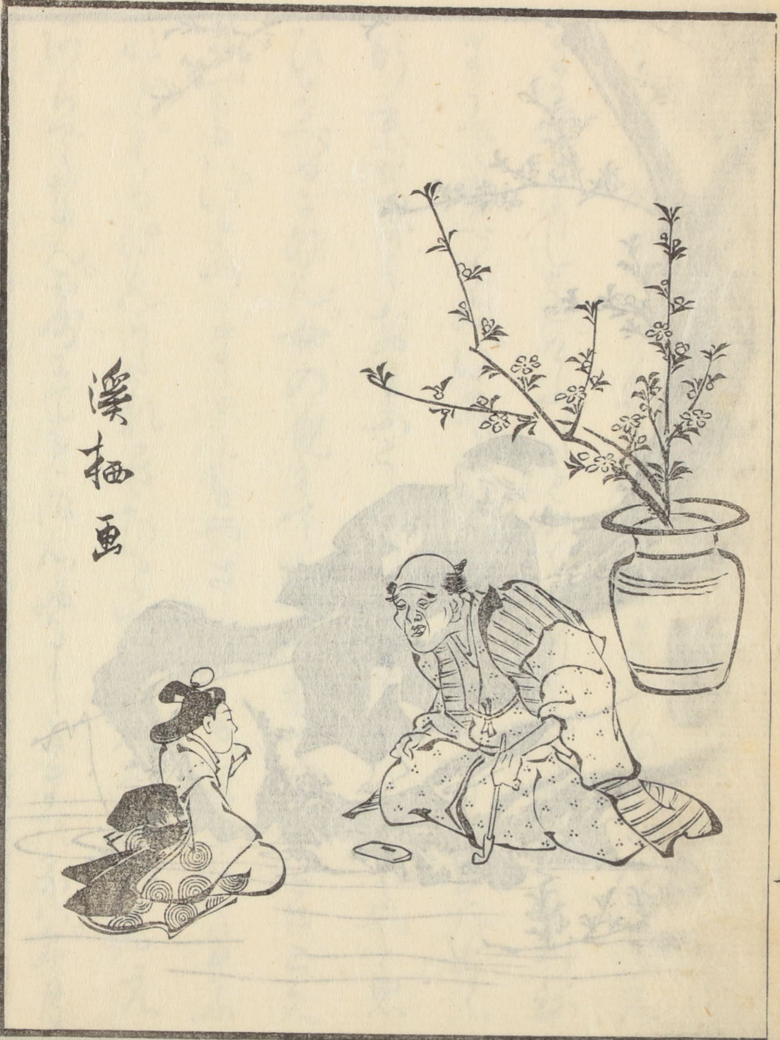
溪 柳 画

おおむねのむねもなほさすなれば。 たゞのやまのむねもなほさすなれば。 さらばのむねもなほさすなれば。 うらやまのむねもなほさすなれば。 いづれかむねもなほさすなれば。 うらやまのむねもなほさすなれば。 さらばのむねもなほさすなれば。 うらやまのむねもなほさすなれば。 いづれかむねもなほさすなれば。 うらやまのむねもなほさすなれば。 さらばのむねもなほさすなれば。