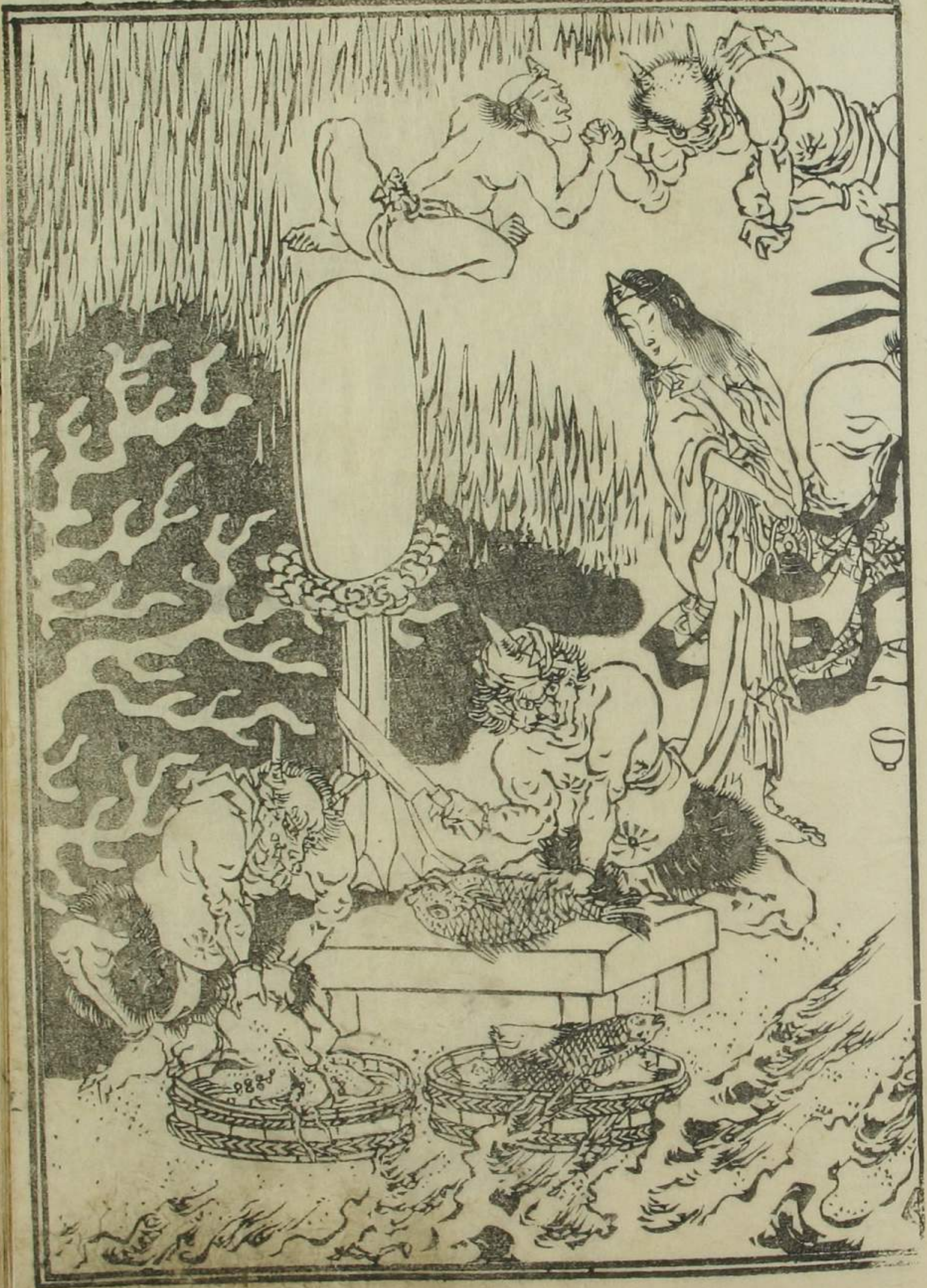
地獄の祭の之の圖