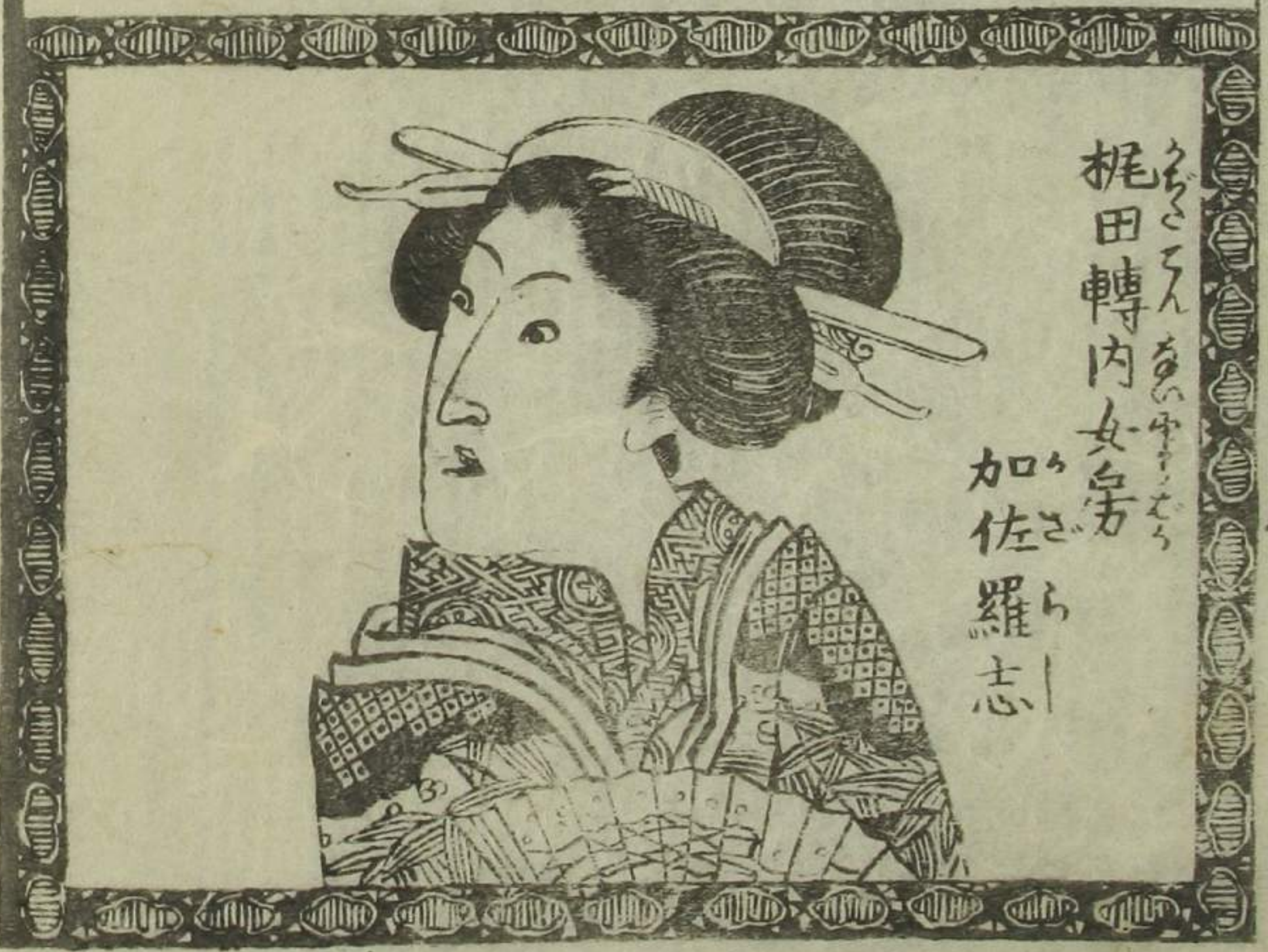
梶田轉内女房 加佐羅志