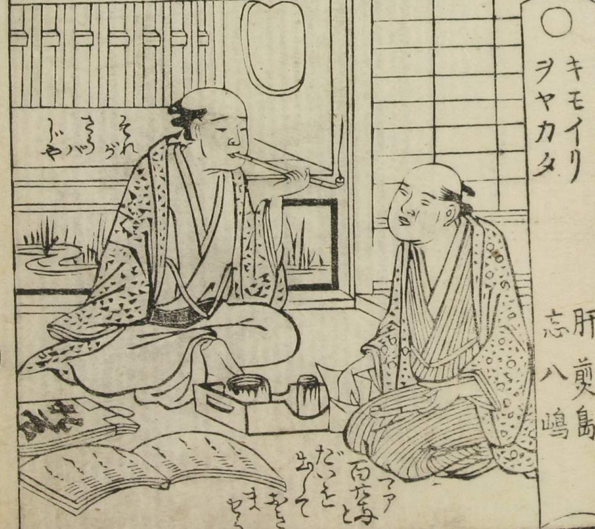
○キモイリ ヲヤカタ

くこさうく川 じごさうらうそ きんかんふん してゆきま 又ニウトメ板 とつ板 ろまなびご 岨よごさう こまわらと あとくをさ ままを中 ゆえんハちう