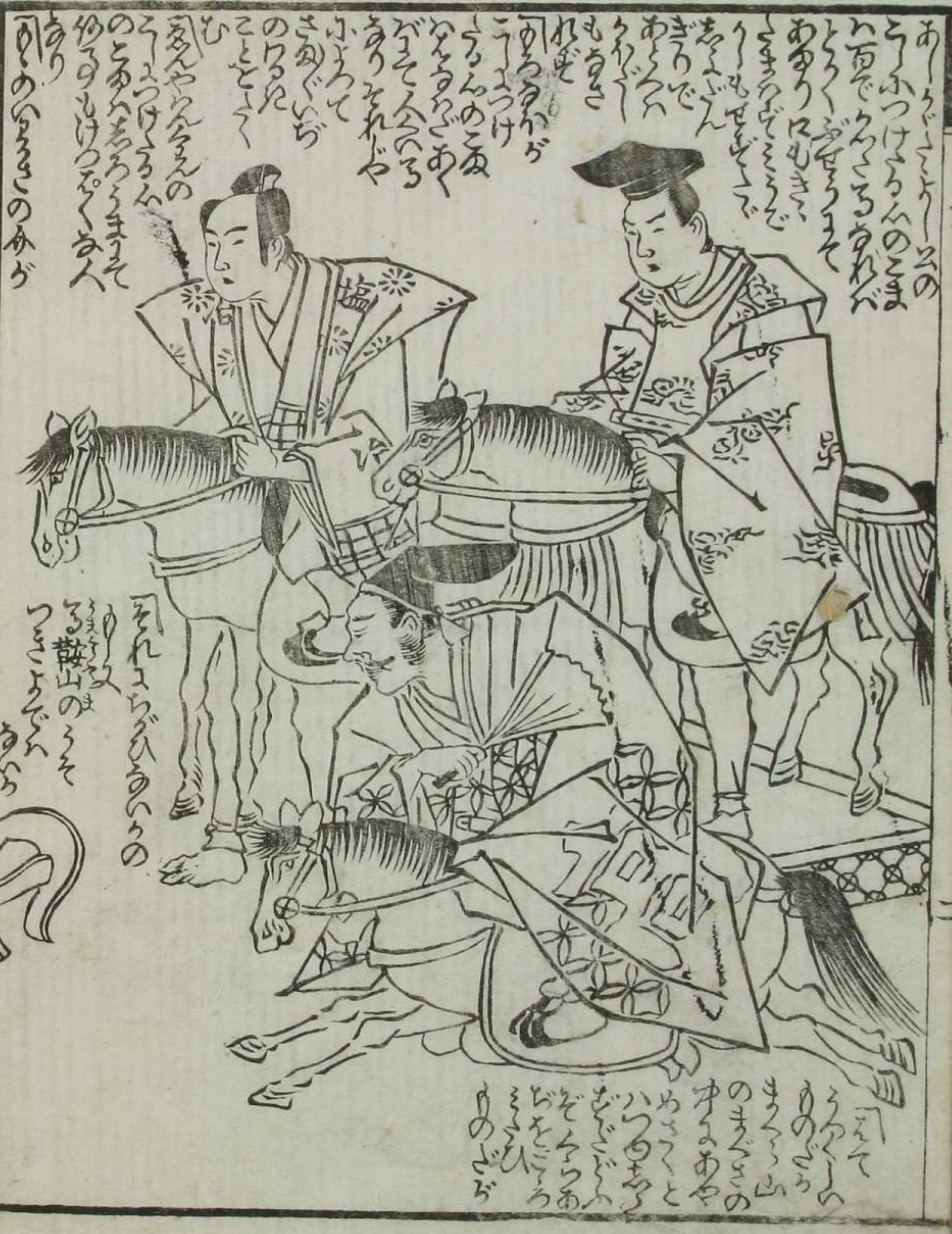
Figure 1 Figure 2 Figure 3 Figure 4 Figure 5 Figure 6