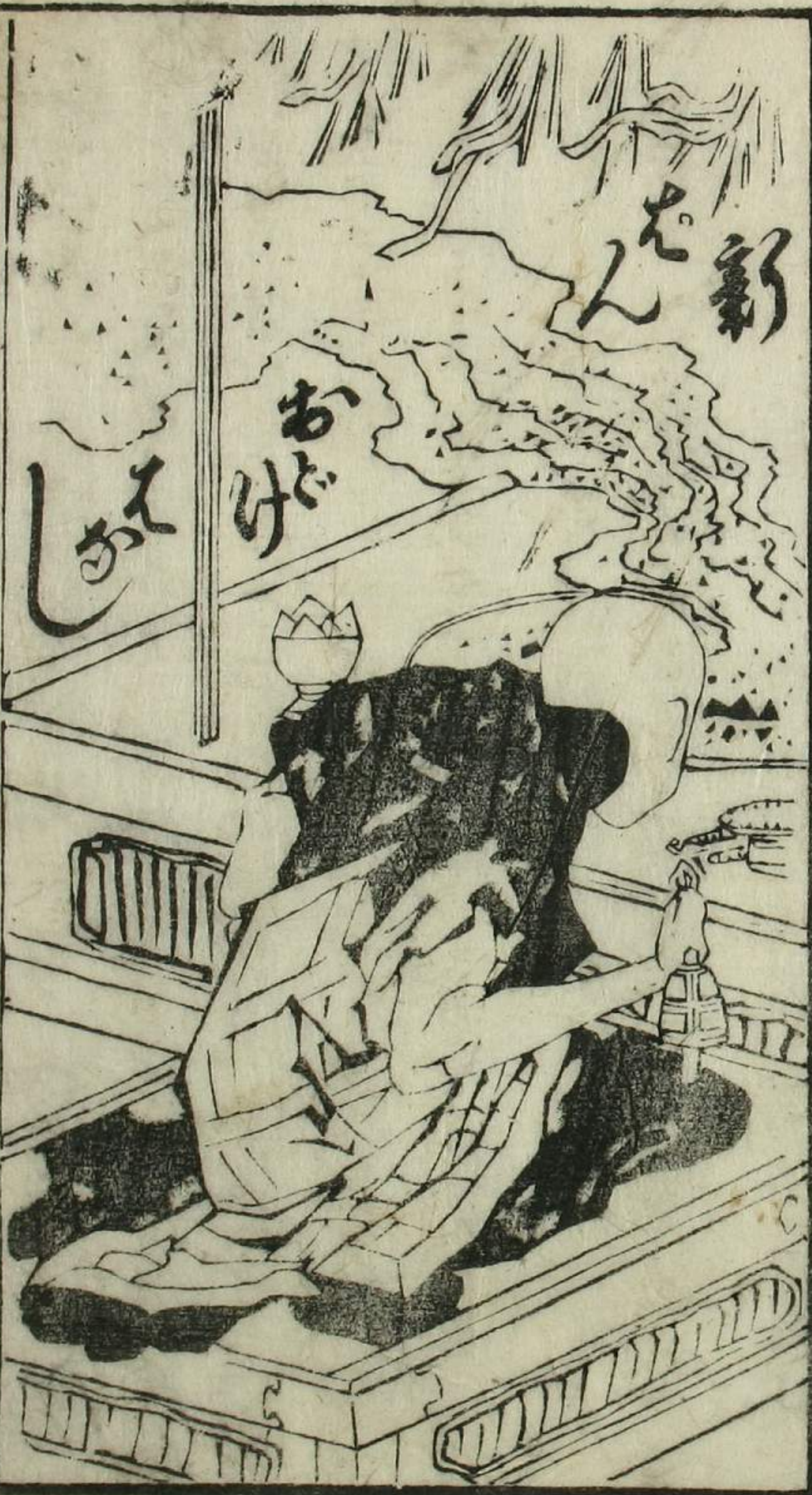
大坂目録後巻下巻末の平安板