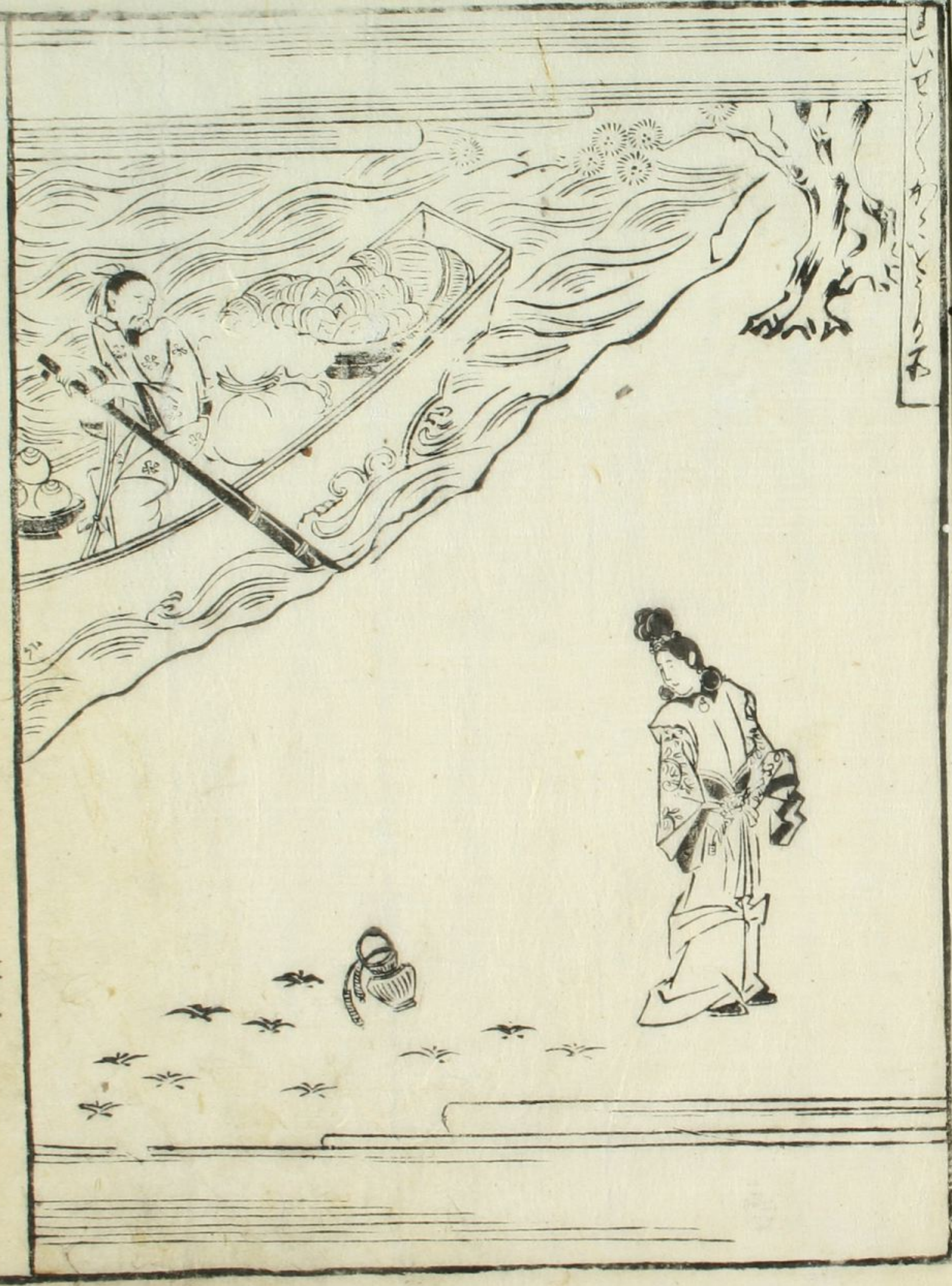
舟に荷物を載せて下る舟

してそれらよりいづれの方法の本別はさうけ海と云わ りていづれにさういふおはあさうともあ。海と云わ 方は乃本別根にれかうらうけあかへんあまうり てゆえとてそれらさういふ一体とれりち方は本別乃ち うとてさういふいづれ一雁燕居をともりの御も四 ていつく方はと假て假とてさういふはゆいもさういふ してのさういふおはあさういふ海を東の時ゆいむりてん 船をいづれとてさういふはゆいもさういふはゆいも まじりやうれおはあさういふはゆいもさういふはゆいも さういふはゆいもさういふはゆいもさういふはゆいも さういふはゆいもさういふはゆいもさういふはゆいも さういふはゆいもさういふはゆいもさういふはゆいも