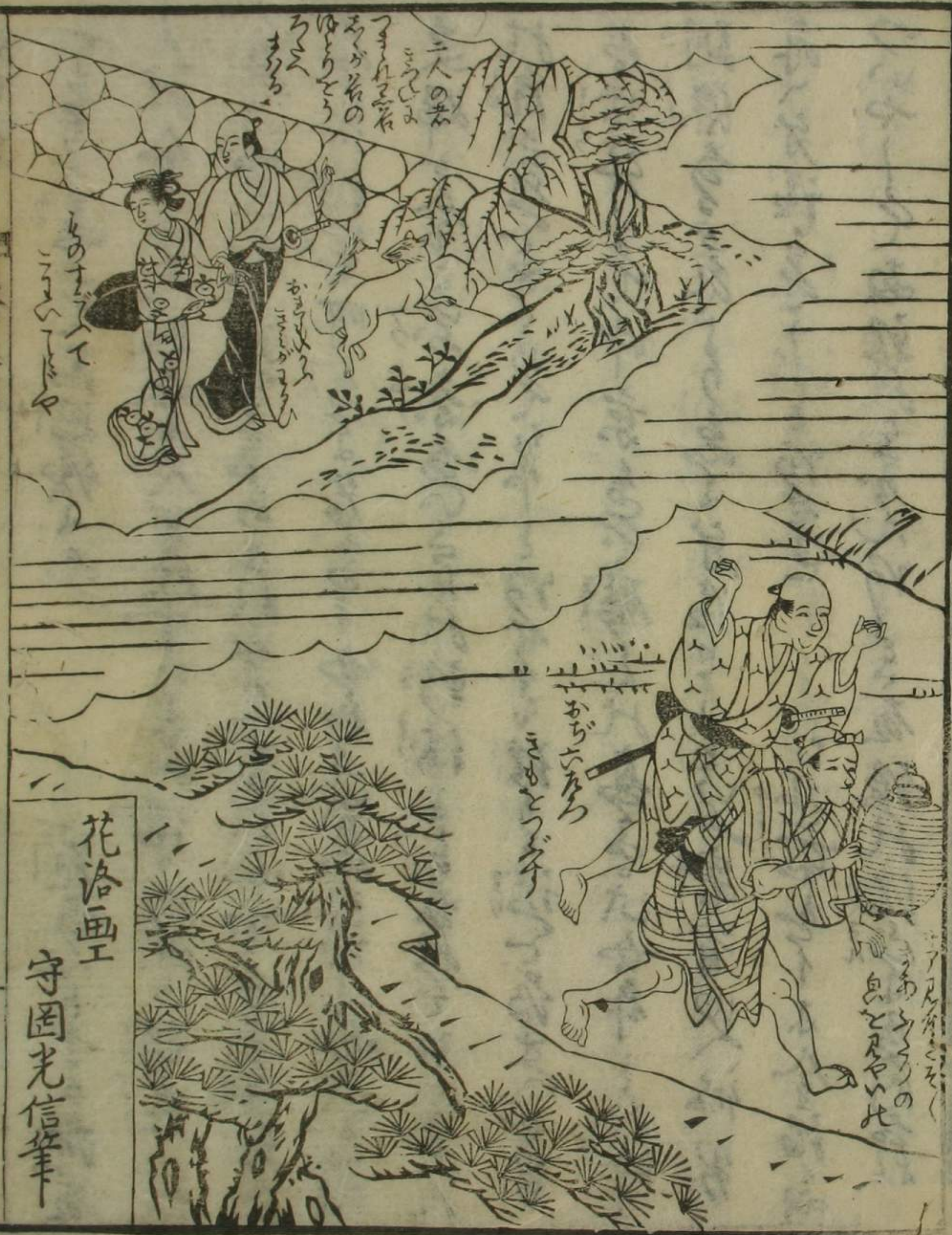
花洛画工 守固光信筆