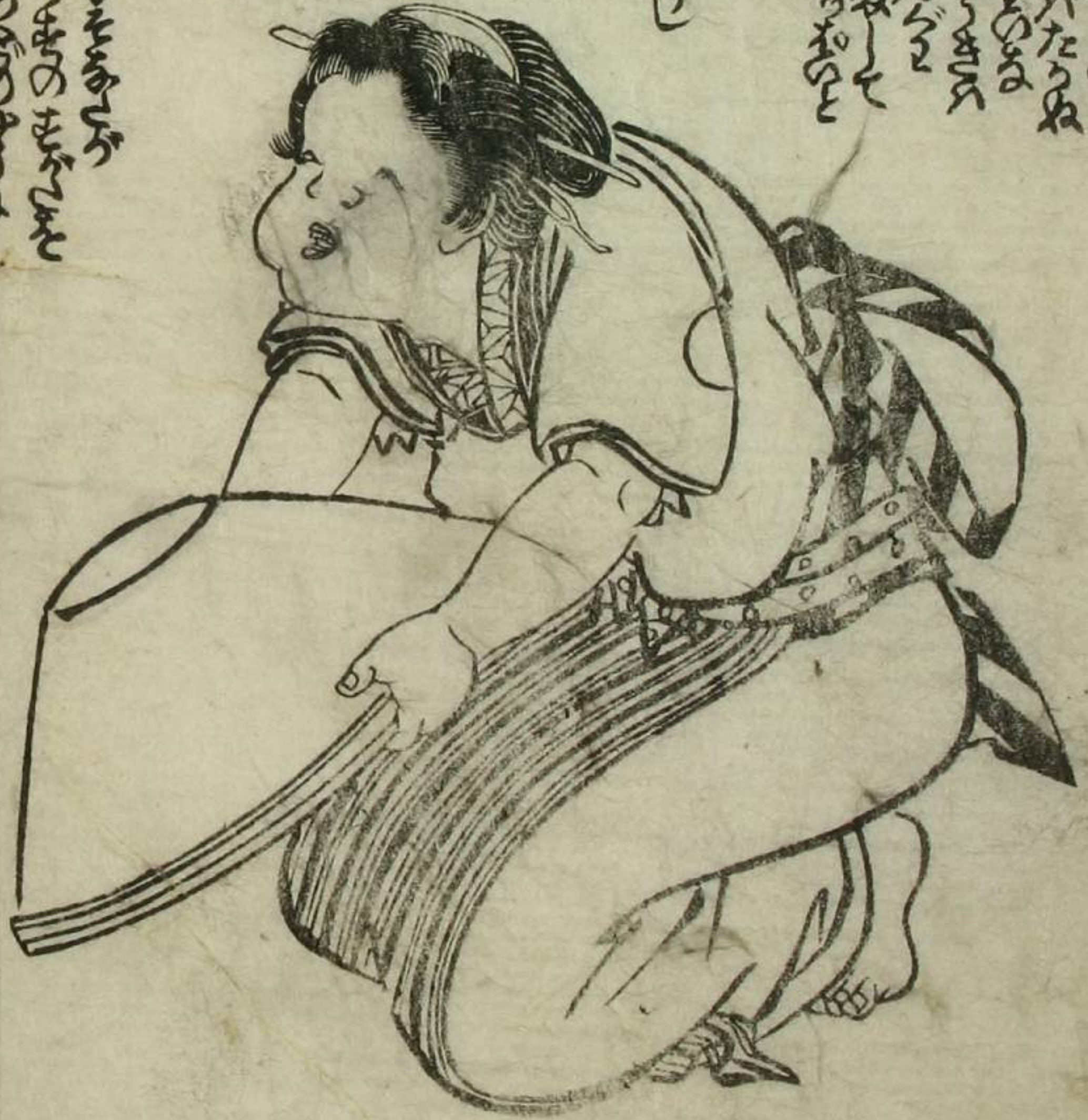
下女 掃除の事 洗濯の事 縫製の事 炊爨の事 洗滌の事 洒掃の事 などあり

下女は主人の御用儀に 従ひて仕度する事なり 其の仕度には 掃除の事 洗濯の事 縫製の事 炊爨の事 洗滌の事 洒掃の事 などあり 其の仕度には 主人の御用儀に 従ひて仕度する事なり 其の仕度には 掃除の事 洗濯の事 縫製の事 炊爨の事 洗滌の事 洒掃の事 などあり