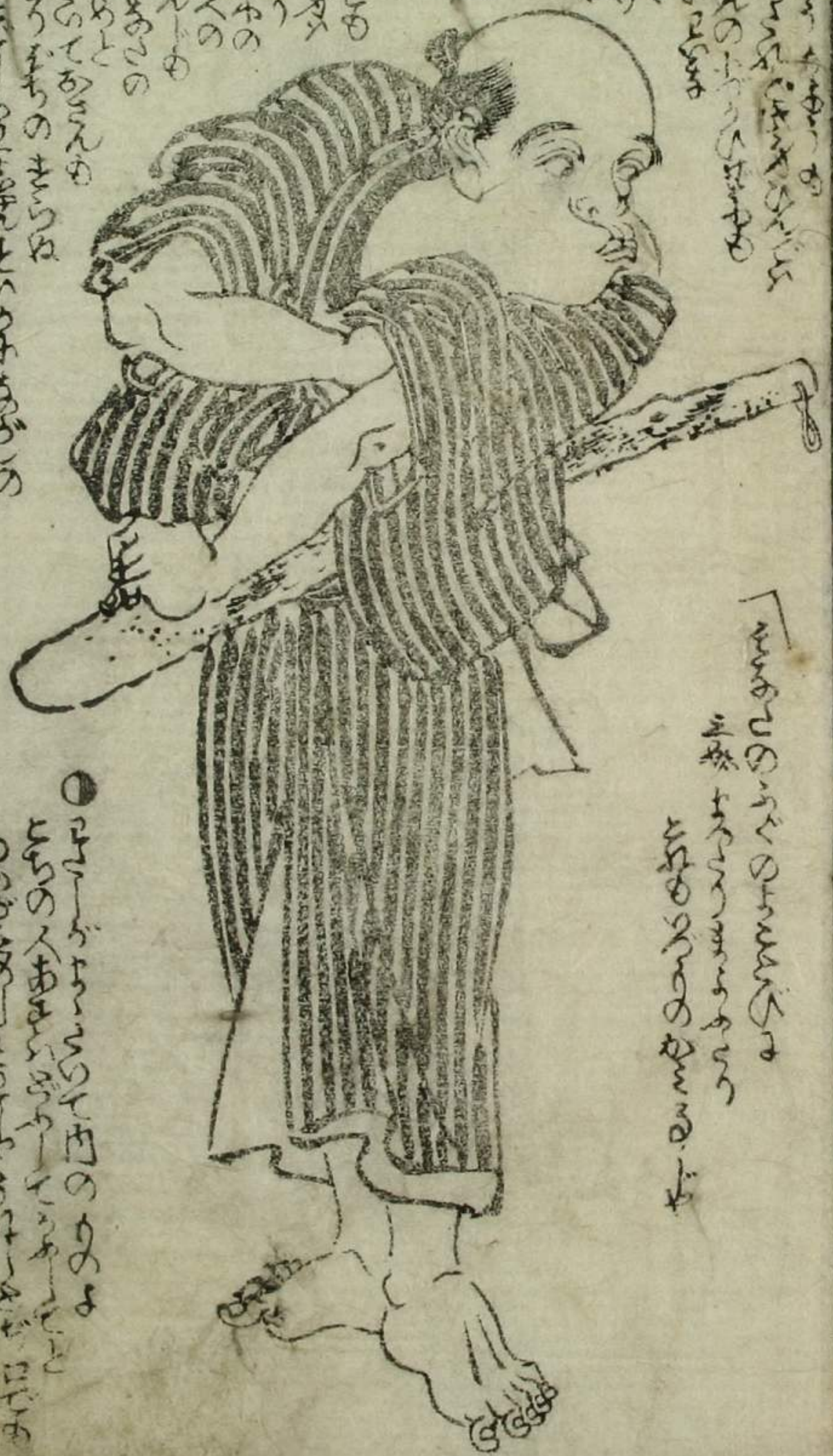
主人 掃除の事 洗濯の事 縫製の事 炊爨の事 洗滌の事 洒掃の事 などあり

下女は主人の御用儀に 従ひて仕度する事なり 其の仕度には 掃除の事 洗濯の事 縫製の事 炊爨の事 洗滌の事 洒掃の事 などあり 其の仕度には 主人の御用儀に 従ひて仕度する事なり 其の仕度には 掃除の事 洗濯の事 縫製の事 炊爨の事 洗滌の事 洒掃の事 などあり