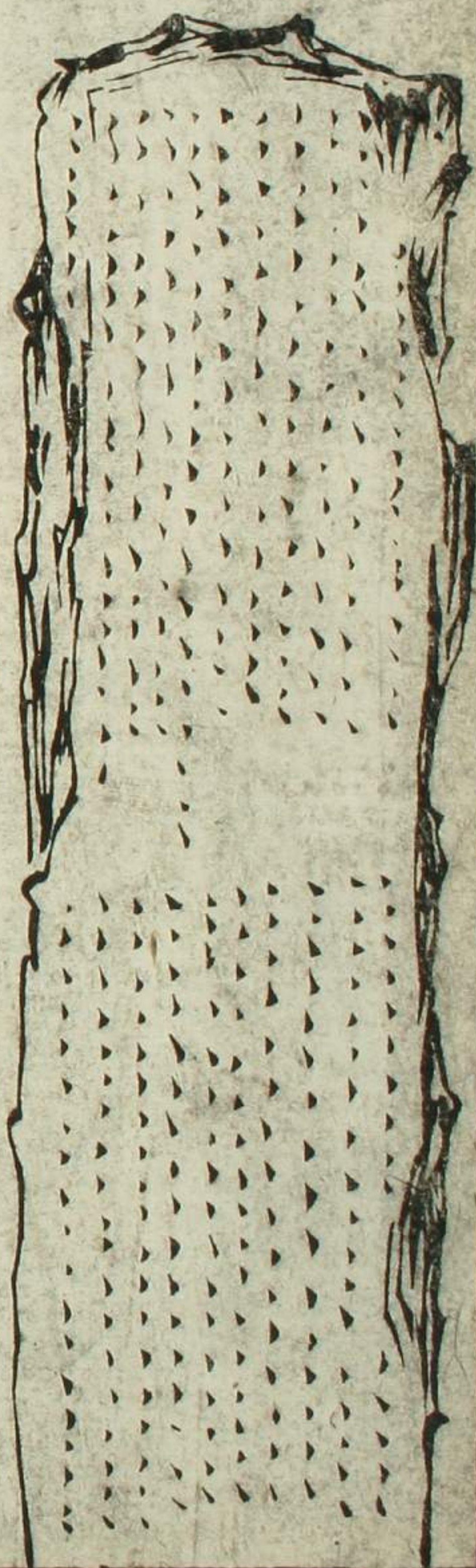
石 碑 圖

碑高六尺餘廣壹尺五寸餘厚壹寸五分許所題倭歌廿壹首分為二段上段十一行下段十行上段第二首上有恭佛跡三字第九首上有一十七首四字下段第七首上有呵嘖生三字第九首上有死字蓋十七首讚佛跡歌也四首詠呵嘖生死歌也