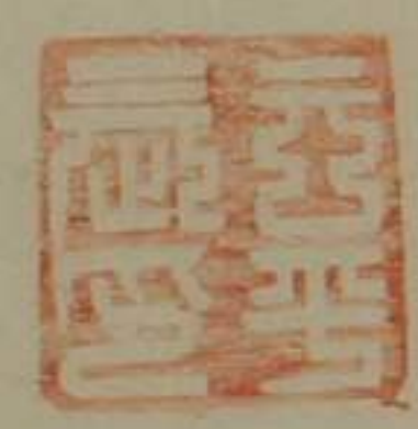
五平長印銅印鼻鈕