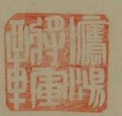
鷹揚將軍章銅印商金龜鈕