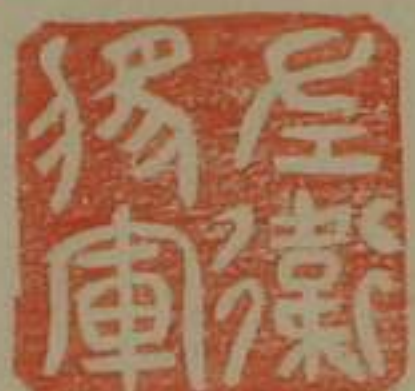
左衛將軍銅印龜鈕 漢舊儀云典京師兵衛四夷屯警