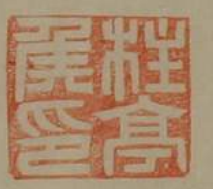
柱亭侯印銅印塗金龜鈕