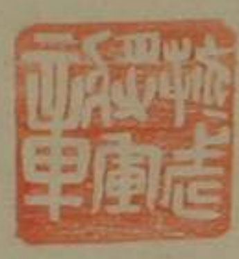
振武將軍章銅印龜鈕