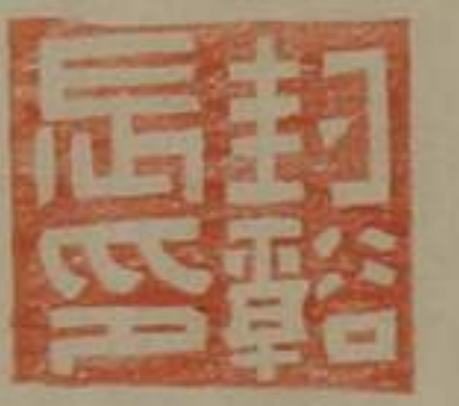
封溪長印銅印尾鈕 又極古拙字皆隸法