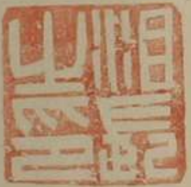
沮長之印 一統志 漢臨沮屬南郡後周置沮州