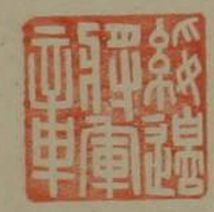
綏邊將軍章銅印龜鈕