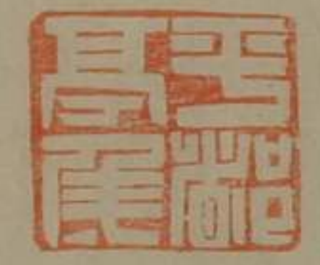
平都亭侯銅印鼻鈕