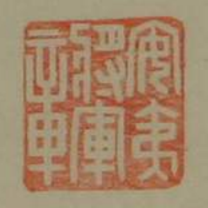
安夷將軍章銅印龜鈕