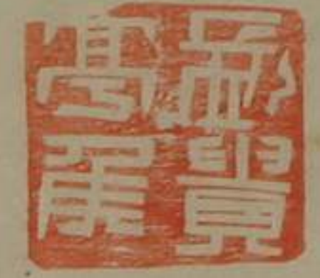
長貴亭侯銅印塗金龜鈕