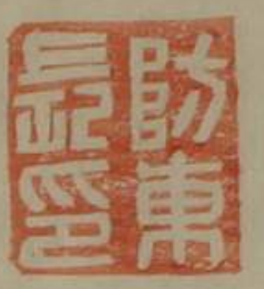
防東長印銅印鼻鈕 東漢山陽郡有防東縣