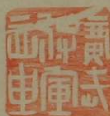
廣武將軍章銅印塗金龜鈕