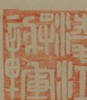
凌江將軍章銅印商銀龜鈕