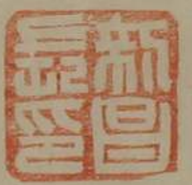
新昌長印銅印鼻鈕 西漢屬遼東郡