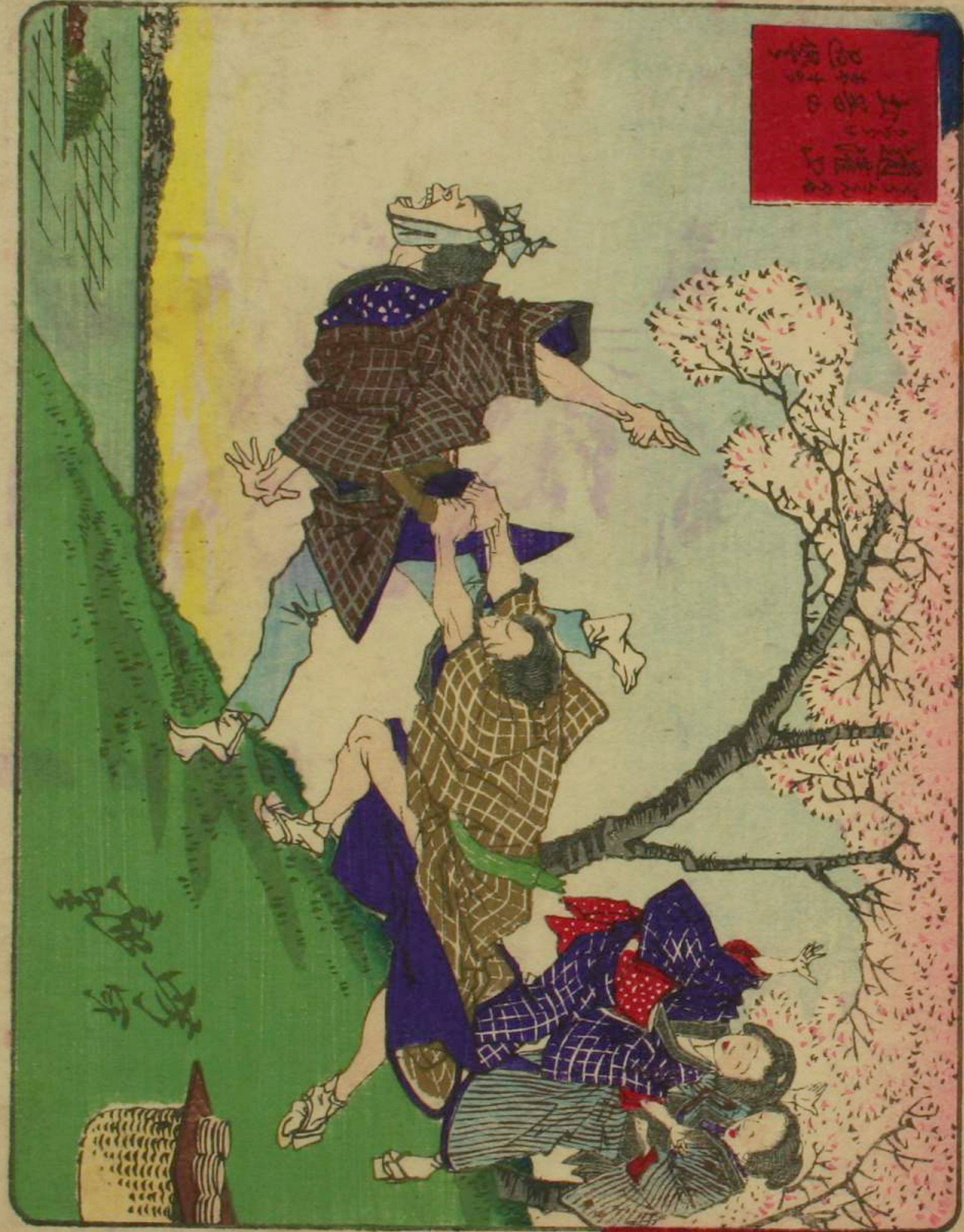
東京潮の世間名所