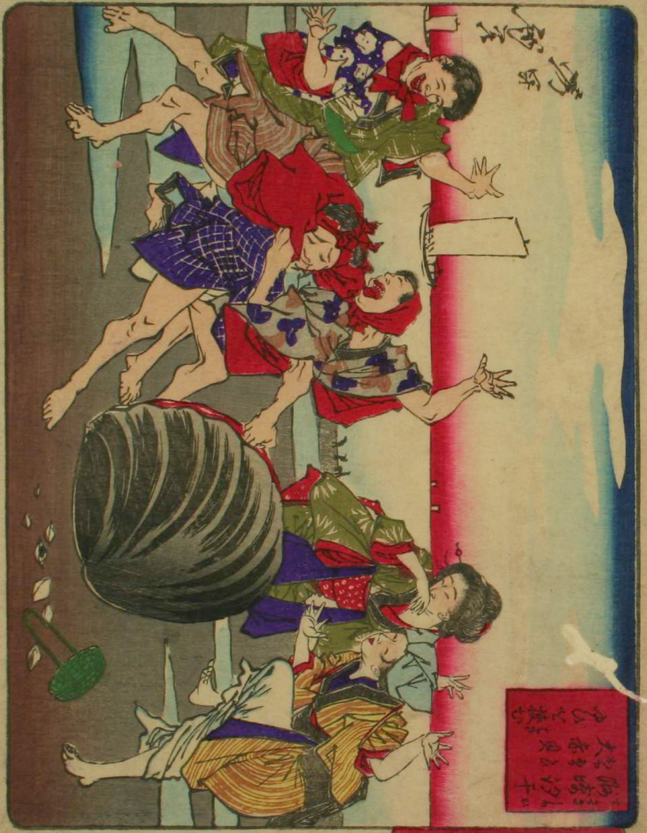
東京關化狂島名所