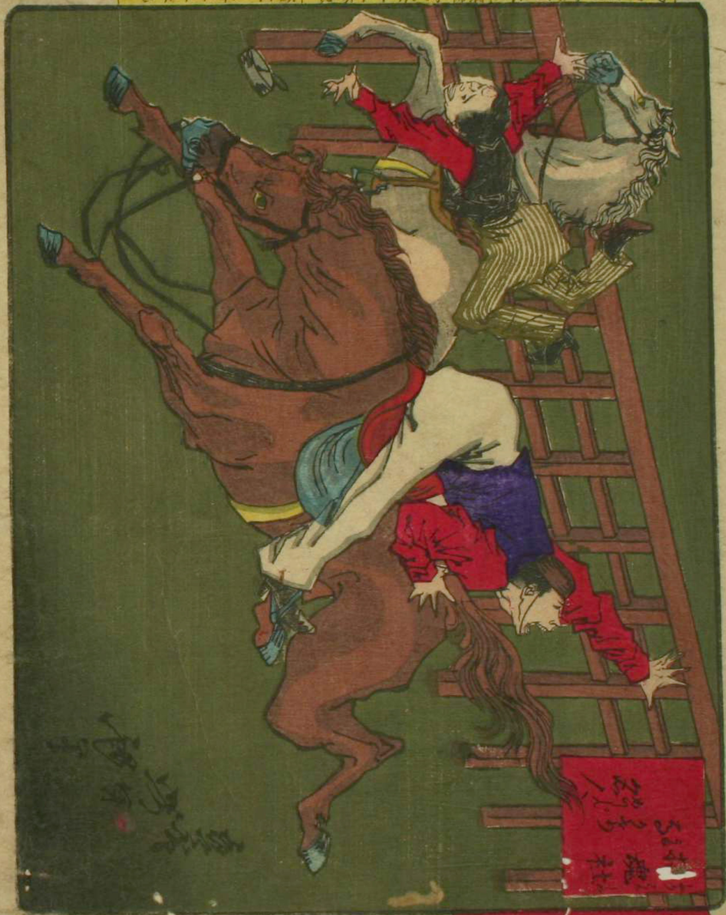
東京開化狂馬名所

御届明治十年一月六日 標津宮永十廿五番地 旗草瓦町十二番地 西二月岡米次郎 出版人 觀島龜吉