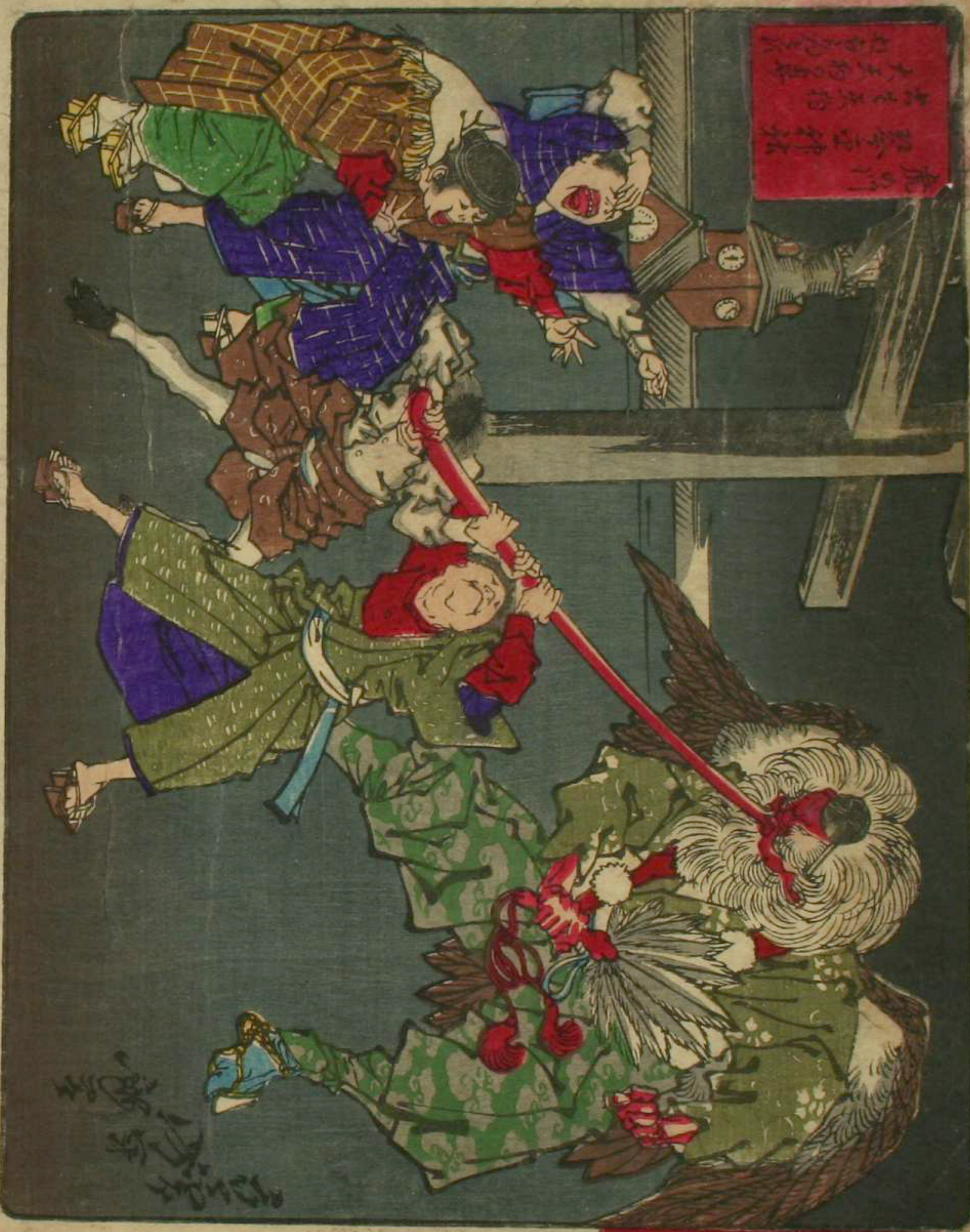
東京關化狂島名所