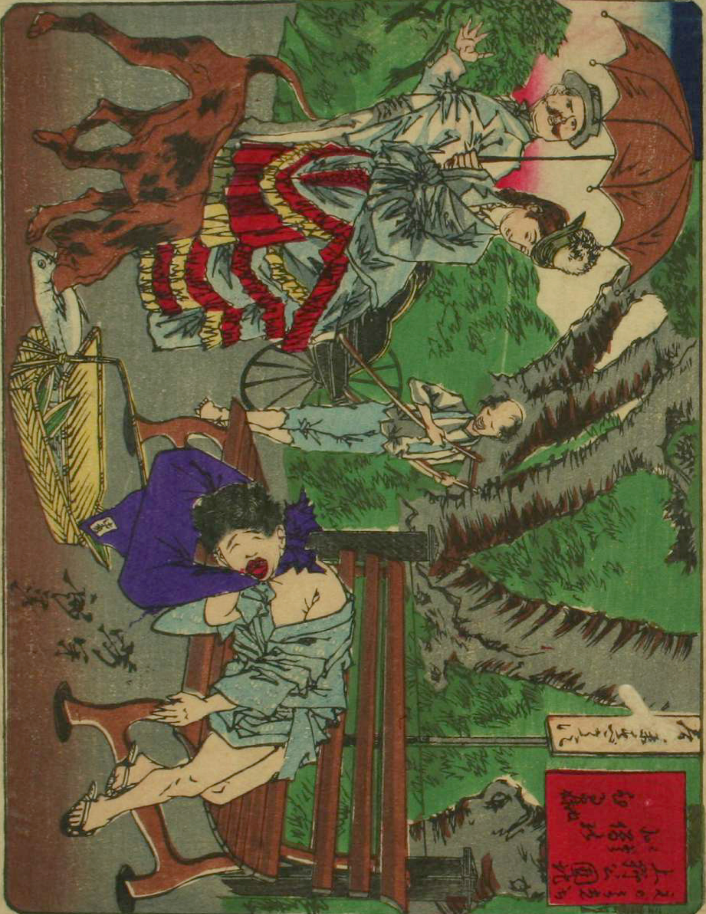
東京開化狂馬名所

御届明治十年一月六日 標津宮永十廿五番地 旗草瓦町十二番地 西二月岡米次郎 出版人 觀島龜吉